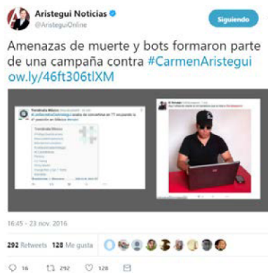
Figura 5. Tuit de Carmen Aristegui denunciando la campaña de troleo

Entre las principales vulneraciones de derechos humanos que ha sufrido la periodista Carmen Aristegui y sus familiares destacan la intimidación, las campañas de desprestigio, la criminalización de sus actividades y el ciberespionaje de sus comunicaciones. Según Amnistía Internacional, las campañas de desprestigio son otro de los mecanismos que utilizan los perpetradores para que las personas defensoras de derechos humanos pierdan el apoyo social en sus actividades. En este caso, Aristegui sufrió una estrategia sofisticada de troleo, es decir, de ataques coordinados y masivos a través de redes sociales para intimidar y desacreditar su labor.