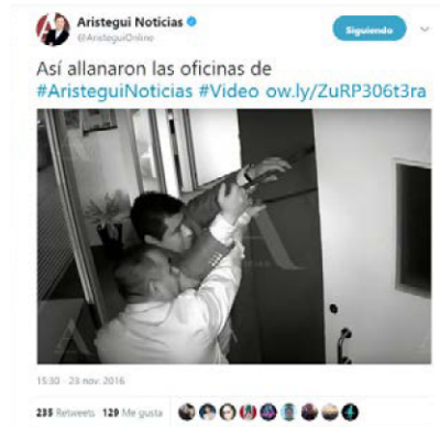
Figura 4. Tuit de Carmen Aristegui denunciando la campaña de troleo