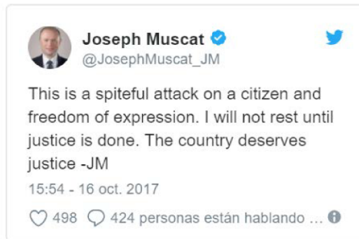
Figura 3. Tuit del primer ministro maltés

El propio primer ministro de Malta, Joseph Muscat, aludido directamente en las revelaciones de Galizia al tener vínculos con los Papeles de Panamá, lamentó la muerte de la periodista tras conocerse la noticia (Figura 3).