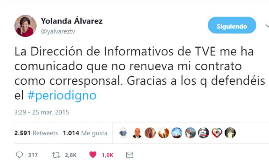
Figura 8. Tuit de Yolanda Álvarez en el que corrobora la no renovación del contrato