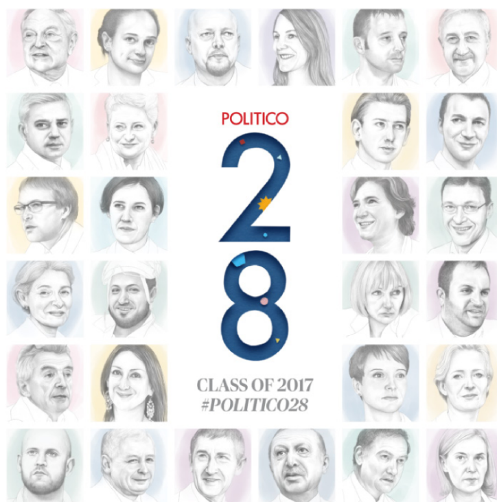
Figura 1. Las 28 personas más importantes de Europa para Politico

La periodista Daphne Caruana Galizia (1964-2017) fue una de las profesionales de la información más prestigiosas en Malta. El periódico europeo Político 6 la consideró una de las 28 personalidades que mueven Europa en 2017: “una sola mujer, que lucha contra la falta de transparencia y la corrupción en Malta [...], es como una Wikileaks” ( Político , 2017) (Figura 1).