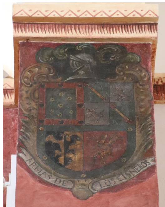
Fig. 6. Escudo heráldico de la familia Cisneros en la pilastra del arco triunfal (siglo XVIII).