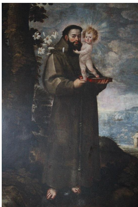
Fig. 13. Juan Ramírez de la Fuente, San Antonio de Padua (1629).