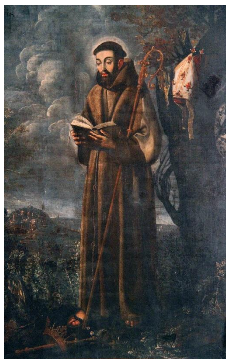
Fig. 14. Círculo de Juan Ramírez de la Fuente, San Luis de Tolosa (h. 1629).