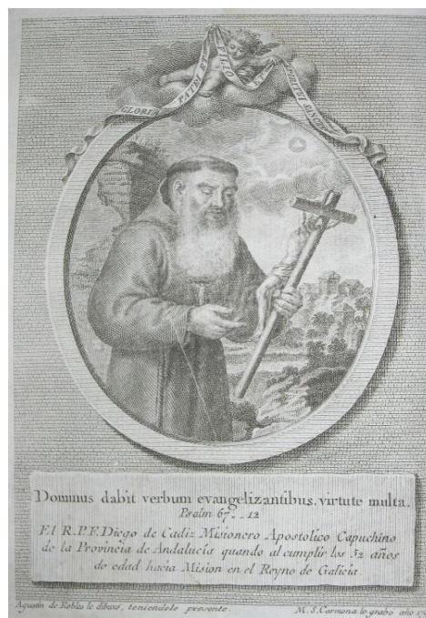
Fig. 3. Manuel Salvador Carmona, Grabado de Fray Diego José de Cádiz (1795).

Fray Diego José de Cádiz fue al mismo tiempo un verdadero promotor de las artes. Su honda devoción a la Virgen de la Paz de Ronda constituyó el inicio de una promoción artística