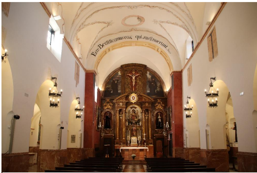
Fig. 4. Perspectiva espacial del interior del templo capuchino.

Por ejemplo, en el arco triunfal que da acceso a la capilla mayor se inscribe una leyenda latina que reza: “ Ecce beatificamus eos, qui sustinuerunt ”. Su traducción puede interpretarse como “Aquí honramos a aquellos que perseveraron” o bien como “Fíjense que llamamos felices a aquellos que fueron capaces de perseverar”. Una frase que aparece ya citada en el Eclesiastés , capítulo 44, pero que como especifica finalmente el lema del arco triunfal corresponde a la Epístola del apóstol Santiago , 5-11. Lo cierto y verdad es que se trata de una locución muy utilizada por fray Diego en sus homilías y predicaciones multitudinarias, de las que hemos tenido noticias por las publicaciones sacadas a la luz: “Todo con la paciencia se consigue, los efectos de nuestra oración, la perfección de nuestro sufrimiento, y la suerte bienaventurada de nuestras almas: Ecce beatificamus eos qui sustinuerunt . ¡Oh! ¡qué hermosa es esta virtud, y cuán digna de nuestras atenciones para ganar con ella el cielo!” 16