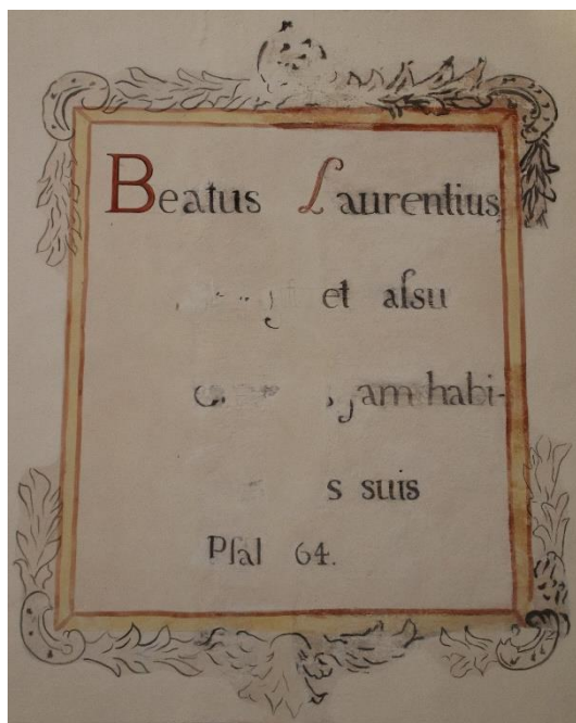
Fig. 5. Pintura en el pilar de la nave central con versos dedicados a Lorenzo de Brindis (h. 1783-1784).