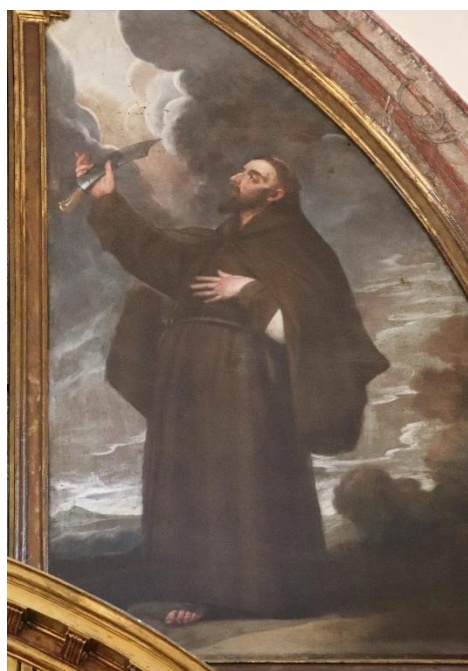
Fig. 12. Juan Ramírez de la Fuente, San Lorenzo de Brindis (1629).