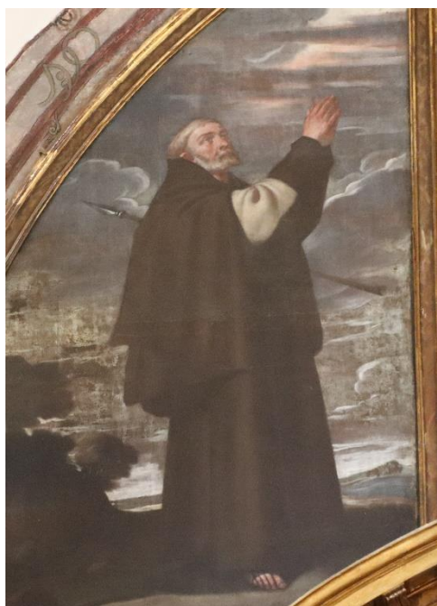
Fig. 11. Juan Ramírez de la Fuente, San Fidel de Sigmaringa (1629).