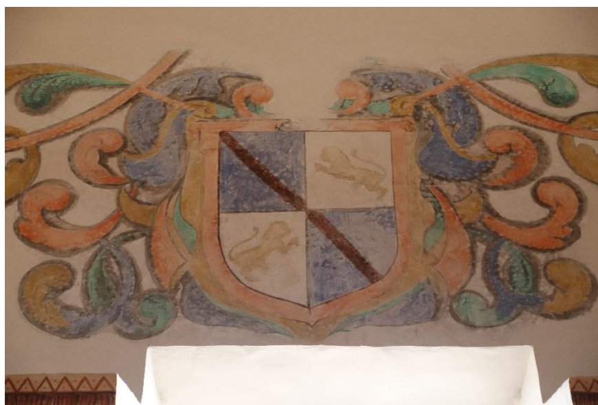
Fig. 7. Escudo heráldico del patrono del convento Baltasar Bastardo de Cisneros en la capilla mayor de la iglesia (siglo XVIII).