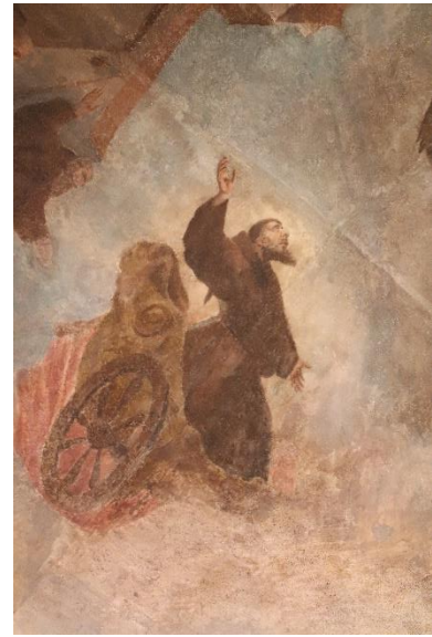
Fig. 9. Detalle de la figura de San Francisco de Asís en el carro de fuego (siglo XVIII).

Con vistas a conferirle un ambiente divino y de carácter espiritual al acontecimiento maravilloso el anónimo autor dispone a numerosos querubines en las zonas de las pechinas, conforme a gestos movidos y actitudes de sorpresa, que no ocultan las partituras musicales en las que se apoyan para cantar. Testigos del acontecimiento son los religiosos franciscanos, aquí definidos en su versión capuchina por el distintivo de la barba larga y el hábito de capucho puntiagudo. 23 Todos ellos, nueve en total, patentizan gestos arrobados y expresivos, en tanto comentan entre ellos tan extraordinario evento. Justo detrás se vislumbra el inmueble conventual, donde sobresale la estructura del templo relacionada por algunos investigadores con la recreación de la iglesia de los capuchinos de Málaga. Este aserto no corresponde con la realidad, pues hay diferencias notables, sobre todo, en la reducción de tres a una sola nave y la inclusión de capilla mayor con cúpula semiesférica (fig. 10). En definitiva, la obra pictórica denota un acertado tratamiento de la espacialidad fingida, una utilización de la pincelada suelta –creando un ambiente vaporoso– y un manejo de la paleta cromática de tonos terrosos.