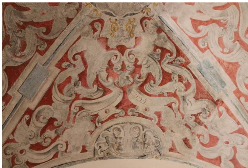
Fig. 8. Pormenor de la bóveda perteneciente a la capilla de hermandad del Prendimiento (siglo XVIII).

En la nave de la epístola encontramos dos paños de bóveda de aristas con decoración pictórica dieciochesca de muy diferente estética. En el segundo tramo, correspondiente a la capilla de la hermandad del Prendimiento, aparecieron en la última restauración unas pinturas decorativas, cuyo suntuoso y recargado diseño trata de imitar de manera ilusoria los trabajos de yesería tan propios de la época. En realidad, solo pudo ser rescatada la mitad de su extensión, así que repitiendo el diseño se recrearon en el espacio restante con un óptimo resultado. El esquema compositivo traza, a partir de un florón central y el refuerzo separador de los nervios (en blanco y azul), todo un entramado de cintas, acantos, perfiles apergaminados, tornapuntas y puttis en grisalla, que se hacen resaltar por un fondo de intensa tonalidad roja (fig. 8). Un diseño que corresponde a plantillas muy utilizadas por los talleres malagueños del último barroco y que, además, vemos repetido en otras casas franciscanas de la zona. El caso más significativo es el de la cúpula de la capilla mayor del convento de los Ángeles de Málaga 19 , de franciscanos recoletos, aunque no deben obviarse en ningún momento las concomitancias con las decoraciones pictóricas de la antigua capilla sacramental del convento de los capuchinos de Antequera 20 y las grisallas del claustro del convento de la Magdalena de la misma ciudad, de franciscanos alcantarinos. 21