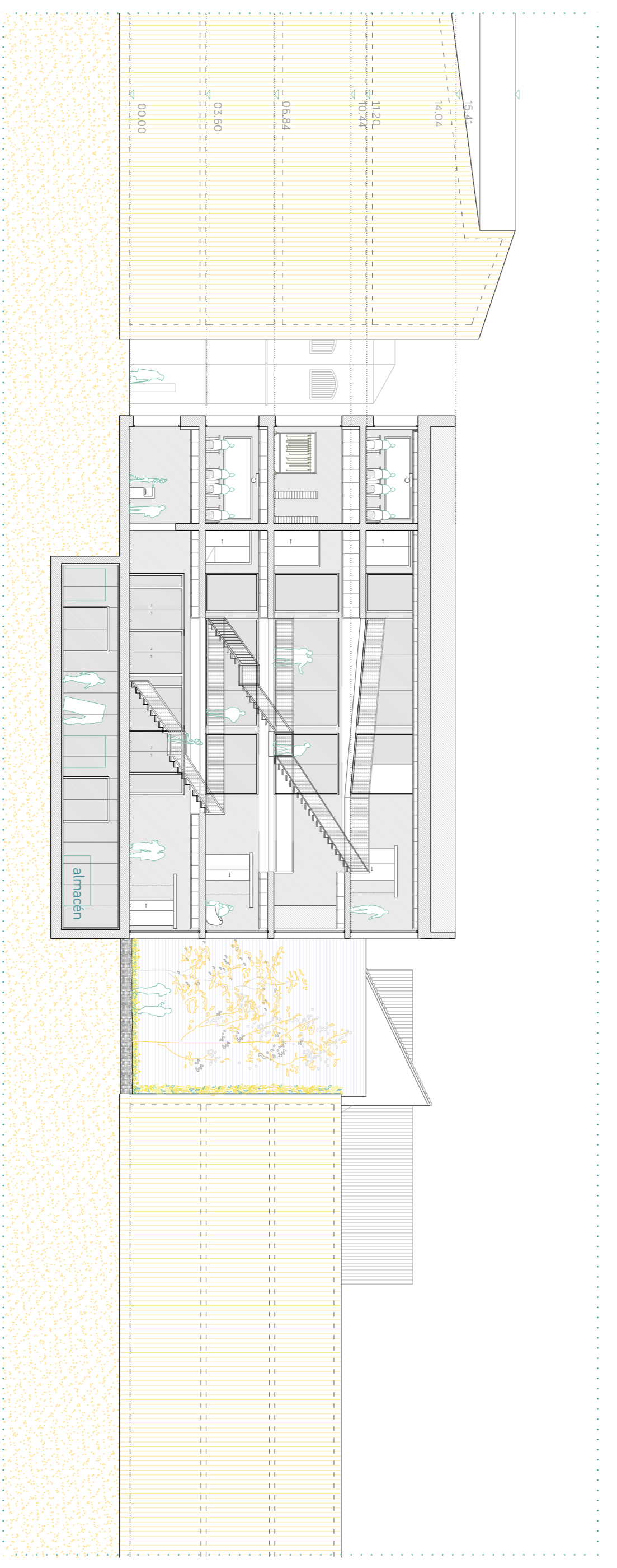
SECCION C-C e.1.200

En planta segunda , desde el hall tenemos acceso a diversas áreas, por un lado, el brazo de salas de edición, producción y grabación , más enfocadas en el vestibulo y el almacén y zona de estos elementos, y finalmente a través del corredor de servicios saliendo al exterior se llega a la terrace situada en la cubierta del edificio B . Tras el paso por esta cubierta podemos acceder al interior de este segundo edificio donde aparecen una sala de descanso y una serie de salas de trabajo/estudio para los alumnos.