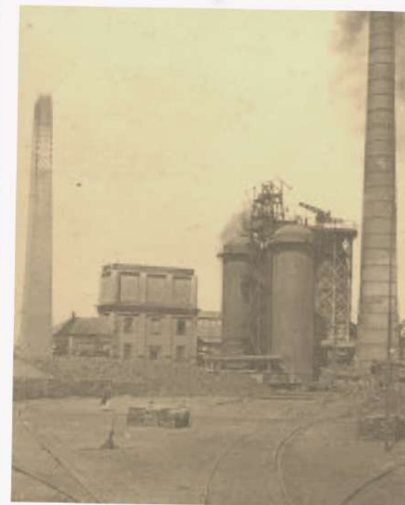
Paisaje industrial de Málaga (s. XIX)

📖 Referencia historiográfica: Jordi Nadal, "El fracaso de la Revolución Industrial en España".