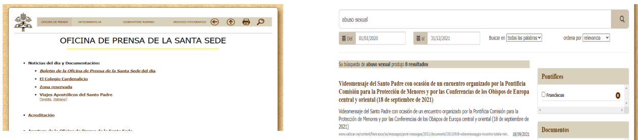
Figura 4. www.vatican.va