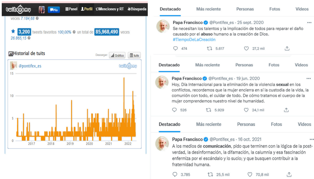
Figura 1. Pontifex_es