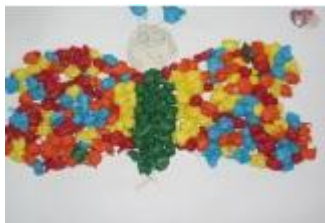
Ilustración 2: Dibujo de niño

Siguiendo con las asignaturas artísticas, las artes plásticas es otra gran fuente motivacional y de desarrollo de la creatividad. Para comenzar no solo se puede desarrollar las habilidades artísticas del dibujo, y de las manualidades sino otras como la crítica. Al pensar en la asignatura de plástica solemos relacionar a esta con las manualidades, o con dibujos que los niños suelen hacer sobre todo en primaria, privándola del valor que realmente tiene esta, es decir, la educación artística generan conocimientos a través por ejemplo del lenguaje visual.