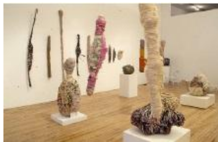
Ilustración 3: Obra de Judith Scott

Por último otra de las muchas que existen es realizar ejercicios sobre un cuento a través del desarrollo de la caracterización, movimiento y sensibilidad emocional.