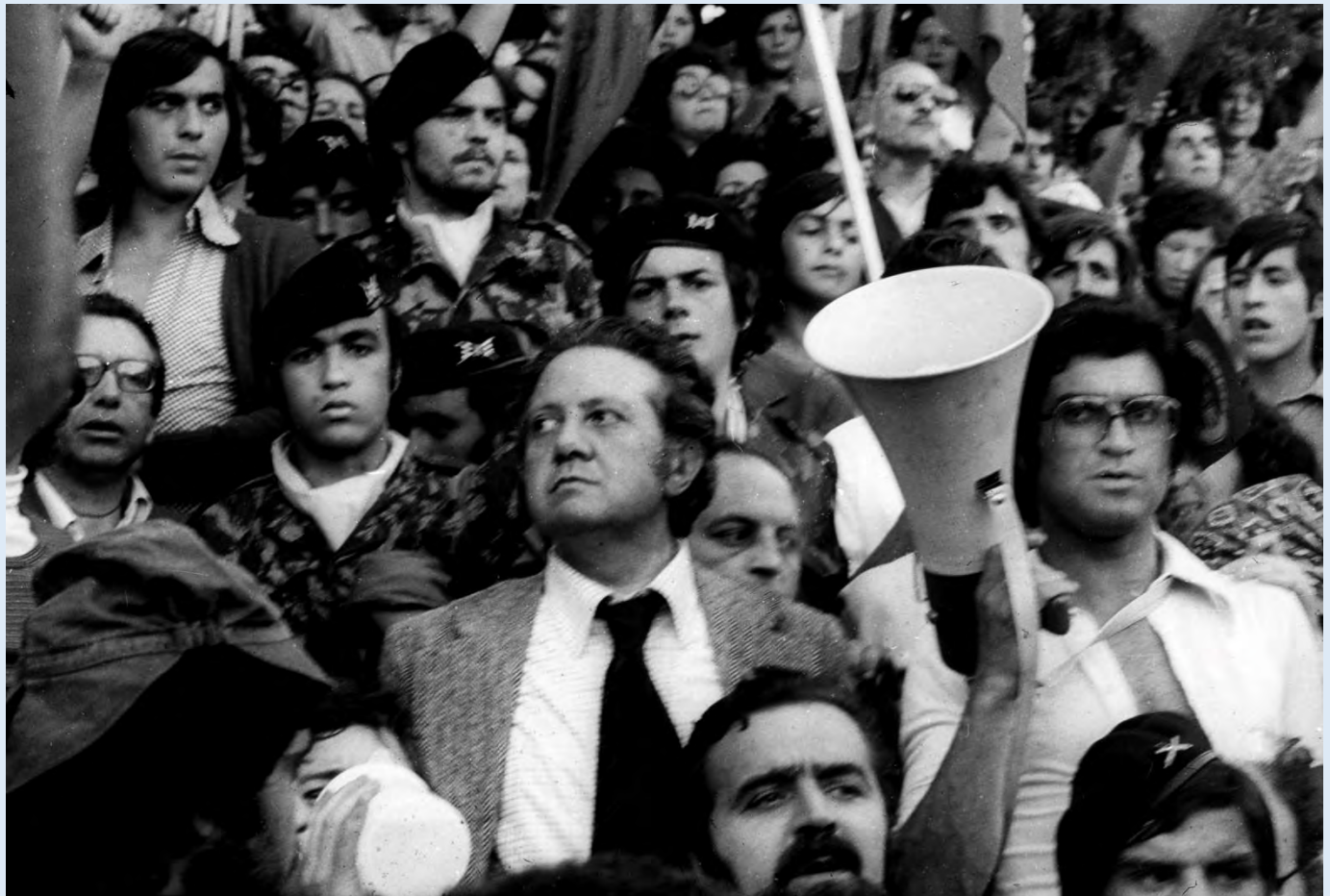
Arriba: Alvaro Cunhal PCP / Abajo: Mario Soares PSP