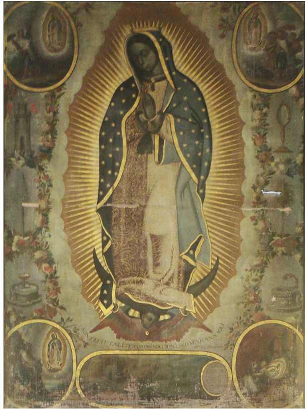
Fig. 6. Virgen de Guadalupe "Tota Pulchra" . Pedro LÓPEZ CALDERÓN, 1725. Iglesia del exconvento del Carmen, Sanlúcar la Mayor (Sevilla).

Aunque muy resumidas, estas consideraciones nos sirven para interpretar algunas particularidades de las copias guadalupanas firmadas por López Calderón, además del hecho de que la mayoría de ellas estén o estuvieran en el ámbito sevillano. Existen de distinto formato: desde láminas de cobre de pequeño tamaño y que deducimos para uso doméstico y popular (colección Calderón; 30 x 25 cm.) a lienzos de grandes dimensiones y elaborados diseños para el culto en templos y clausuras. Entre estos últimos, destacan, en Sevilla, la del monasterio de Santa María la Real de Bormujos (202 x 121 cm.) y la de iglesia del exconvento del Carmen de Sanlúcar la Mayor (207 x 134 cm.).