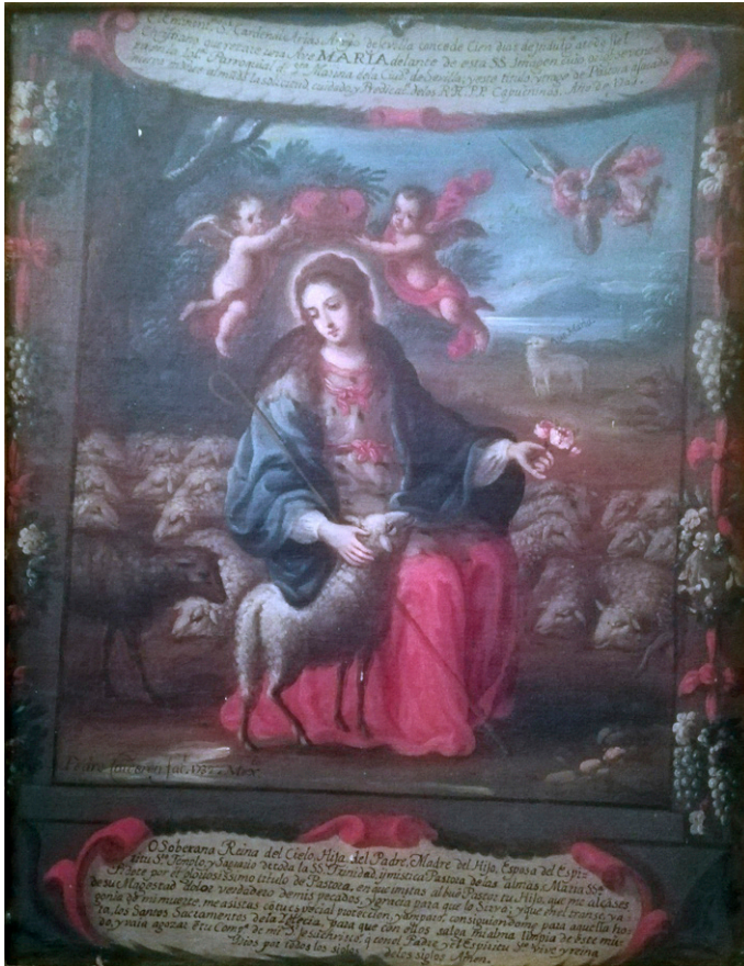
Fig. 3. Divina Pastora . Pedro LÓPEZ CALDERÓN, 1732. Iglesia de la Divina Pastora (Padres Capuchinos), Sevilla.

riojana que conocemos. Pudiera considerarse superior, incluso, a las de pinceles mucho más afamados como los de José de Ibarra (Colegio de las Vizcainas, Ciudad de México) o Miguel Cabrera (Museo de Arte de Filadelfia).