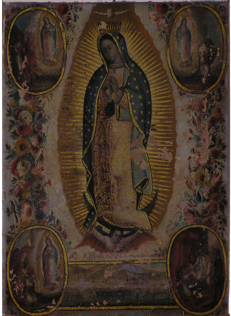
Fig. 4. Virgen de Guadalupe . Pedro LÓPEZ CALDERÓN, 1719. Colección particular, Sevilla.

Digno de mención resulta también, en este mismo estudio del profesor Montes, el acercamiento realizado a la figura de López Calderón. Los datos biográficos reunidos son pocos y ya eran cono-