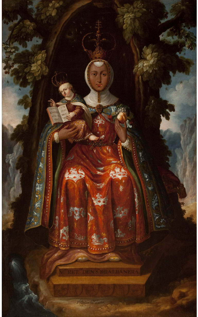
Fig. 2. Verdadero retrato de Nuestra Señora de Valvanera . Pedro LÓPEZ CALDERÓN, 1719. Museo Nacional de las Intervenciones, Ciudad de México.

que se ilustran dos pasajes destacados de su hagiografía: su juicio condenatorio y el posterior martirio. Ambas se encuadran a sendos lados de las figuras triunfales que centran y protagonizan la composición, animando un paisaje que representa a la ciudad de Málaga y el entorno periurbano del río Guadalmedina.