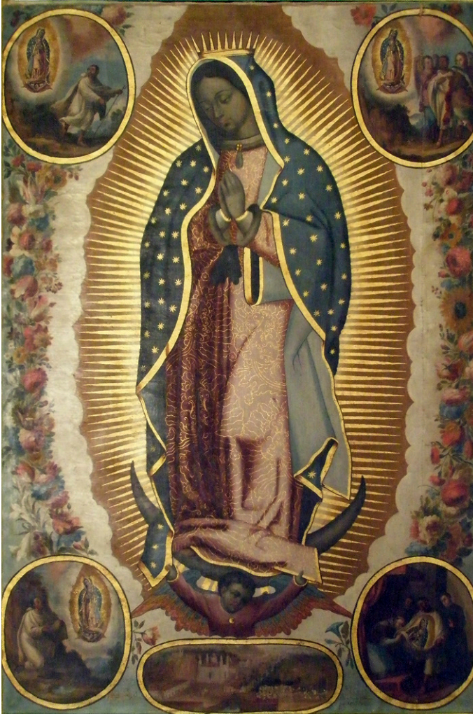
Fig. 5. Virgen de Guadalupe . Pedro LÓPEZ CALDERÓN, 1726. Monasterio de Santa María la Real (Madres Dominicas), Bormujos (Sevilla).

investigación, el capítulo que el mismo investigador dedica a la interpretar la destacada llegada de representaciones guadalupanas desde la Nueva España hasta la capital y provincia hispalenses en los años del virreinato 22 . Atendiendo al carácter geoestratégico de la ciudad que durante siglos asumió el monopolio del comercio hispanoamericano, se señala, en primer lugar, el carácter de “amuleto protector” que jugó esta efigie mariana (entre otras) para muchos navegantes, a través del cual justifica su frecuente y temprano arribo hasta del puerto del Guadalquivir. Por su parte, la feligresía hispalense adoptó una particular devoción hacia esta “Inmaculada americana” a la que se atribuían po-