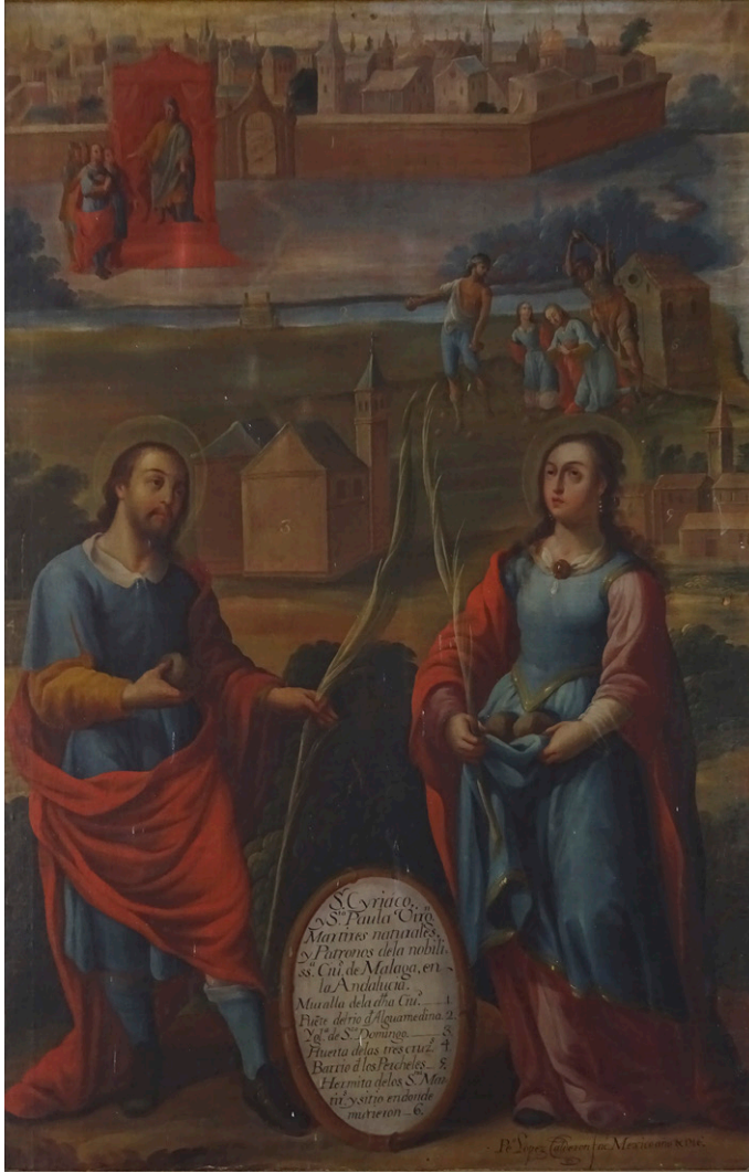
Fig. 1. San Ciriaco y santa Paula, patronos de Málaga . Pedro LÓPEZ CALDERÓN, 1716. Templo de Guadalupe, San Cristóbal de las Casas (Chiapas).

dades de su ubicación, sino por las propias devociones representadas en sus pinturas. Hablamos particularmente de algunos lienzos en los que se representan devociones específicamente locales y originarias de la España peninsular.