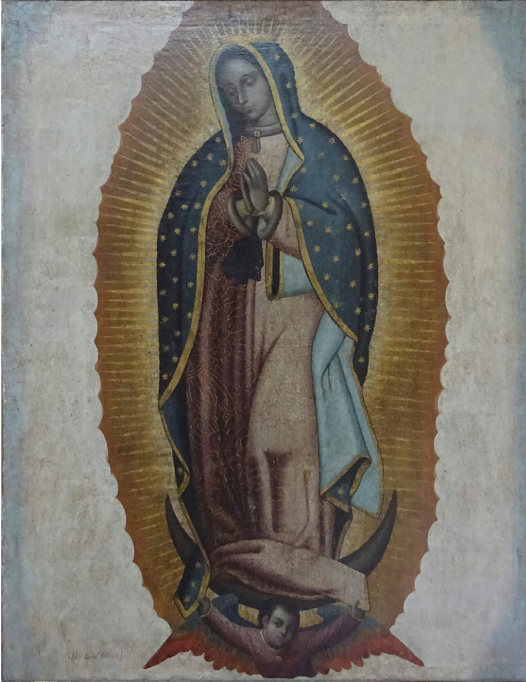
Fig. 9. Virgen de Guadalupe . Pedro LÓPEZ CALDERÓN. Primer tercio del siglo XVIII. Cripta del templo de Santa Mónica en la Colonia del Valle, Ciudad de México.

para su exportación directa a Sevilla, como se había llegado a pensar previamente, cuando no se le conocían otras fuera de este contexto. También se ha podido localizar —y damos a conocer en primicia—, un tercer ejemplar inédito, ubicado en la cripta del templo de Santa Mónica en la Colonia del Valle de la Ciudad de México. Este, de factura más sencilla pero no ausente de interés, nos demuestra que, aunque Pedro López Calderón debió pintar la mayoría de sus réplicas guadalupanas para la exportación, hubo casos excepcionales que, ajenos al fenómeno del tornaviaje, satisficieron la demanda local mexicana y no llegaron a embarcarse hacia la Península.