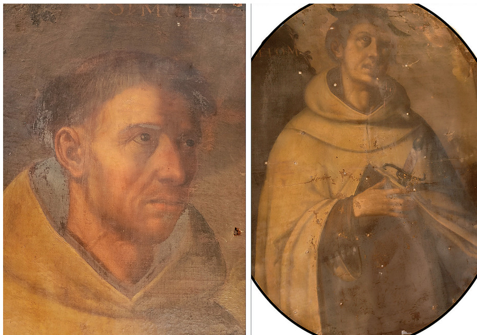
Fig. 4a. Detalle de San Simón Stock y óvalo de San Ángel de Sicilia .