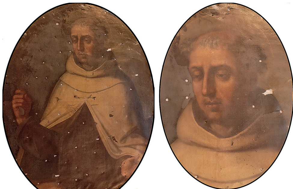
Fig. 5a. Detalle y óvalo de San Alberto de Sicilia .