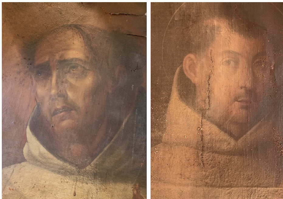
Fig. 4b. Detalles de San Gerardo y San Dionisio papa .