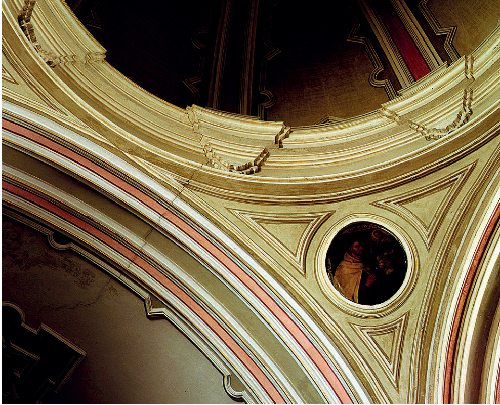
Fig. 3. Perspectiva del óvalo de San Simón Stock en su emplazamiento original antes de 2003.

siglo XX? En el aire queda este interrogante. Antecedentes encaminados a la despersonalización de la iglesia del Carmen por los Misioneros Claretianos no faltan.