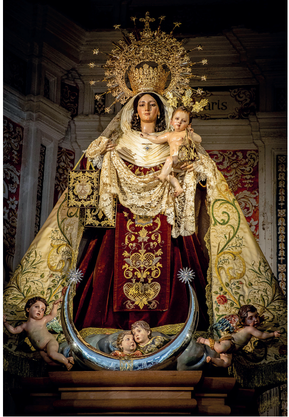
Fig. 1. Actual imagen de la Virgen del Carmen en el camarín del altar mayor de la antigua iglesia conventual de los Carmelitas Descalzos de Málaga.

y coro elevado a los pies sobre un gran atrio según la costumbre de las iglesias conventuales. La capilla mayor cuadrada se abre al fondo en un pequeño camarín destinado a la Virgen del Carmen. Las naves se encuentran separadas por arcos de medio punto apeados sobre pilares cuadrados y con pilastras cajeadas adosadas que sostienen un entablamento con friso. El inmueble se cubre con bóveda de medio cañón con lunetos, arcos fajones y elegantes yeserías que simulan molduras y turgentes golpes de hojarasca inscritos en recuadros centrales mixtilíneos o de forma estrellada. Las naves laterales se cubren con sencillas bóvedas de arista. Al lado de la Epístola se adosa la antigua Capilla Sacramental de planta octogonal, configurada en realidad como un magnífico organismo de doble desarrollo arquitectónico, a cuyo núcleo central reservado a la adoración eucarística se añade un camarín hexagonal para el Nazareno de la Misericordia. La presencia de la imagen de Jesús Caído en el discurso simbólico de este antiguo templo conventual recuerda el apego de los Carmelitas Descalzos andaluces a este asunto, a raíz de las visiones de San Juan de la Cruz.