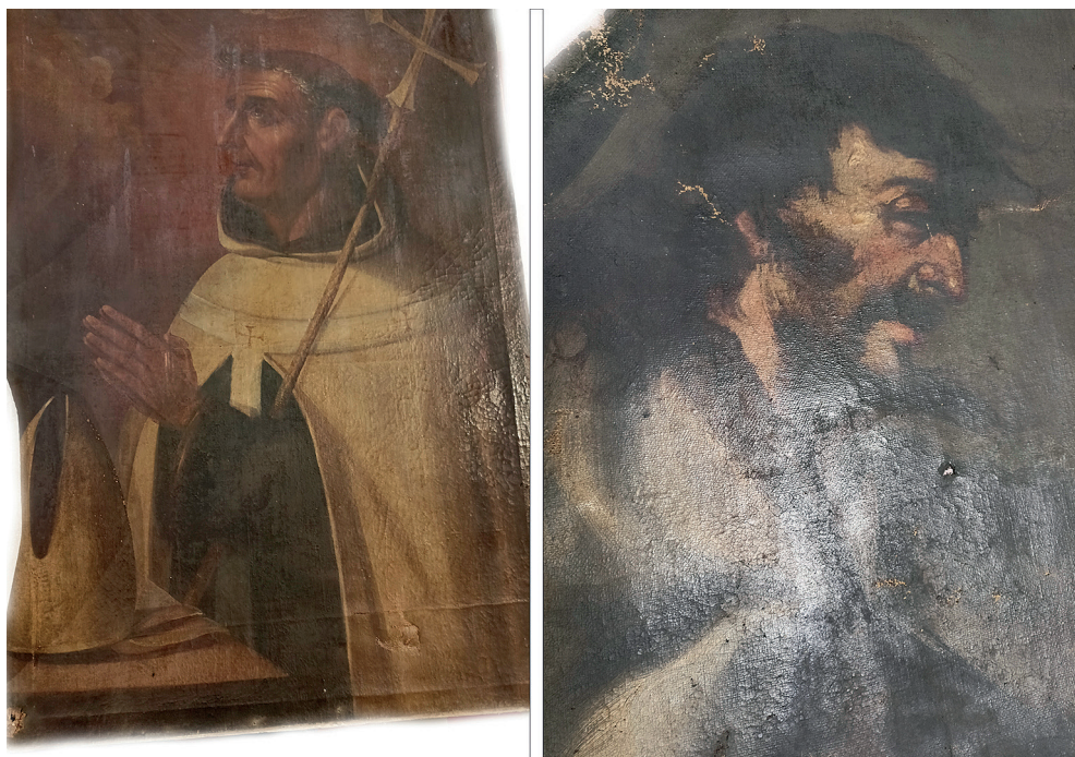
Fig. 5b. Óvalo de San Cirilo de Alejandría y detalle del Profeta Miqueas .