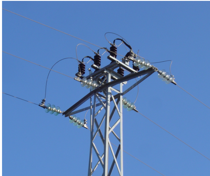
Apoyo en montaje "0" con seccionador unipolar por encima.