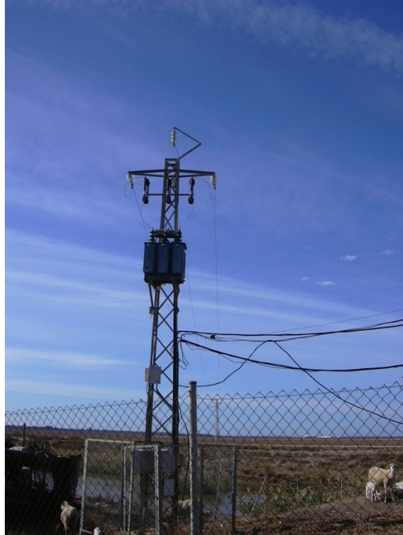
Apoyo con seccionador tripolar en vástago con farolillo.