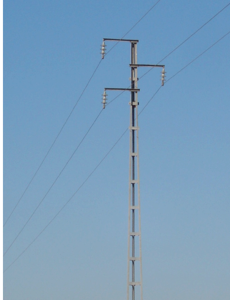
Apoyo de tipo tresbolillos suspendidos con tres platos