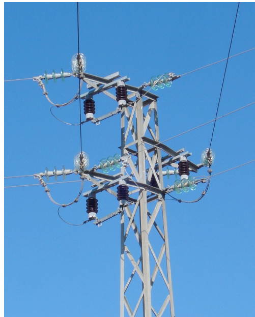
Apoyo de tipo tresbolillos con aisladores de amarre, seccionadores unipolares por debajo, puentes y una derivación.