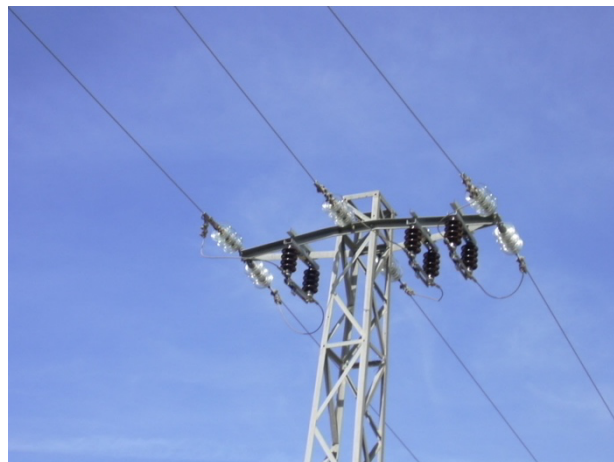
Apoyo en montaje "0" con seccionadores unipolares por debajo