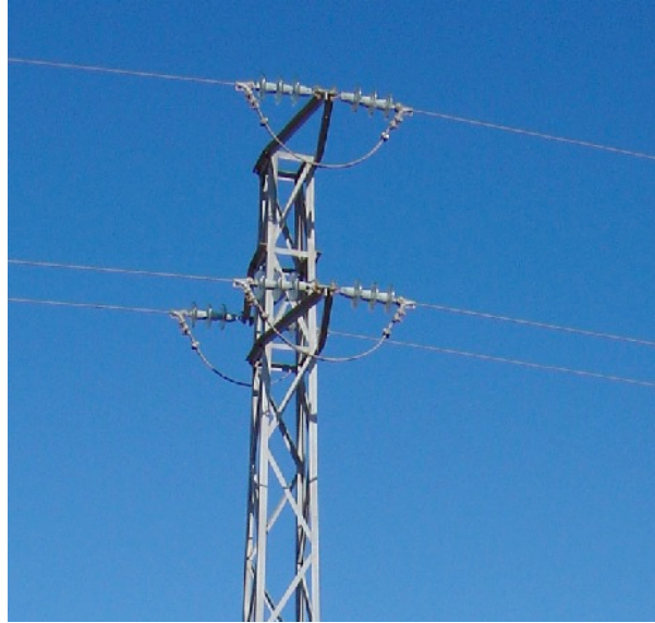
Apoyo de tipo tresbolillos con aisladores de amarre con puentes por debajo.