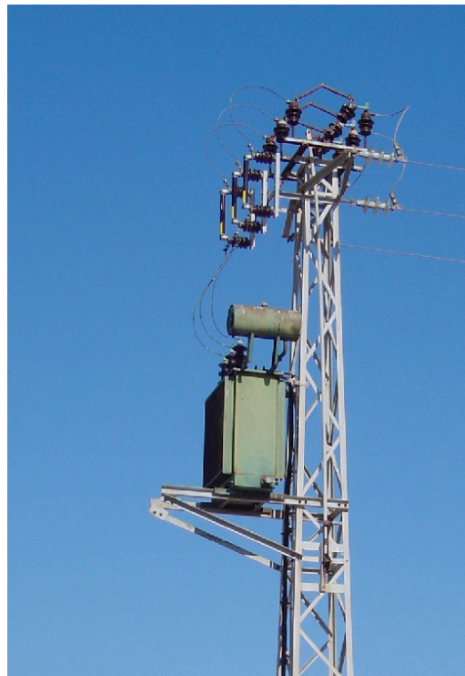
Apoyo con seccionador tripolar en cabecera