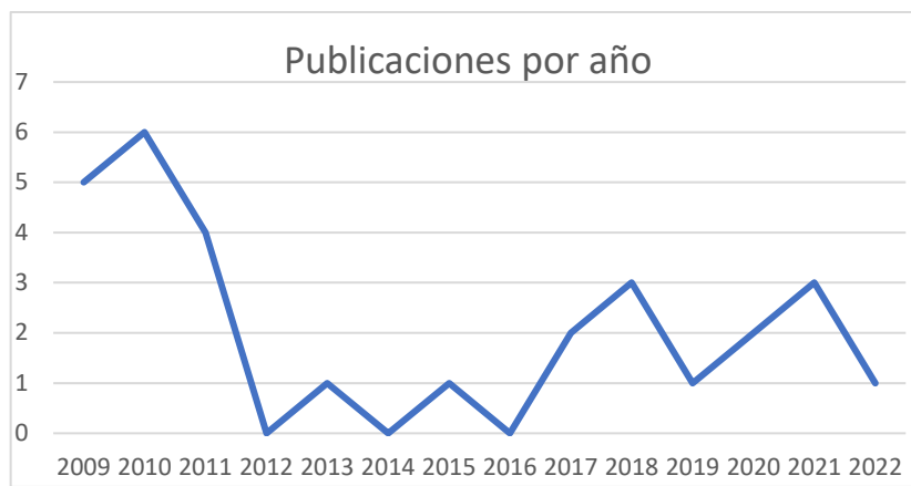
Gráfico 1. Publicaciones de la colección Literatura Letras Africanas por año

Vemos, pues, que el año en que más obras se publicaron (seis) fue 2010, mientras que, en los años 2012, 2014 y 2016 no se publicó ninguna obra en esta colección.