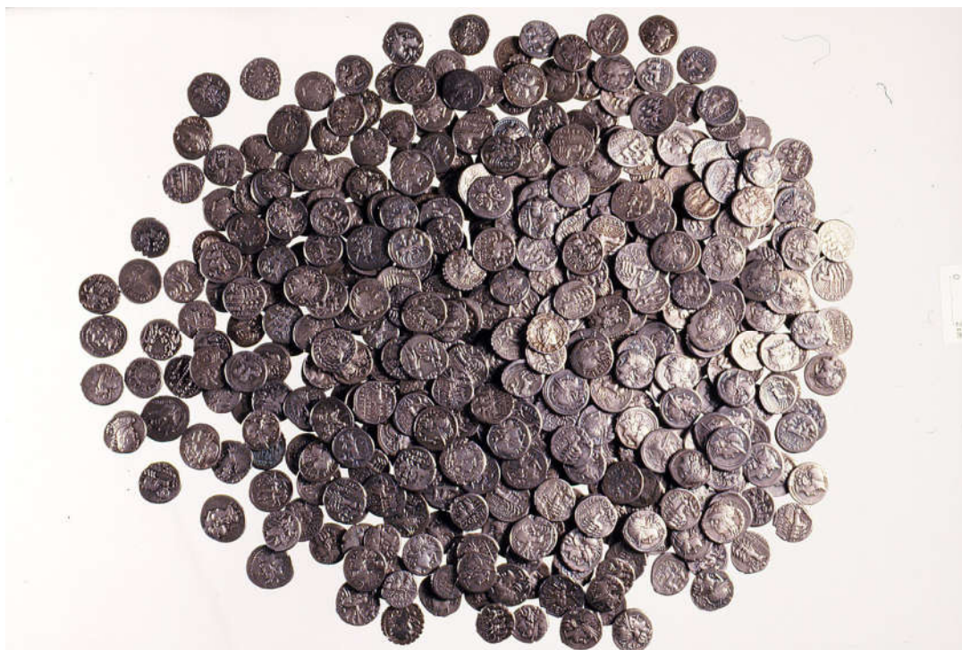
Fig. 2. Conjunto de denarios romano-republicanos del tesoro de Torre de Juan Abad (Cuenca). (Museo Arqueológico Nacional).

Así, aunque algunos lo hicieron a principios del II a.C. como demuestran los denarios con leyenda Iltirtasalirban , no fue hasta mediados de esta centuria y el primer tercio del siglo I a.C. cuando se incorporó el mayor número de talleres (GOZALBES y TORREGROSA, 2014), casi todos localizados en el interior, fundamentalmente en el curso alto y medio del río Ebro y en la Celtiberia, pero también en el interior y la costa catalana, y todos ubicados en la provincia Citerior , pues en la Ulterior no se emitió numerario de plata. La presencia de determinadas emisiones de plata en diversos tesoros y los hallazgos en los campamentos romanos de Numancia ha permitido constatar que sus producciones no fueron simultáneas, al tiempo que su volumen de emisión fue muy desigual, posiblemente con el objetivo de cubrir necesidades diversas.