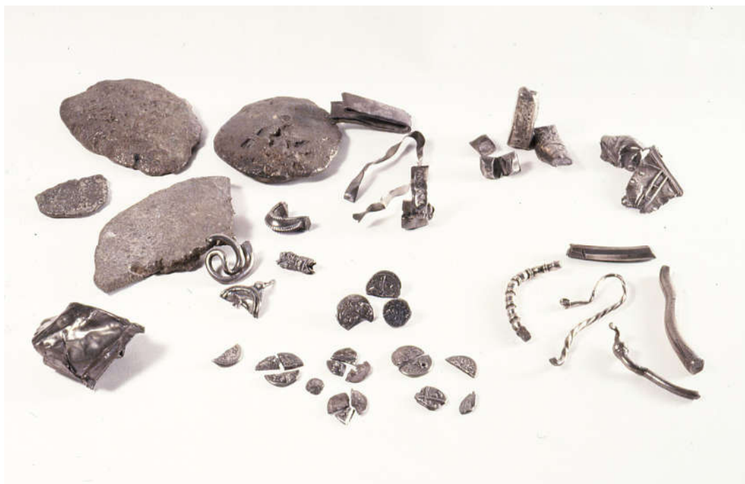
Fig. 1. Tortas, pequeños lingotes, restos de joyas y monedas procedentes del tesoro de Driebes (Guadalajara) (Museo Arqueológico Nacional).

Es evidente que la contienda bélica motivó la acuñación de importantes cantidades de moneda, al tiempo que estuvo en circulación un numerario muy diverso en metales, sistemas ponderales, denominaciones, iconografías y leyendas epigráficas.