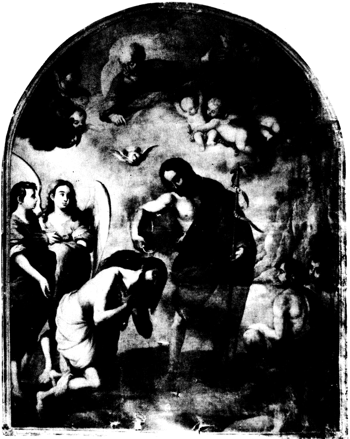
Lámina X.- El bautismo de Jesús