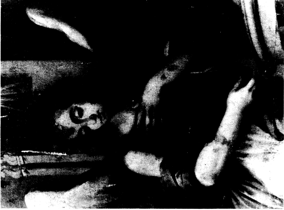
Lámina V.- Detalle del ángel Gabriel