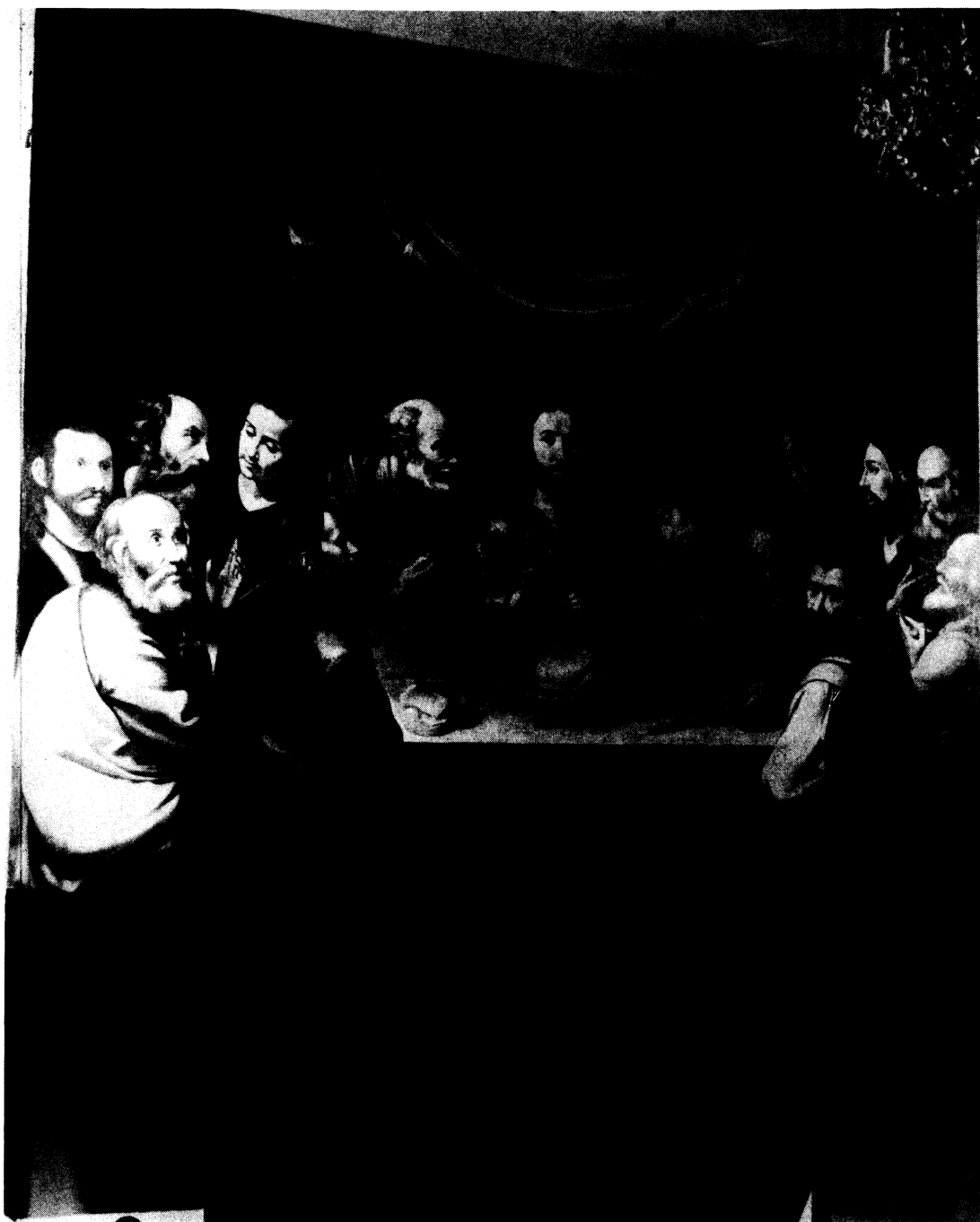
Lámina I.-La última Cena