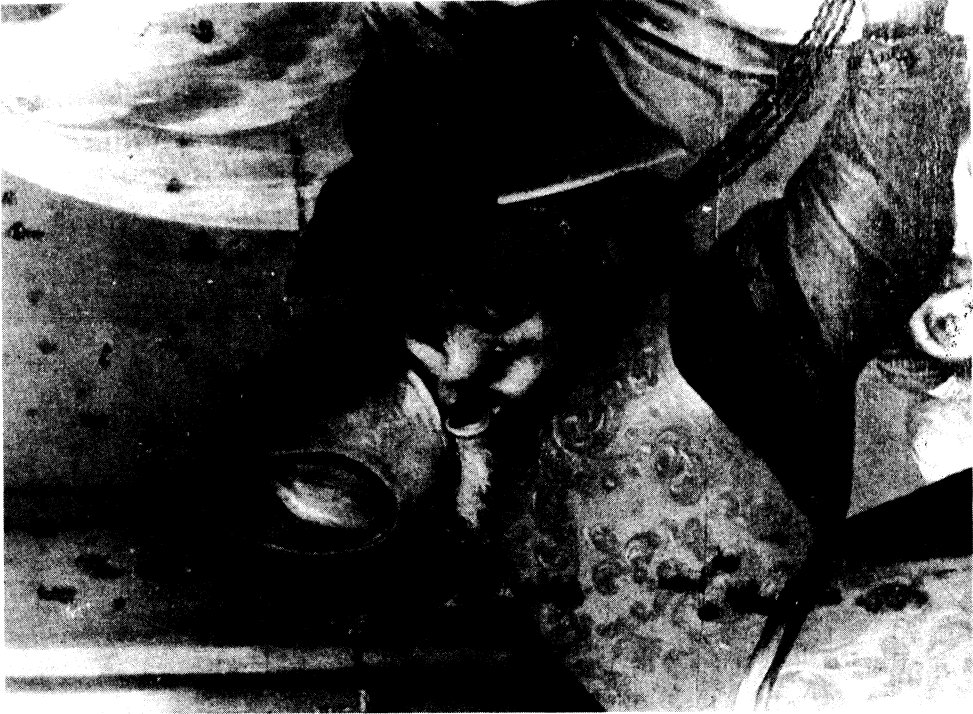
Lámina IV.- Detalle de San Zacarías