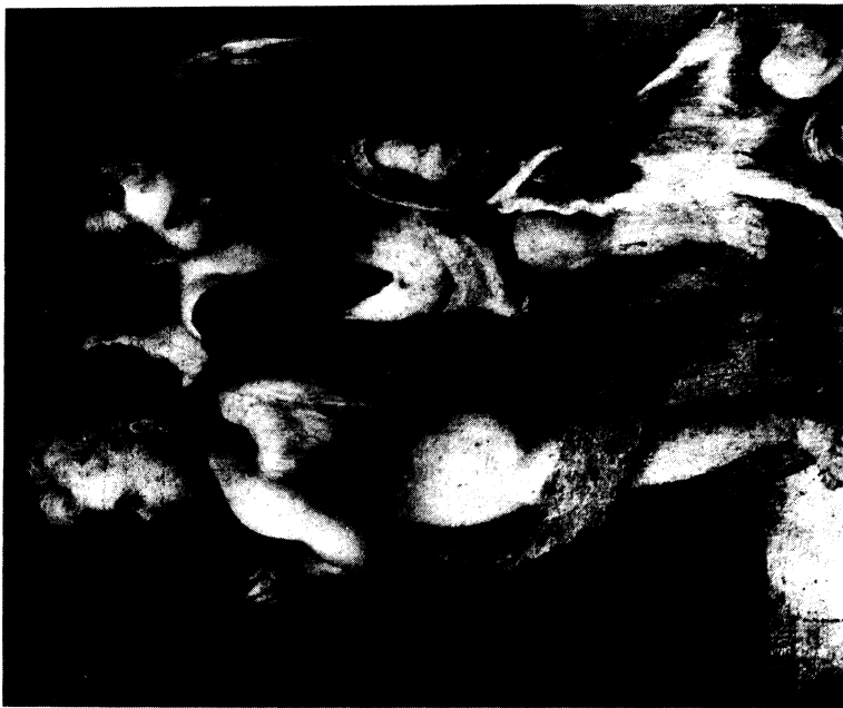
Lámina VIII.- Detalle del grupo de los dos angelillos junto al perro