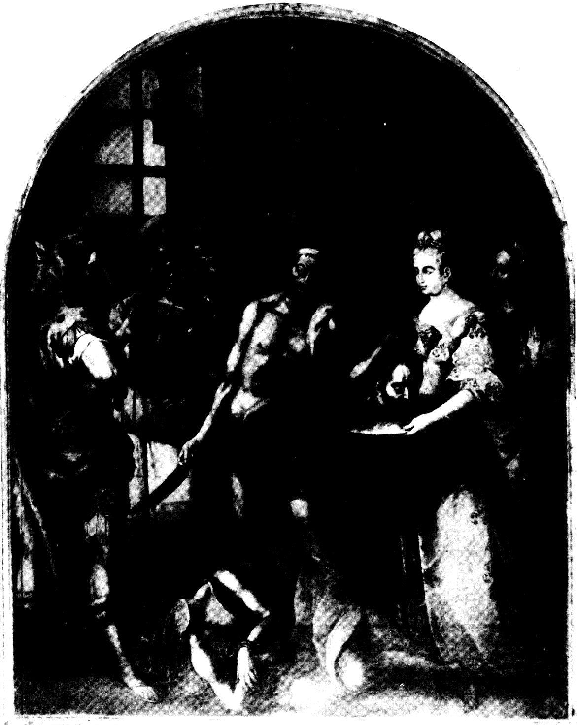
Lámina XIII.- La degollación de San Juan Bautista