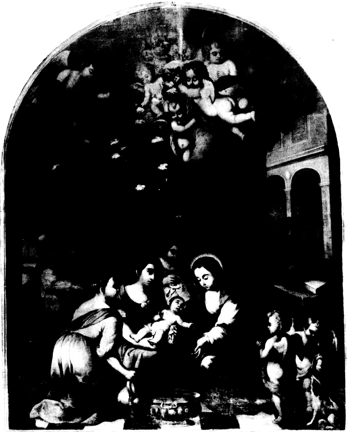
Lámina VI.— El nacimiento de San Juan Bautista