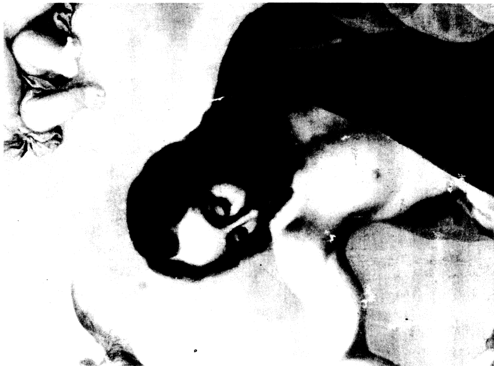
Lámina XI.- Detalle de San Juan Bautista