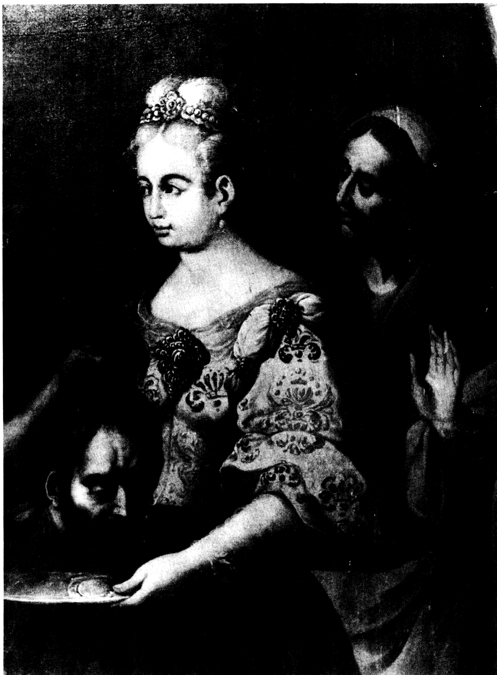
Lámina XIV.- Detalle de Salomé con la cabeza de San Juan Bautista y su madre Herodías