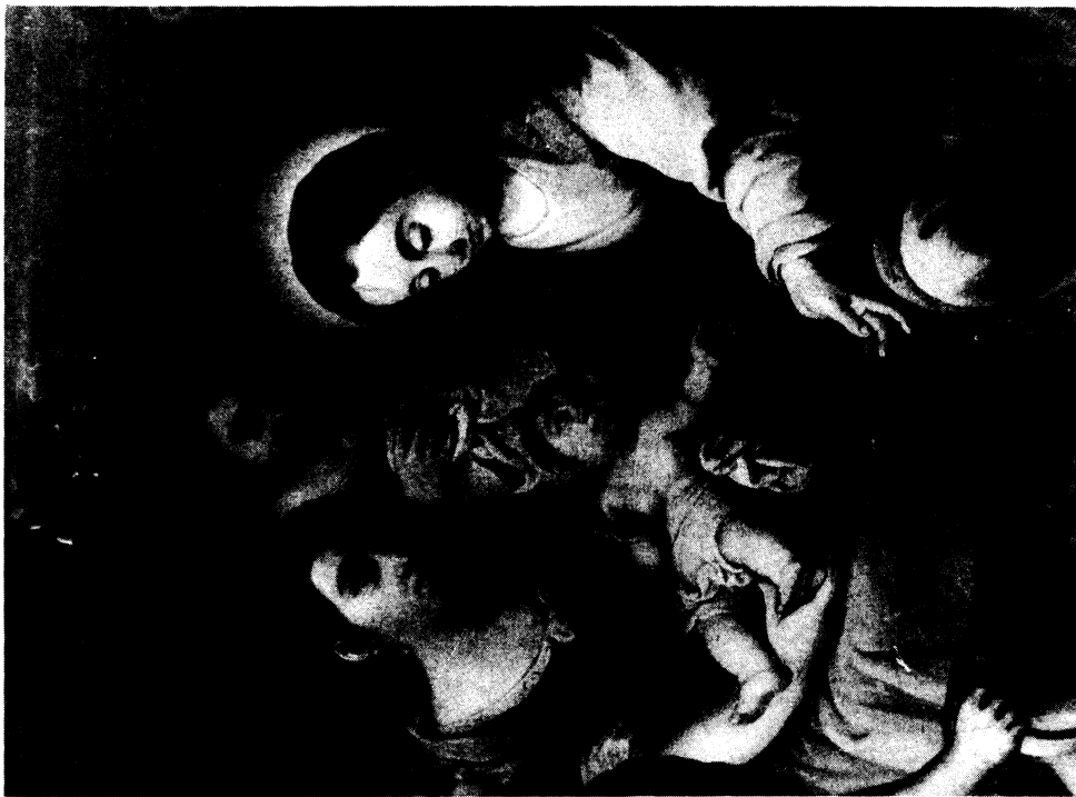
Lámina VII.- Detalle del grupo central