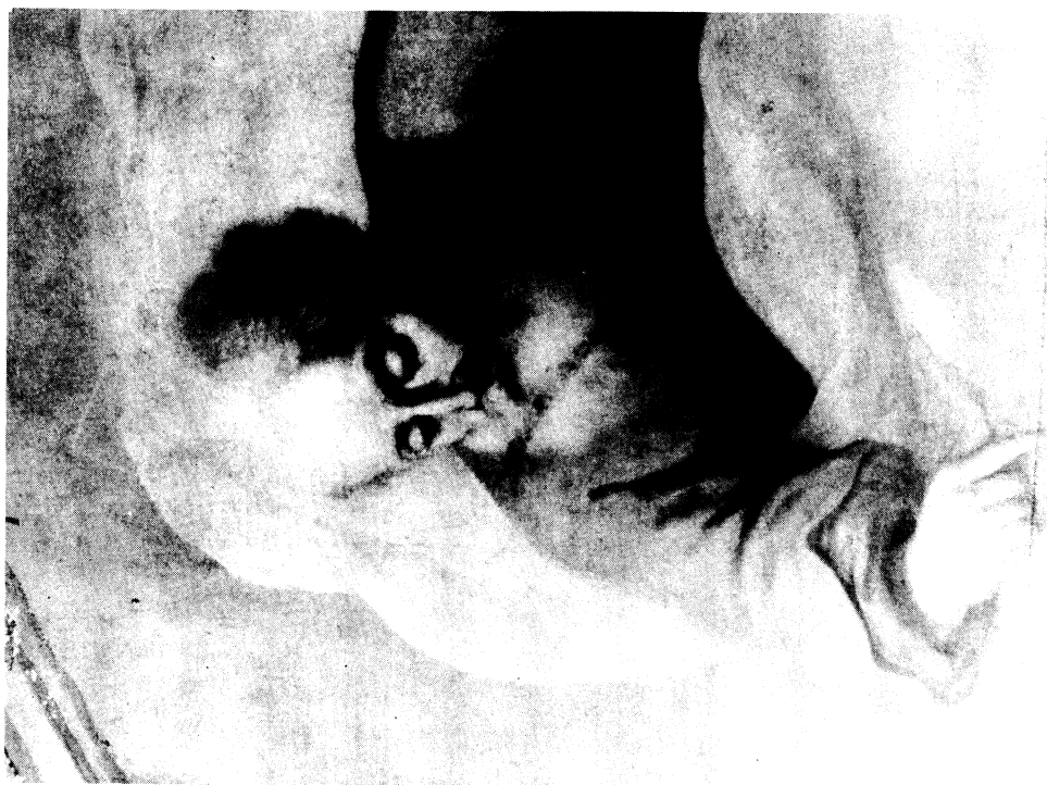
Lámina XII.- Detalle del Padre Eterno