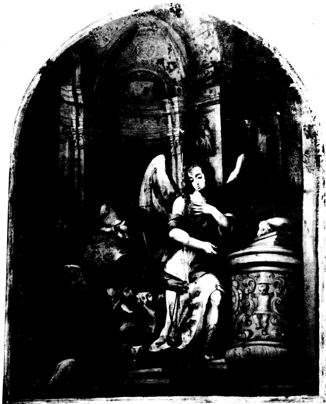
Lámina III.—El anuncio a San Zacarías