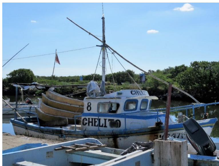
FIGURA 4. Embarcación de mediana altura y conjunto de alijos en el puerto de Dzilam de Bravo.