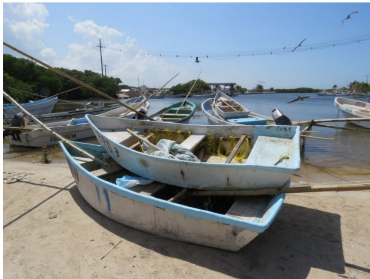
FIGURA 3. Alijos en un primer plano y embarcaciones menores en el puerto de Sisal

Ambos tipos de flota transportan pequeños alijos (embarcaciones sin motor) desde donde se realiza la pesca mediante el uso de jimbas (varas de bambú de las que penden cordeles con carnada).