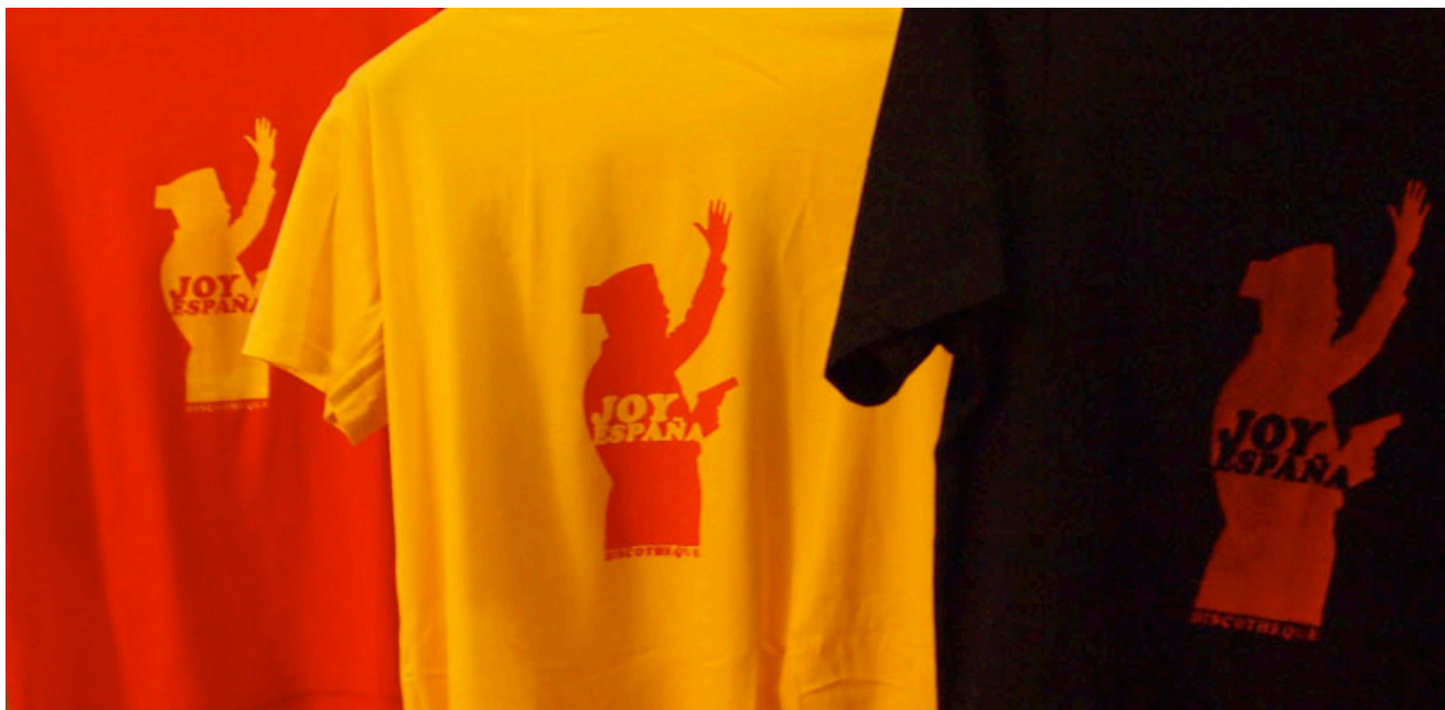
Ilustración 2. Eso era antes, esto es ahora (2014), pieza de LA CRISIS SEGÚN. Camisetas serigrafiadas, dimensiones variables.

8. La videoproyección evita la obra objetual por la naturaleza de los temas tratados, que habitan el territorio mental difuso de la memoria y los mitos, y ha sido inspirada por artistas como Francesc Torres, Eulàlia Valldosera (para quien es fundamental la desmaterialización de la obra), Soledad Sevilla (la proyección como memoria), Kumi Yamashita (la sombra proyectada como “material” de trabajo), James Turrell (sus “objetos de luz” y trampas con la percepción) o Tony Oursler (la proyección como elemento grotesco y también de memoria). Para la proyección se ha generado un espacio de representación previo: dos “sombras” pintadas en la pared que generan un tercer nivel de significado visual al interactuar con las imágenes proyectadas. La elección de una esquina para proyectar vino sugerida por los trampantojos de luz de James Turrell; de este modo se genera una ilusión de tridimensionalidad en las imágenes bidimensionales proyectadas. Las dos siluetas se pintaron a partir de la sombra proyectada por dos modelos, con un tono que generase el trompe l'oeil de ser “sombras auténticas”, proyectadas por “personas invisibles”. Esto coloca en el mismo plano las imágenes proyectadas con las siluetas pintadas, metáfora del individuo enfrentado a la historia y la memoria. De este modo, las siluetas devienen “universales”, representaciones vicarias del espectador pero también de todas las personas sepultadas bajo el peso de la historia que se pretende rememorar en la obra.