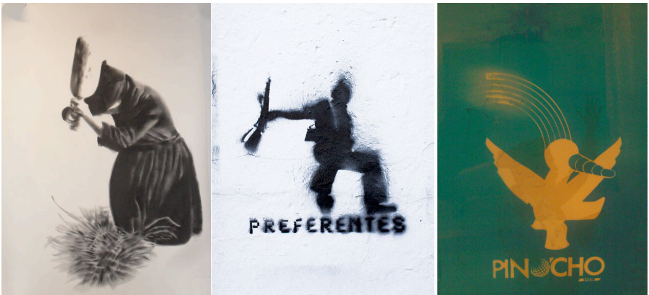
Ilustración 3. Otras piezas de LA CRISIS SEGÚN. Dibujo con pigmento sobre papel (200 x 150 cm.); grafiti urbano; serigrafía.

4. Las imágenes se han sometido a un tratamiento de reducción que elimina detalles y las transforma en siluetas para llevarlas al territorio del signo icónico. Esto las convierte en imágenes cargadas que se mueven más bien en el plano arquetípico y universal , propio del mito y la leyenda, que en el plano particular del hecho concreto (el icono como “mitología visual” creada a partir de un referente fotográfico), si bien conservando los detalles suficientes del referente real. La “reducción” de la imagen de origen fotográfico a signo también permite “igualarla” con la imagen ejecutada como grafiti y con los textos tipográficos que se utilizan igualmente en el proyecto. La videoproyección, por último, es un recurso de desmaterialización fundamental en una obra como esta, que aborda temas como la historia, el mito y la memoria. Que la proyección se realice además sobre una esquina de la sala contribuye al trampantojo físico y metafórico, aportando un elemento ilusionista de tridimensionalidad a imágenes bidimensionales. Algo parecido sucede con las “sombras” pintadas en la pared, que generan interferencias visuales con las imágenes proyectadas aumentando la carga alegórica: el individuo (del pasado, del futuro y, vicariamente, el espectador del presente) enfrentado a la historia y los mitos que conforman su cultura, su sociedad y, por supuesto, su entera existencia.