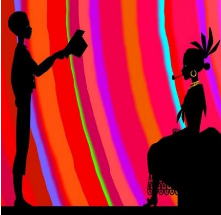
Figura 1: ©TI Jean et la Belle-sans-Connaître. Les contes de la nuit .