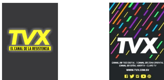
Figura 11: Logotipo de Canal 23 TVX.