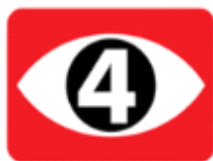
Figura 2: Logotipo Canal 4