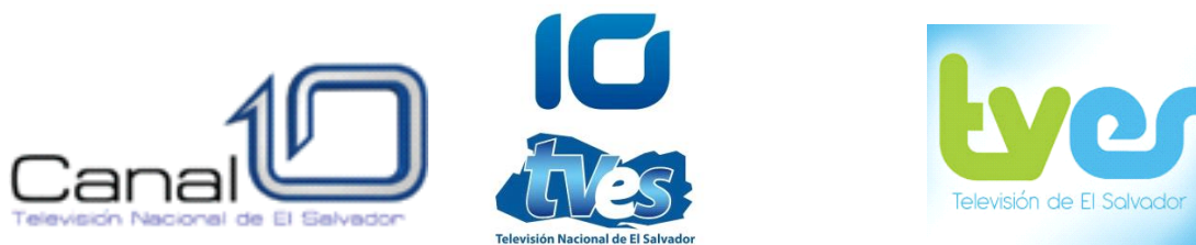
Figura 4: Logotipo Canal 10 de televisión y sus modificaciones a la imagen corporativa en la historia.