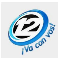
Figura 5: Logotipo Canal 12