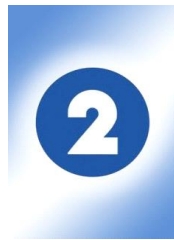
Figura 3: Logotipo Canal 2