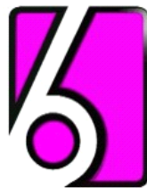
Figura 1: Logotipo Canal 6