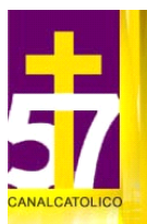
Figura 17: Logotipo de Canal 57 EWTN