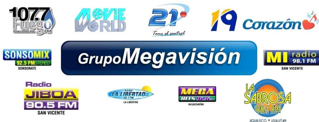
Figura 15. Canales de televisión y emisoras radiales que forman el Grupo Megavisión.

Canal 21 sigue la línea de crear un espacio informativo y así surge Noticiero Megavisión. Dicho canal posee una programación variada. Canal 19 se caracteriza por su programación informativa y noticiosa. Y finalmente, canal 15 Movie World TV, se caracteriza por presentar películas.