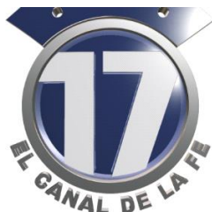
Figura 10: Logotipo de Canal 17