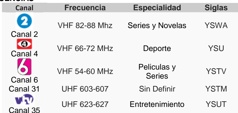
Tabla 2. CANALES QUE CONFORMAN TELECORPORACIÓN SALVADOREÑA Y SUS FRECUENCIAS

Nota: Fuente: https://es.wikipedia.org/wiki/Telecorporaci%C3%B3n_Salvadore%C3%B1a (consultado en 07/2015)