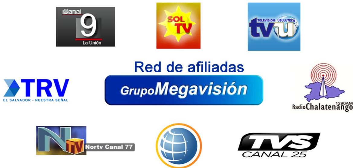
Figura 16. Canales de televisión locales y emisoras radiales que forman la Red de Afiliadas del Grupo Megavisión. Elaboración propia.