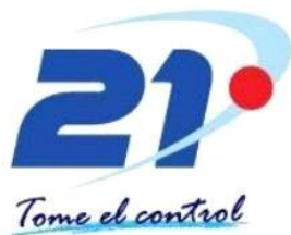
Figura 9: Logotipo de Canal 21