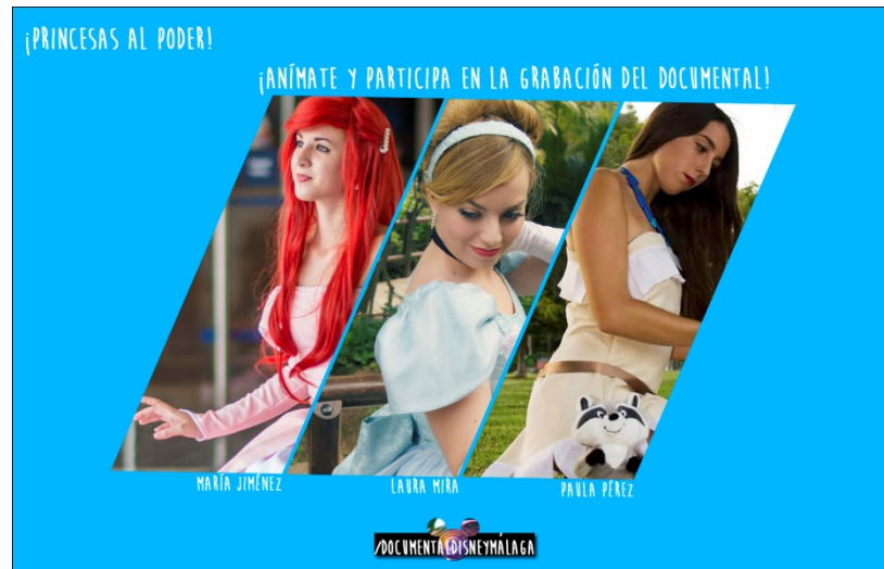
Gráfico Facebook, para animar al público a asistir disfrazado

asistencia, así el participante en cuestión se sentía en compromiso de asistir, y a la vez alagado por anunciar su participación.