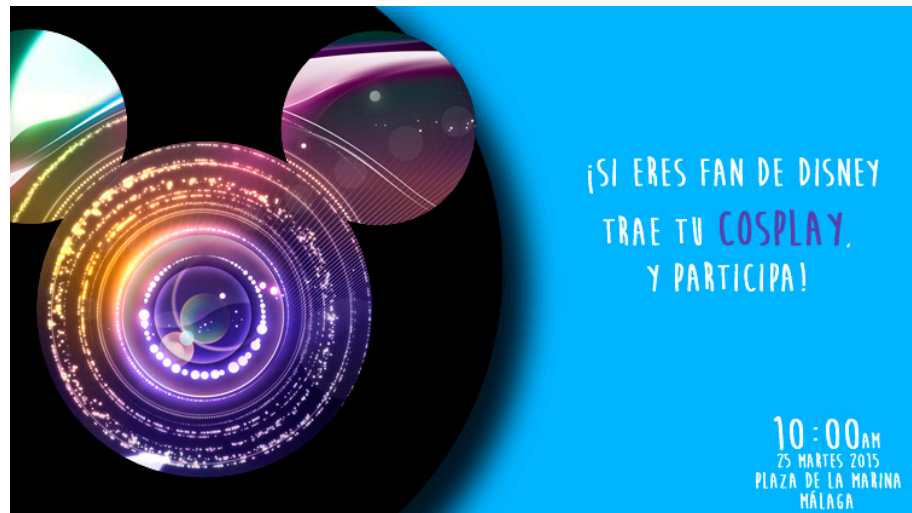
Gráfica promoción Facebook

“Si eres fan de Disney tengas disfraz o no, y te gustaría participar en el documental, ¡serás bienvenido el 25 Martes de agosto en el parque de la Marina Málaga, a las 10:00 am!