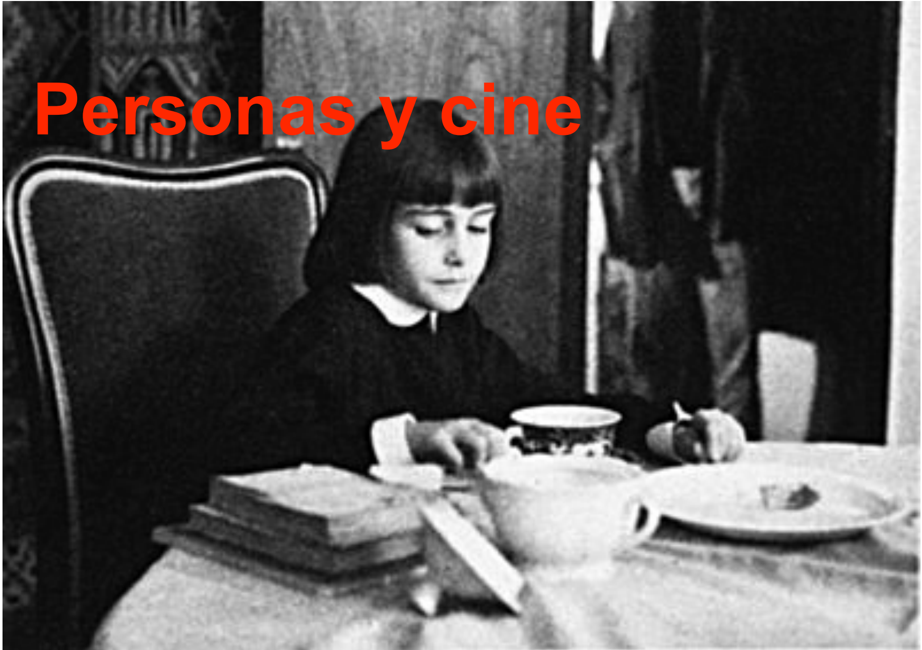
"El espíritu de la colmena" de Víctor Erice, 1973.