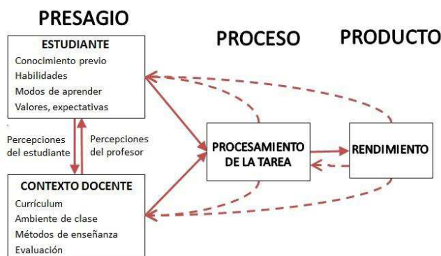
Fig. 2 Modelo 3P de Biggs.

Además, el modelo 3P del proceso de enseñanza/aprendizaje propuesto por Biggs [16] indica que las metodologías docentes, en general, y poco experimentadas, en particular, deben aplicarse con cautela y precaución. Según este modelo, mostrado en la Fig. 2, el presagio del estudiante (características individuales con las que afronta la tarea de aprender) influye tanto en el propio proceso de aprendizaje (donde se sitúan las metodologías docentes) como en su producto (rendimiento del estudiante, en sentido amplio). Pero también, proceso y producto pueden cambiar el presagio; esto es, pueden modificar la forma en la que el alumnado afronta el futuro aprendizaje. Así, una metodología mal diseñada o erróneamente aplicada, amén de no desarrollar las competencias para las que se diseñó, puede predisponer al alumnado en contra de un posible uso posterior.