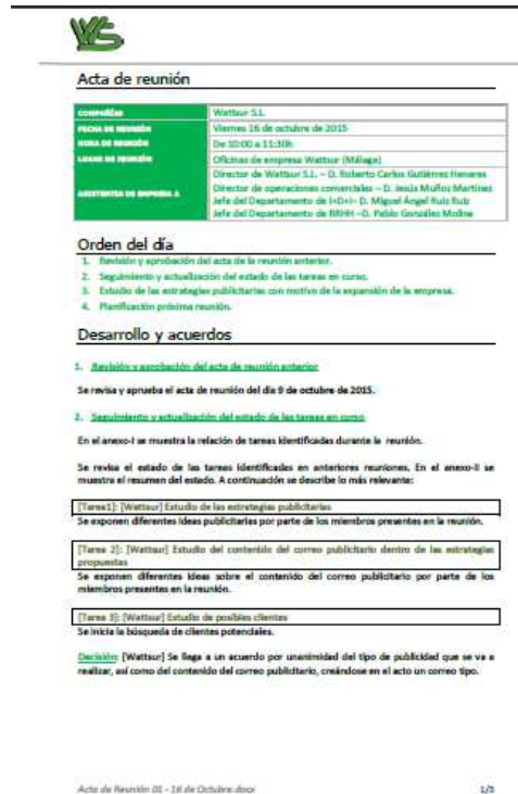
Fig. 5 Ejemplo de acta (empresa “WattSur”).

En lo relacionado con la distribución temporal de las diferentes tareas en las que se divide el trabajo asignado a cada grupo (empresa), son los propios miembros del grupo los que marcan el ritmo de trabajo, sabiendo que cada trabajo consiste en cuatro tareas; que al finalizar la asignatura debe estar resuelto el trabajo completo; y que no recibirán una siguiente tarea hasta que resuelvan la anterior. De esta forma, y al tratarse de alumnos de último curso, se puede dejar recaer el modus operandi y la cadencia del trabajo sobre la propia responsabilidad de cada grupo y sus miembros.