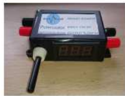
Potenciador Semiconductores S.L.