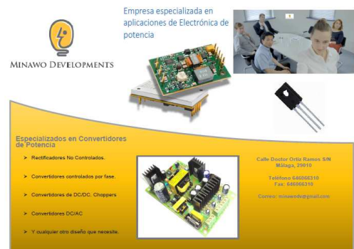
Fig. 4 Folleto informativo (empresa “Minawo Developments”).

Se procura que los trabajos encargados a cada grupo sean lo más reales posibles, contemplando diversas aplicaciones en el ámbito de la Electrónica de Potencia, como la implementación de un KERS (Kinetic Energy Recovery System); desarrollo de un sistema “Smart Power”; control de potencia con TRIAC; diseño de un cargador de baterías; etc.