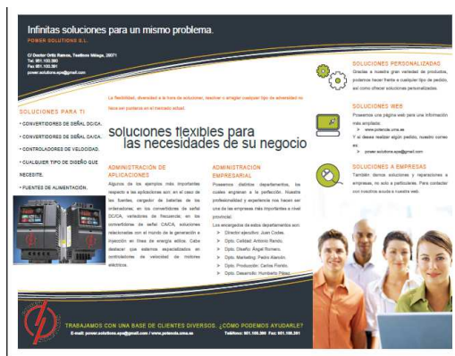
Fig. 3 Folleto informativo (empresa “Power Electronics”).

regular de mensajes entre docente (cliente) y grupos de estudiantes (empresas) en el que se cruzan ofrecimientos, consultas, dudas, solicitudes y propuestas con informes. En paralelo a esta comunicación “empresa-cliente”, se puede mantener otra comunicación profesor-alumnado para solicitar explicaciones acerca de algún trabajo, proporcionar ayuda para resolver alguna cuestión o proponer fechas para posibles reuniones “empresa-cliente”. Se deja libertad absoluta para la asistencia a estas reuniones de los miembros del grupo que consideren oportuno e interesante asistir, según la función que desempeñe cada uno dentro de la “empresa”.