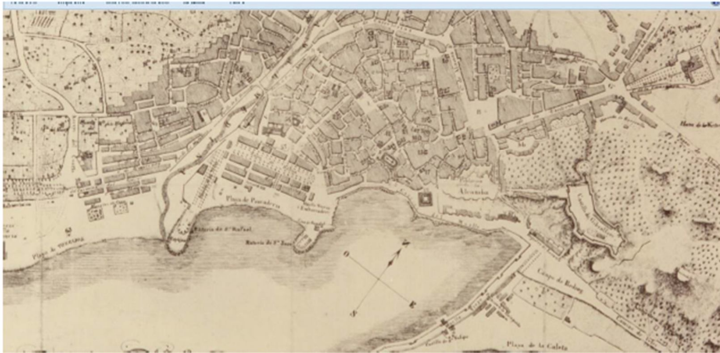
Detalle del Plano de la ciudad de Málaga de Rafael Mitjana (1838)