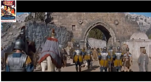
Fig.1 Plano de La túnica sagrada (1954)