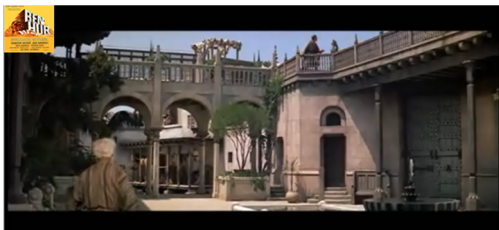
Fig.2. Plano de Ben –Hur (1959)