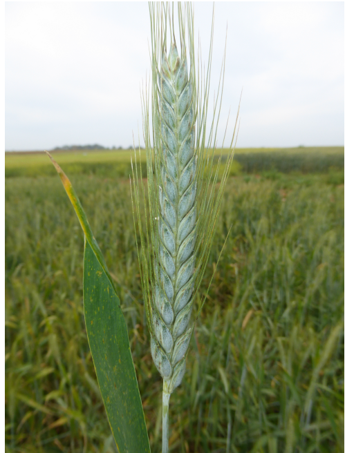
Figura 2. × Tritordeum martinii . España, Córdoba, La Carlota. Detalle de una espiga.

Descripción. Hierba de (45)62-89(96) cm, anual, cespitosa. Tallos herbáceos, erectos, estriados, glabros, sin nudos visibles por encima de las vainas, nudos verdes, glabros. Hojas basales +/- persistentes, marchitas en la antesis, con vaina de márgenes libres, abierta hasta la base, herbácea, estriada longitudinalmente, glabra; lígula hasta 2,3 mm, membranosa, truncada, eroso-dentada, hialina teñida de color castaño en la base; limbo (12)15-30 x (0,3)0,5-0,9 cm, aplanado, surcado, glabro, aurículas hasta de 2,4 mm, falciformes, subglabras con algunos pelos hasta de 0,3 mm. Hojas caulinares medias con vaina glabra, glauca; lígula hasta de 2 mm, membranosa, truncada, eroso-dentada, frecuentemente laciniada, glabra o subglabra con pelos esparcidos de c. 0,1 mm, hialina teñida de color castaño en la base; limbo 17-37 x 1,1-2 cm, glabro o subglabro con algunos pelos hasta de 0,4(1) mm en el margen y/o en la base, verde; aurículas hasta de 2,8 mm,