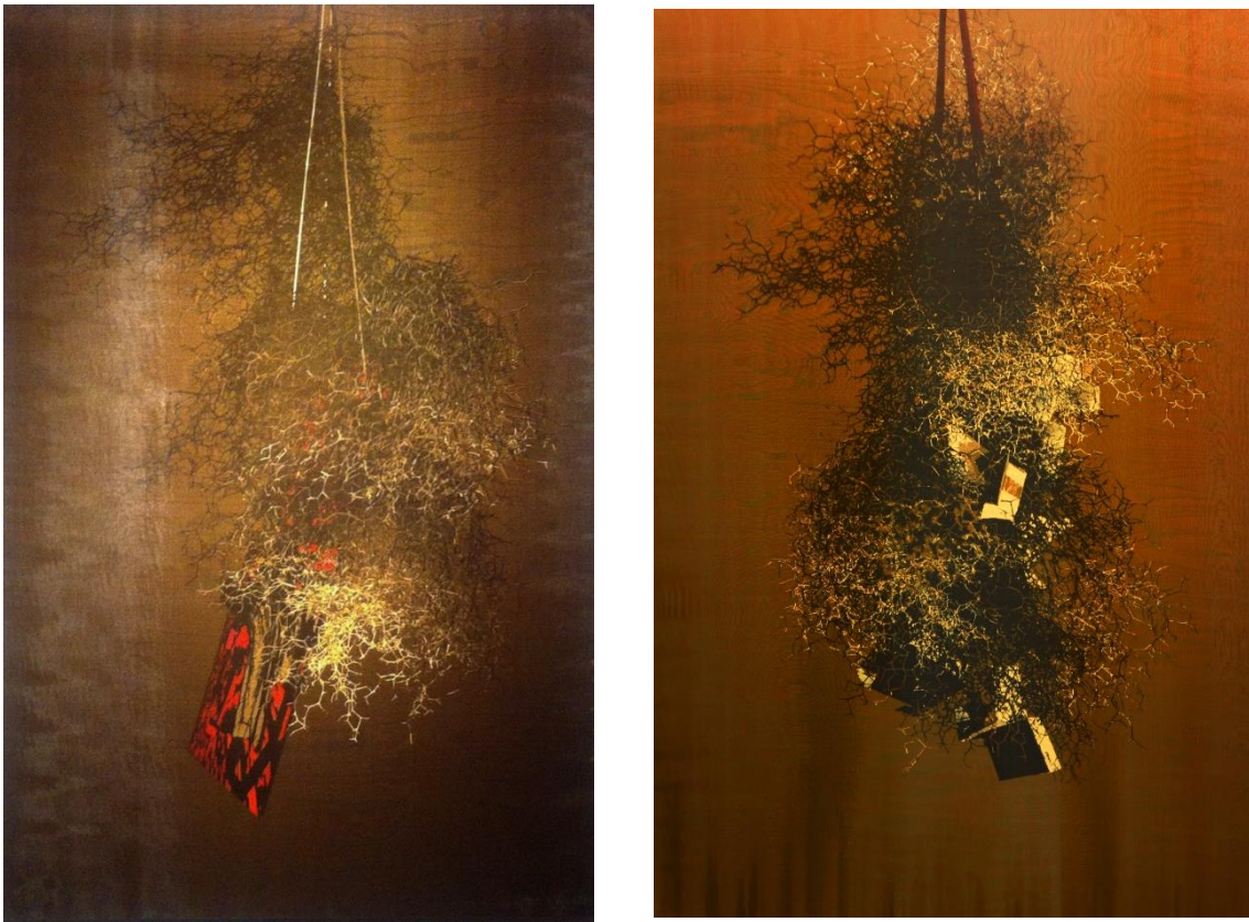
Fig. 5 y 6, A 180° / Hogueras . Técnica mixta sobre seda, 200 x 130 cm., 2016.

las distintas propuestas que aquí se presentan; sólo bajo esas condiciones el sujeto se puede acercar y comprender lo que estas obras proponen (fig. 5 y 6).