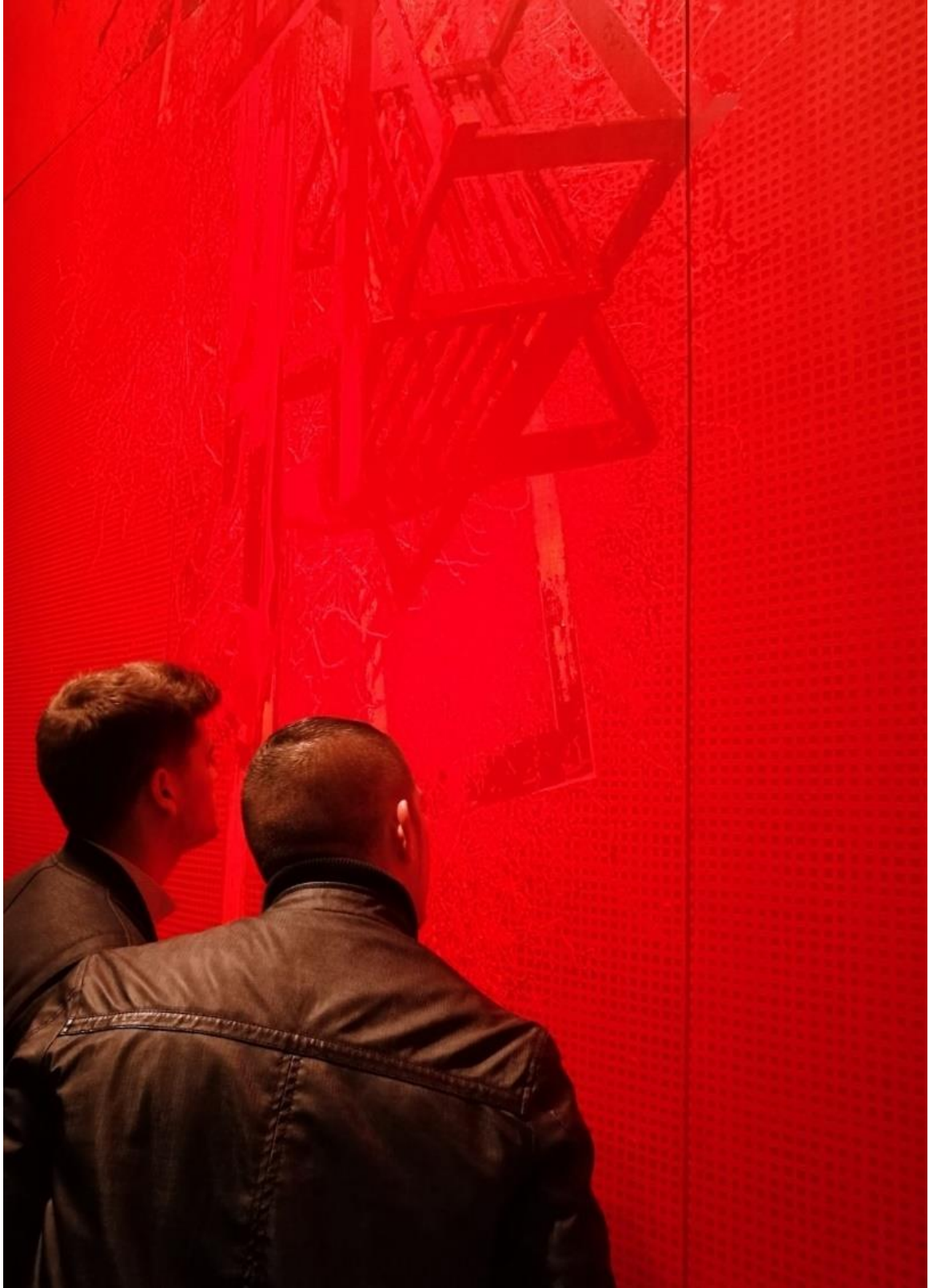
Fig. 4, detalle de la obra A 180° / Hogueras .