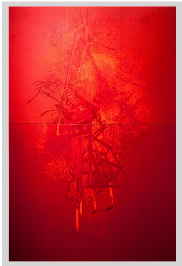
Fig. 3, A 180° / Hogueras . Técnica mixta sobre seda, 500 x 360 cm., 2016.

Del mismo modo, tampoco pueden ser traducidas por el lenguaje y la teoría, no van a ser estas herramientas útiles para su aprehensión. La comprensión intelectual se entiende sesgada e incompleta y va a impedir el acceso a la excepcionalidad inaprensible que las obras poseen. El exceso de argumentos alejaría al sujeto de la experiencia singular que el encuentro con la obra produce. Porque “el logos rompe el silencio de las cosas que carecen de lenguaje y luego fracasa al intentar expresar su ser inagotable en el concepto” (Safransky, 2009, p. 259).