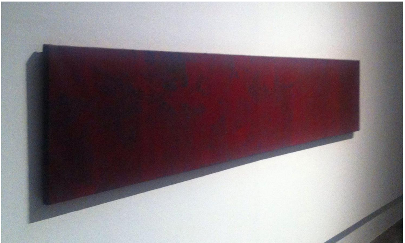
Fig. 7, La menor distancia . Seda erosionada, 300 x 60 cm. 2014

acontecimiento subjetivo, que le lleve a “una lejanía por más cercana que pueda estar” (Benjamin, 2003, p. 47). Una lejanía que, desde la distancia, se muestra para estar presente, para darse a conocer sin importar su distanciamiento, un lugar donde perderse y desorientarse para volver a encontrarse “a sí mismo puesto que nuestra desorientación de la mirada implica al mismo tiempo ser desgarrados del otro y de nosotros mismos, en nosotros mismos” (Didi-Huberman, 2006, p. 161). Sólo ante esa situación de extrañeza y desorientación puede tener lugar la experiencia íntima que interesa al artista: esa posibilidad del ver mediante la cual el sujeto se siente frente a un paradójico desasimiento que lo religa de nuevo al mundo. Una incertidumbre lúcida que es todo lo contrario a la certeza de un tener o de un saber.