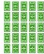
La Rosaleda: 7140 m 2

Recuperación histórica como zona de inundación y cultivo