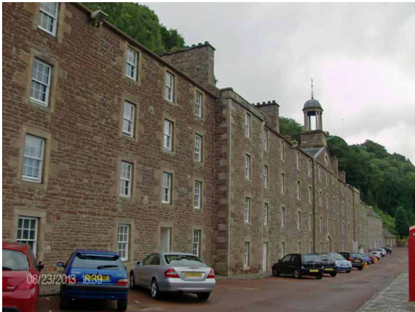
Fig. 4 New Lanark (Escocia)

hilanderías, las viviendas de los obreros de varias plantas de altura construidas en piedra arenisca rojiza, las viviendas de los directores, la escuela y el canal que derivaba el agua del río Clyde hacia las grandes ruedas hidráulicas, dieron la vuelta al mundo en las ilustraciones con las que se decoraban los fardos de algodón que exportaban a diferentes países.