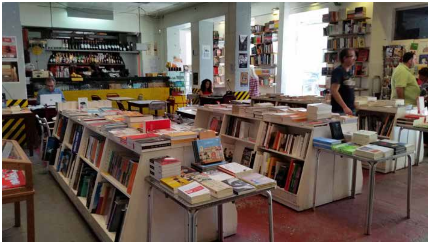
Fig. 11. LX Factory. Interior de uno de los establecimientos

entre libros y viejas máquinas (Zori del Amo, 2015).