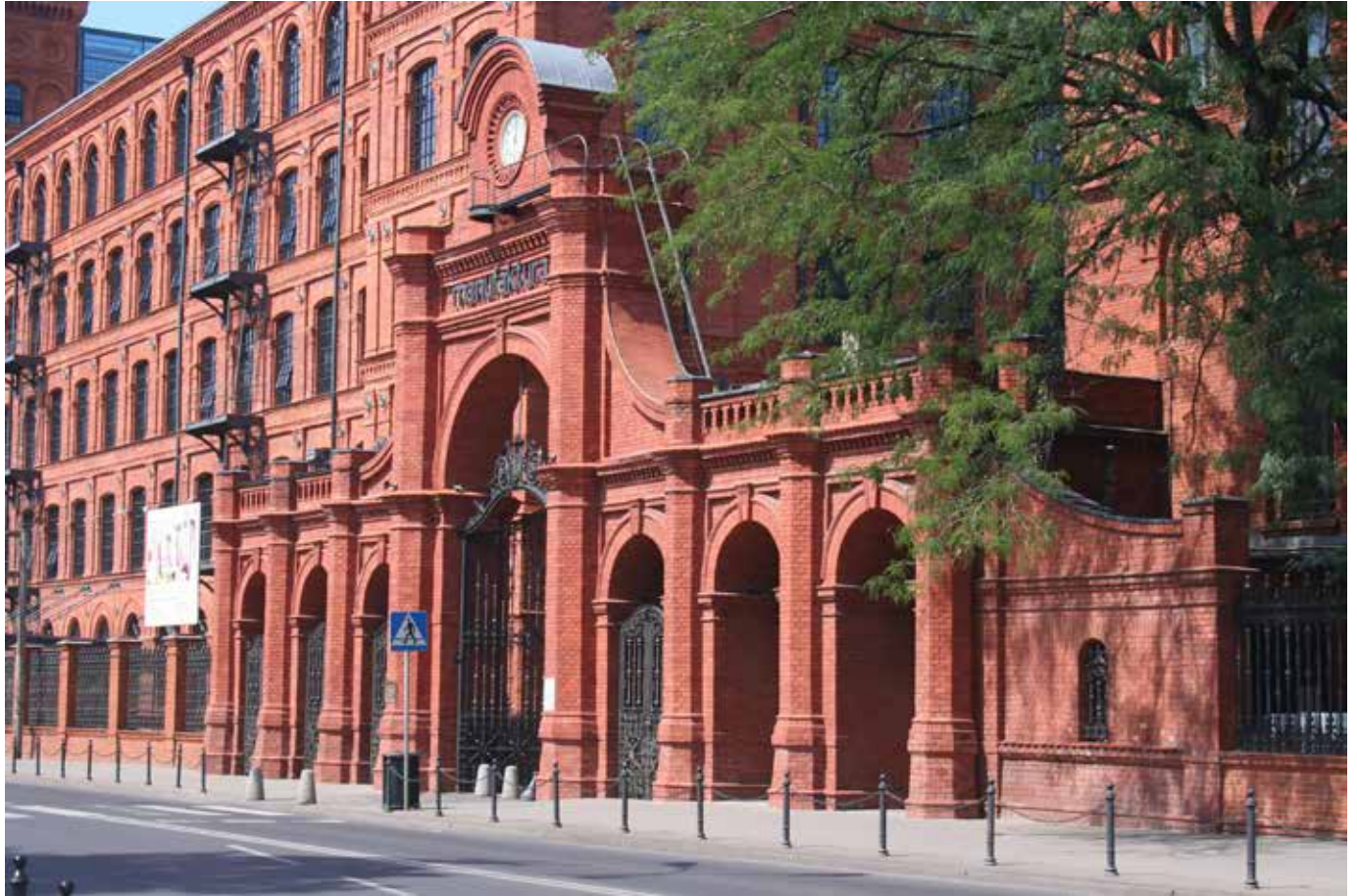
Fig. 5 Manufaktura, portada y hotel