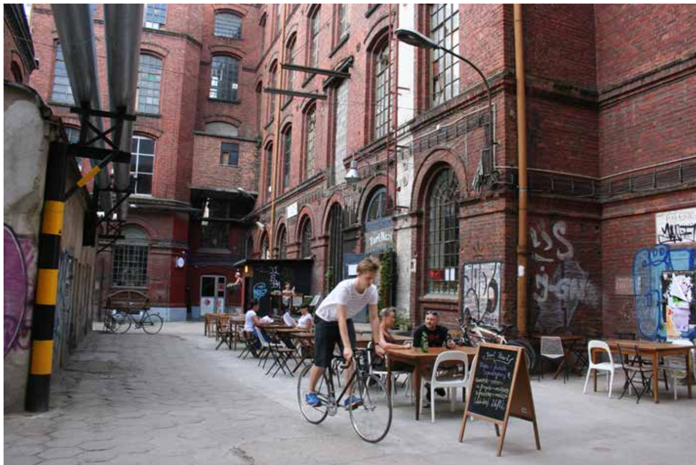
Fig. 8 Off Piotrkowska, Lodz