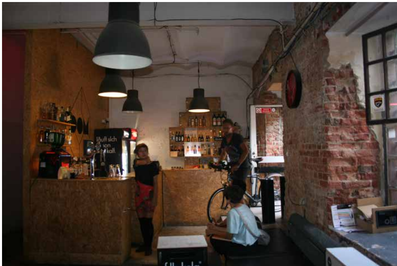
Fig. 9 Off Piotrkowska, Lodz. Interior de establecimiento

de cuatro estrellas, cines, lofts, restaurantes y tiendas; pero para eso ya estaba Manufaktura .