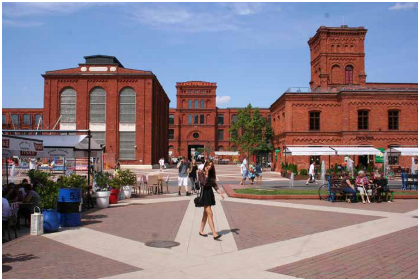
Fig. 6 Manufaktura. Plaza interior (foto autor)

periodo de esplendor la habían dotado de condiciones inmejorables para el turismo. La primera y temprana actuación de recuperación, se centró exclusivamente en el palacio de la familia Poznanski, ubicado dentro del recinto fabril y unido a la nave de hilados mediante un muro en el que se abre el monumental arco triunfal de ladrillo que constituía la entrada a la fábrica. Símbolo orgulloso de la familia promotora, estaba llamado a convertirse en icono de la nueva etapa en la ciudad de Łódź. El palacio, que fue ampliado en varias ocasiones siendo aún residencia de la familia Poznanski, acoge un suntuosísimo interior resuelto con materiales de primera calidad y con diversidad de estilos decorativos, predominando entre ellos el eclecticismo. Desde 1975 este inmueble acoge al Museo de la Ciudad, y la restauración acometida entonces fue meramente conservadora y de adaptación al uso museográfico, ya que en sí mismo constituía un claro exponente del devenir histórico de la ciudad que no convenía alterar.