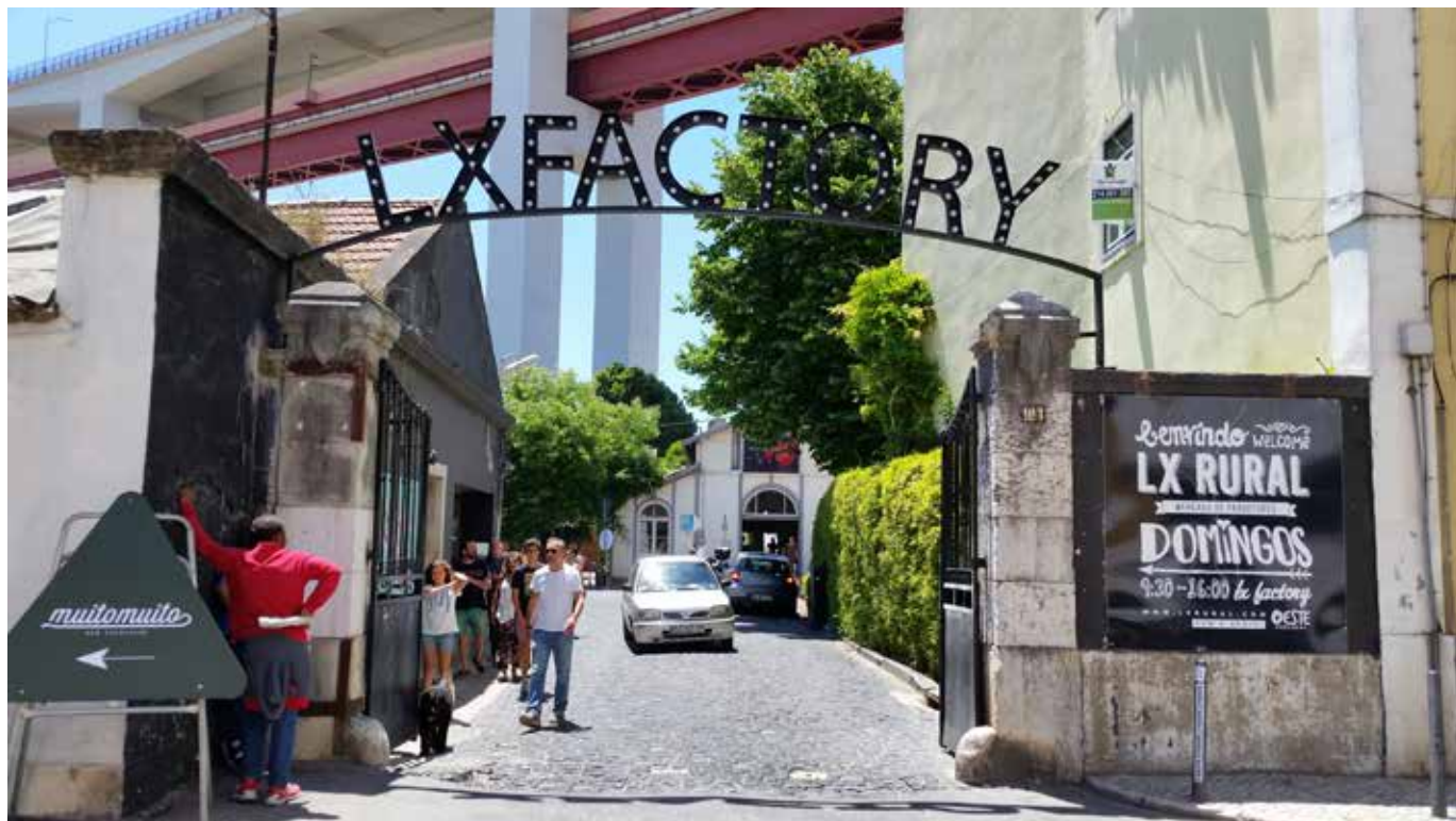
Fig. 10 LX Factory (Lisboa), acceso