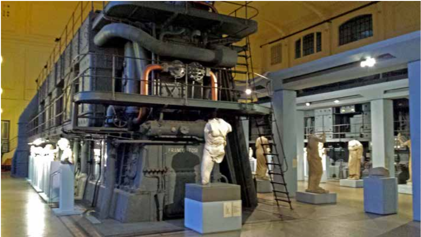
Fig. 2 Montemartini, Roma. Sala de la máquina