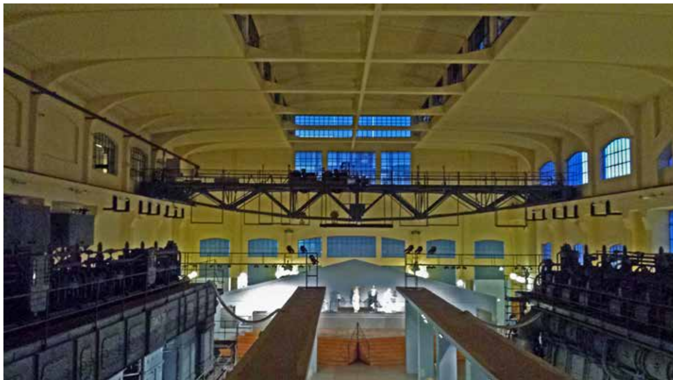
Fig. 3 Montemartini, Roma. Detalle de las cubiertas

elementos tecnológicos del inicial uso industrial. Nadie duda que fue esta creativa fórmula museográfica, no exenta de mensaje reivindicativo y conceptual, la responsable del éxito. Cuando en 2005 concluyó la restauración del museo Capitolino, muchas piezas regresaron a su lugar de origen, pero Montemartini permaneció como subselección manteniendo la fórmula de combinar arqueología industrial y arqueología clásica, avalada por el éxito de crítica y público. Así, en esta ocasión la arquitectura renunció a todo protagonismo en favor del contenido.