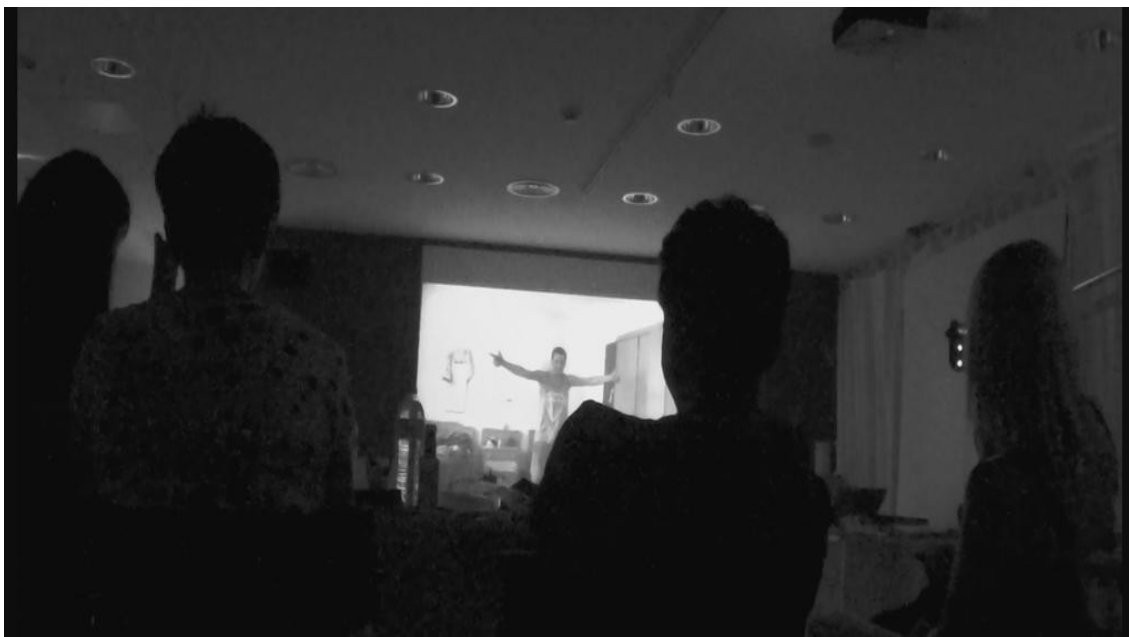
Nota 1: Última sesión del taller, visionado del documental