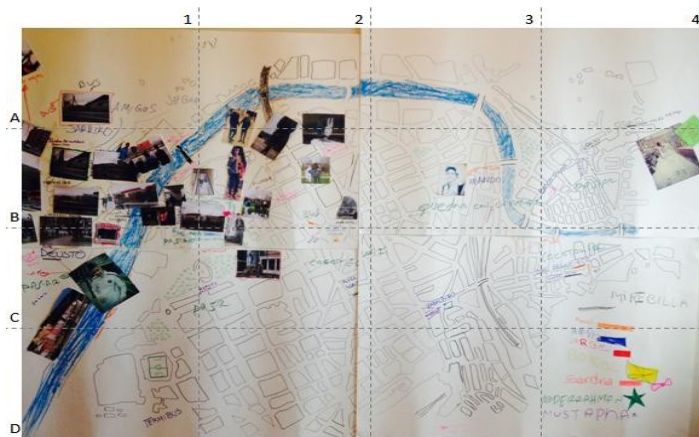
Ilustración 2: Mapa Bilbao

situada, no podemos dejar de analizar dichos productos sin tener en cuenta el proceso de producción y el contexto bajo el que fueron generados (Pink, 2009; 2012). Entonces, tanto el mapa como el documental como productos comunicativos deben ser tratados teniendo en cuenta tanto los productos en sí mismos, como las acciones de los interlocutores situados dentro de