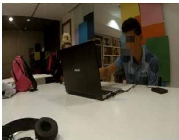
Ilustración 1: Editando el documenta

experimentación no estuvo exento de cierto caos. Los métodos basados en las artes tienen un gran potencial para distanciarnos de la retórica de muchos trabajos cuantitativos (Mendoza y Morgade, en revisión). Al hacerlo, los métodos artísticos nos invitan a los investigadores y participantes a ser parte de un proceso creativo que nos permite vivir el desorden, la incertidumbre y la ambigüedad que deviene la investigación y, por tanto, del mundo (Morgade et al., 2016). Por ello, en este apartado, no podíamos dejar de hablar de dicho desorden e incertidumbre.