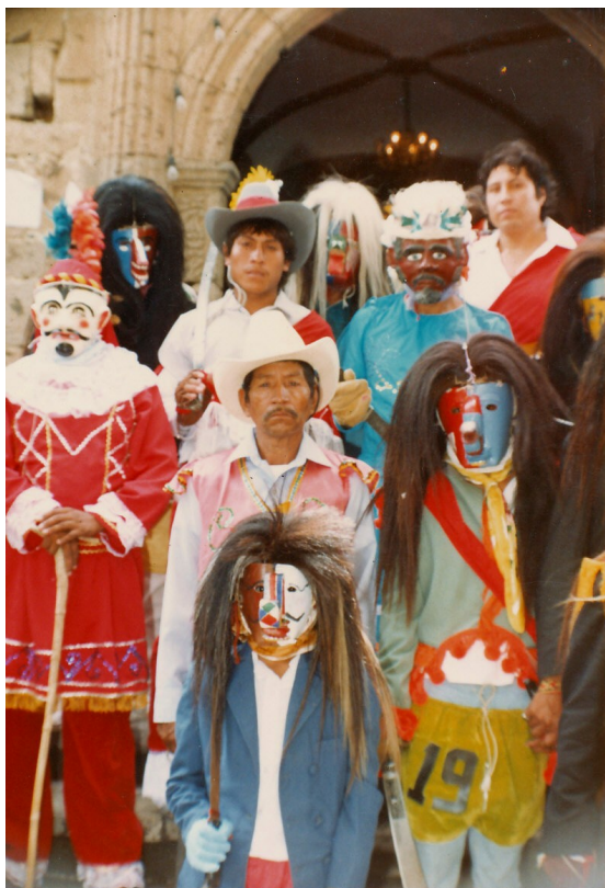
Tastoanes de Jalisco

The figure of Saint James Apostle has enjoyed of emblematic characteristics so much in Peninsular reconquest as in the New World conquest. And the worship to him dedicated, includes ritual elements with an important symbolic charge. Still nowadays, he is the most venerated saint in Mexico, having been transformed the festive rituals to him dedicated by spaniards into others that can be so enigmatic as the Jalisco's tastoanes . In order to give an interpretation of them, I'll apply an historic-formal analysis to the transformations system established by ritual confrontations between Saint James and his different antagonists, an other, structurally analogous, Holy Week and carnival fights.