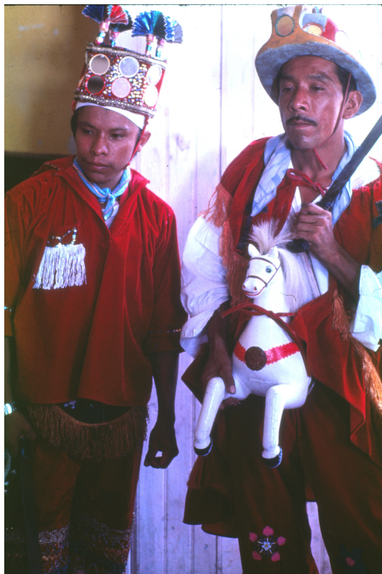
Santiago y Pilatos, en Moros y Cristianos