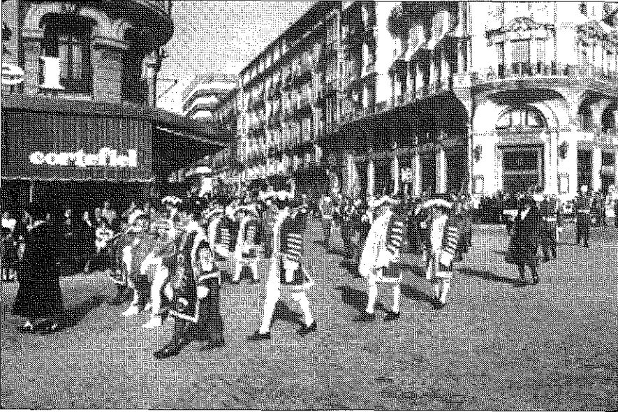
FIG. 1.—Comitiva cívica que recorre el centro de Granada cada 2 de enero.