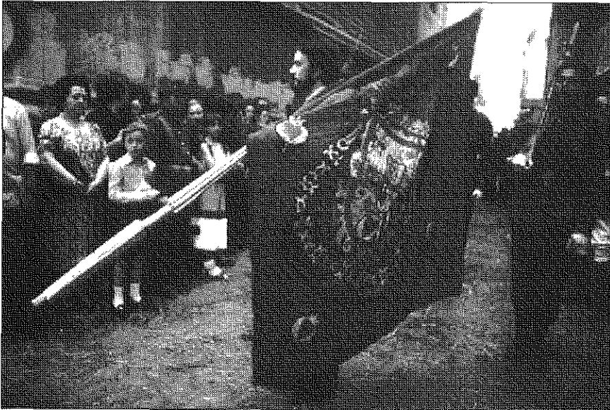
FIG. 2.—El pendón de la ciudad es el mayor protagonista simbólico de los actos.