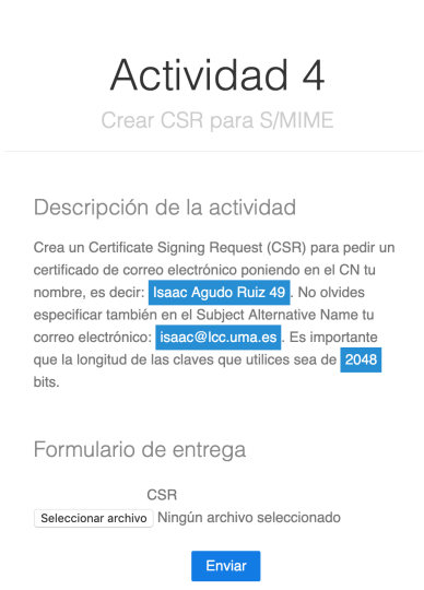
Figura 2: Interfaz Web de SERA

una retroalimentación que puede orientar al estudiante en la consecución de su objetivo. El módulo utilizado para las comprobaciones es el encargado de proporcionar la retroalimentación específica.