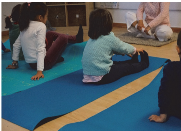
Imagen 32: Atención plena