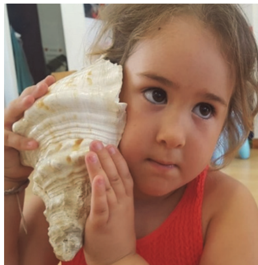
Imagen 36: ¡Magia!

Sería necesario apuntar que en este tiempo no solo nosotras/os como maestras/os hemos aportado lo mejor que teníamos, sino que hemos contado con la ayuda del equipo directivo que defendió el cambio y continúa apoyando la experiencia, la comunidad educativa, sobre todo las familias, dándonos tiempo y ánimo a transformar nuestra escuela, espacios y relaciones; a la UMA, por enriquecernos con prácticas del Máster y Grado, colaborando en la preparación de algunos ambientes y permitiendo colaborar con ellos en algunas experiencias, y al Ayuntamiento, realizando algunas mejoras necesarias para desarrollar los ambientes.