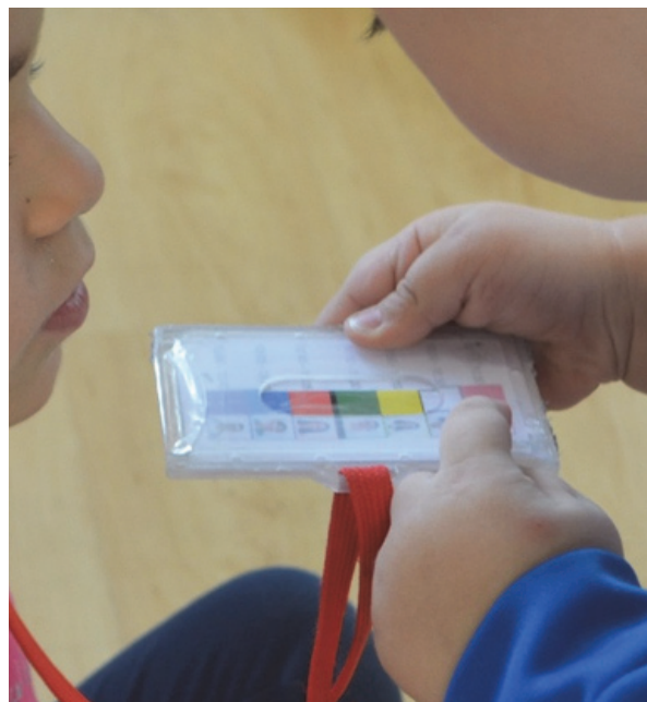
Imagen 5: ¿A qué ambiente vamos?

Aunque es importante la detección y atención temprana de las necesidades de todo el alumnado, no debemos olvidar en la etapa en que se encuentran, ya que etiquetar no es nuestra labor; nuestro trabajo también se centra en explicar y hacer entender a las familias la importancia de respetar la evolución, desarrollo y maduración de sus hijos/as, evitando realizar comparaciones que solo invitan a la presión y estrés por conseguir antes de tiempo o a la vez, retos, estrategias y conceptos que necesitan un tiempo y un momento adecuado para cada uno/a.