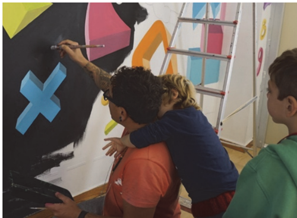
Imagen 34: Admiración