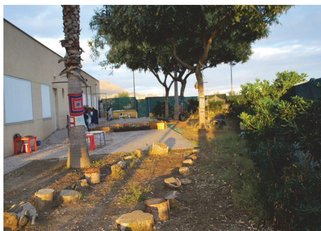
Imagen 27: Ambiente exterior

El niño conoce el mundo que le rodea a través de los sentidos; uno de estos es el de la vista, al que le acompaña el deseo de tocar, manipular y experimentar. El alumnado siempre está dispuesto a encontrar multitud de posibilidades lúdicas, y este espacio sin luz y multisensorial, le abre un mundo infinito de posibilidades donde interactúan con los diferentes materiales, luces, sombras y su propio cuerpo. Con este ambiente pretendemos que el alumnado fomente la curiosidad y estimule su creatividad, descubriendo y experimentando con diferentes fuentes de luz, percibiendo y diferenciando las diferentes texturas, formas, y experimentando con las sombras que proyectan los objetos y el cuerpo, manipulando materiales para descubrir los efectos de la luz, la ausencia de esta y sus propiedades, así como la ayuda a superar el miedo a la oscuridad y las sombras, favoreciendo el desarrollo de la percepción óculo manual.