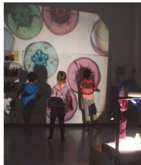
Imagen 26: Jugando con el retroproyector

El niño conoce el mundo que le rodea a través de los sentidos; uno de estos es el de la vista, al que le acompaña el deseo de tocar, manipular y experimentar. El alumnado siempre está dispuesto a encontrar multitud de posibilidades lúdicas, y este espacio sin luz y multisensorial, le abre un mundo infinito de posibilidades donde interactúan con los diferentes materiales, luces, sombras y su propio cuerpo. Con este ambiente pretendemos que el alumnado fomente la curiosidad y estimule su creatividad, descubriendo y experimentando con diferentes fuentes de luz, percibiendo y diferenciando las diferentes texturas, formas, y experimentando con las sombras que proyectan los objetos y el cuerpo, manipulando materiales para descubrir los efectos de la luz, la ausencia de esta y sus propiedades, así como la ayuda a superar el miedo a la oscuridad y las sombras, favoreciendo el desarrollo de la percepción óculo manual.