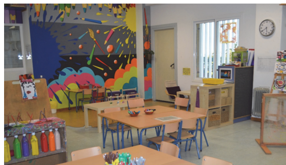
Imagen 17: Ambiente de arte

La pintura y el dibujo ofrecen al alumnado la posibilidad de expresar y comunicar sus ideas, experiencias, sentimientos, imaginación, ayudándoles a canalizar emociones y pensamientos que saldrán de su mundo interior, pudiendo ser compartidos con otros o simplemente explorando acciones que les provoquen disfrute y placer en su realización. Con este ambiente