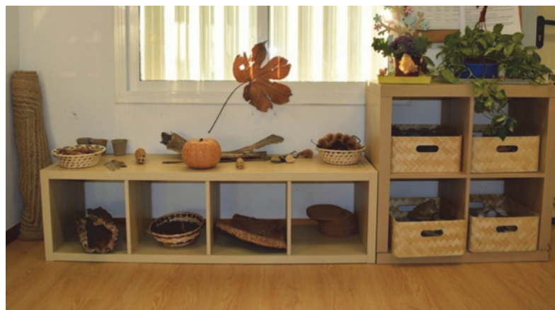
Imagen 8: Estética naturaleza

Nos encontramos los siguientes ambientes de aprendizaje: