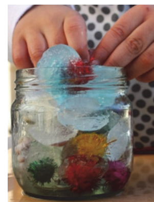
Imagen 2: Manipulación

Todo esto tenía que realizarse de forma coherente ante nuestra normativa de infantil, la cual dice que es una etapa en sí misma, que no es preparatoria para primaria y se trata de poner medios para potenciar el desarrollo de todas las capacidades, ya que como muy bien se expone en la normativa vigente, “la escuela infantil no puede ser concebida como un espacio y un tiempo para la enseñanza transmisora de conocimientos, ni como un lugar para la atención meramente fisiológica y de cuidado, sino como una institución que apoya, favorece y potencia el pleno desarrollo de todas las capacidades” (BOJA, 2008, p. 169).