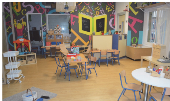
Imagen 19: Ambiente de lectoescritura

A través del lenguaje los niños y niñas son capaces de estructurar su pensamiento, conocer el mundo que les rodea y establecer relaciones con los demás. En este ambiente los niños van construyendo sucesivamente el conocimiento sobre las palabras, las letras y otras habilidades relacionadas con el desarrollo lingüístico, siempre vinculado al significado y al uso