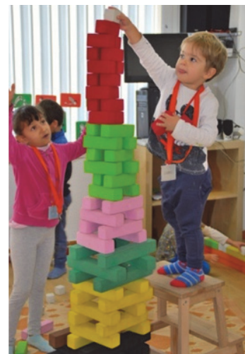
Imagen 22: ¡Mira qué alta!

La observación, manipulación y acción que realiza el alumnado sobre los materiales crea infinidad de conocimientos y experiencias que enriquecen la vida de estos, las relaciones con los otros y las vivencias con otros seres que habitan en dicho espacio. Con este ambiente pretendemos que el alumnado vaya descubriendo las propiedades de los objetos, realizando experiencias que le inviten al conocimiento de sus acciones y el descubrimiento de sus resultados, fomentando las relaciones con otros seres vivos, así como su cuidado, conocimiento y respeto.