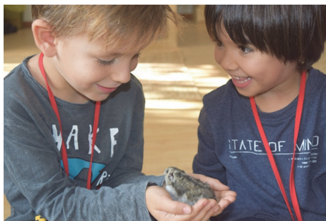
Imagen 30: Miradas cómplices

En definitiva, nuestra jornada escolar se sustenta en tres momentos diferentes de asambleas, donde cada nivel, programa contenidos y actividades a desarrollar, y dos momentos de ambientes, cuyos espacios a comienzos de curso han sido diseñado con la ayuda de todas/os y cada maestra/o le va dotando de vida durante el curso escolar, cambiando espacios, materiales y propuestas que nos ayuden a la consecución de nuestros objetivos.