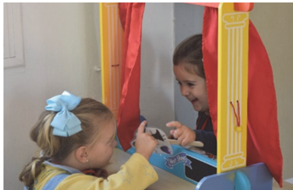
Imagen 1: ¡Se abre el telón!

El curso siguiente ya fuimos cuatro las maestras que componíamos el equipo de trabajo, hecho que suponía más compañeras involucradas y reflexionando en el proceso, aportando cambios y visiones que se fueron complementando, pero que