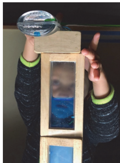
Imagen 6: Reto

Otro aspecto muy importante y que cambia de forma radical es que ya no somos maestras/os de 25 alumnos/as, sino que todo el alumnado de infantil entra en los ambientes, provocando entre todos comunicaciones y relaciones más variadas y abiertas, donde el alumnado cuenta con más opciones para elegir a otros/as en sus relaciones y tener otros adultos como referentes.