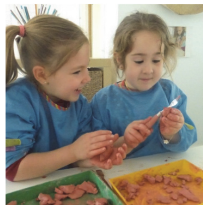
Imagen 16: Creando con barro

La creatividad es un elemento muy importante que ayuda a desarrollar y expresar el potencial humano, tanto a nivel cognoscitivo e intelectual como conductual y afectivo. En este ambiente intentamos desarrollarla y estimularla invitándoles a favorecer el pensamiento libre y divergente, dando rienda suelta a la imaginación y a las artes plásticas. Con este ambiente pretendemos que el alumnado vaya aprendiendo a anticipar proyectos y organizar su elaboración, a explorar a través de los sentidos con distintos materiales, valorando positivamente y respetando las elaboraciones propias y ajenas, reforzando habilidades básicas relacionadas con la psicomotricidad fina, la orientación espacial, la permanencia del objeto y la lateralidad, fomentando la imaginación y promoviendo el intercambio comunicativo y las habilidades