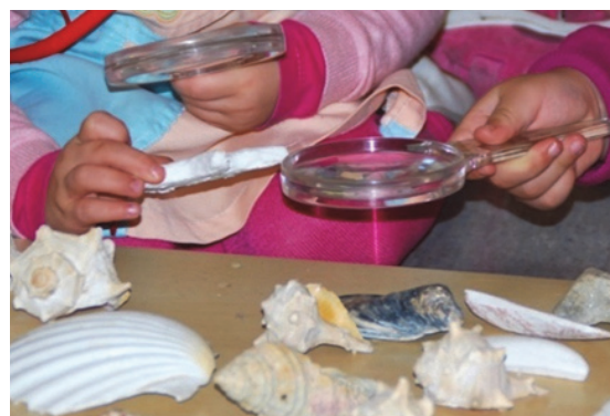
Imagen 24: Observación