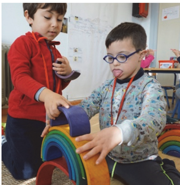
Imagen 4: Todos/as somos iguales

Según Calderón (2014) la educación tiene que ver con el acompañamiento a los demás en sus proyectos. Por lo que, como docentes, debemos atender a la diversidad en el aula. Llevando a cabo acciones educativas, programadas y diseñadas por el docente a nivel de aula o centro, para dar respuesta a las necesidades individuales del alumnado, independientemente de las características personales o circunstanciales que presente cada alumno/a, favoreciendo el desarrollo íntegro de la persona, respetando sus intereses, necesidades, ritmos de aprendizaje y ritmos de desarrollo.