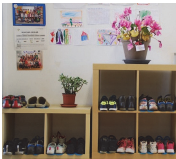
Imagen 29: ¡Qué bien se está descalzo!

objetos de la vida cotidiana, desarrollando habilidades motoras, de coordinación y equilibrio a través de las experiencias y materiales que les proponemos, explorando el entorno inmediato a través de los sentidos, respetando y cuidando el entorno vegetal y animal.