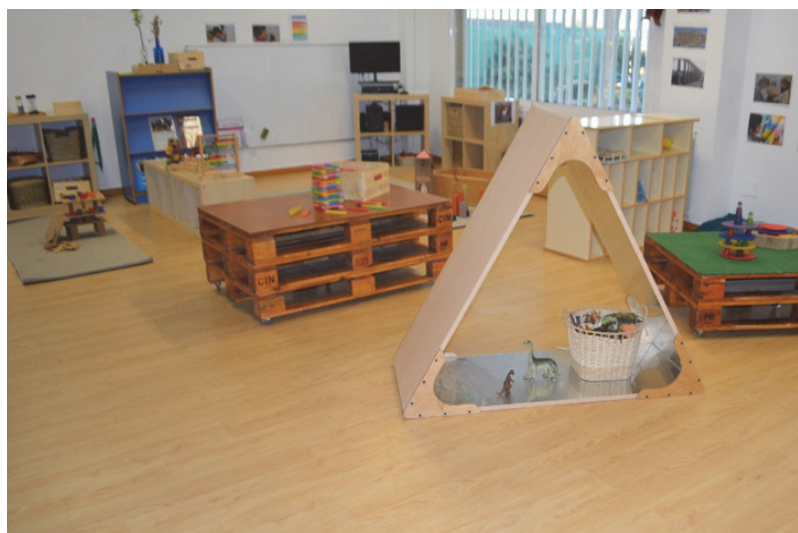
Imagen 11: Ambiente de construcción

Los materiales y juegos de construcción además de ser una de las actividades preferidas del alumnado, potencian y desarrollan sus capacidades en todos sus ámbitos. Con este ambiente pretendemos que el alumnado desarrolle su creatividad, la coordinación óculo-manual, la lógica y la visión espacial, experimentando con reglas físicas, descubriendo cualidades de los materiales, ejercitando la concentración e imaginación, el trabajo cooperativo, la expresión oral, el respeto al juego, así como las construcciones de los demás e intentando reforzar su autoestima.