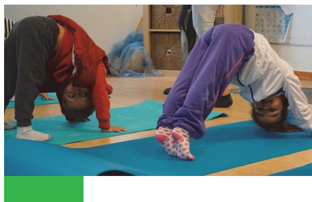
Imagen 33: Posturas de yoga

Partiendo de esta forma de hacer escuela también creemos y nos basamos en la Disciplina Positiva.