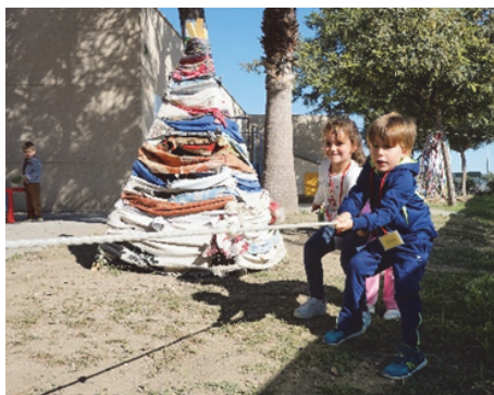
Imagen 28: Probando nuestra fuerza