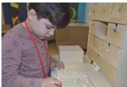
Imagen 20: Componiendo nombres

que estos hacen en distintas situaciones comunicativas. En este ambiente pretendemos que el alumnado vaya desarrollando habilidades comunicativas, indagando sobre el uso social del lenguaje y las diferentes formas de expresión, activando la invención de relatos y cuentos, así como la manipulación y relación con diferentes tipos de texto.