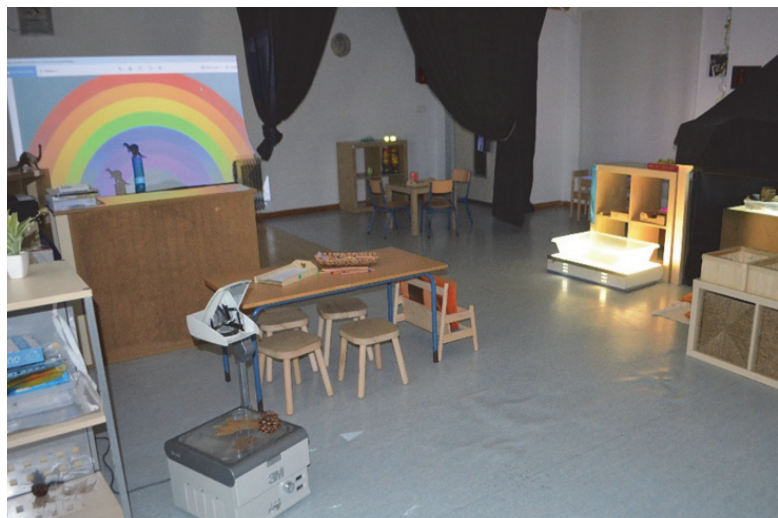
Imagen 25: Ambiente de luz