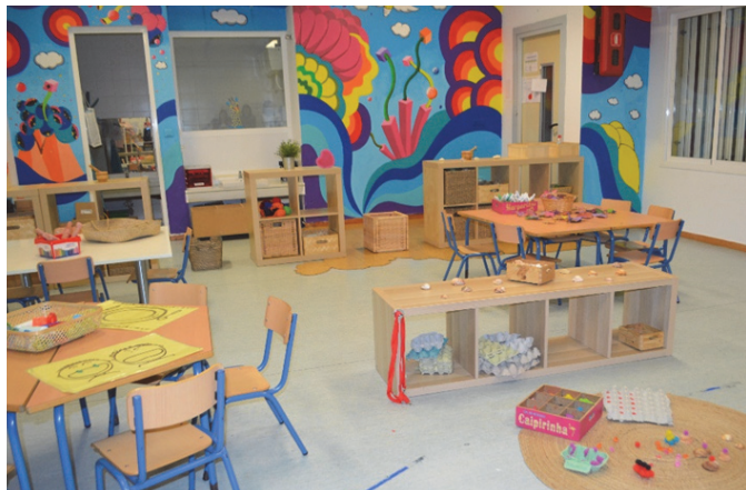
Imagen 15: Ambiente creativo

El juego simbólico es un tipo de juego en el que el alumnado puede desempeñar diferentes roles, imitando situaciones que observan en la vida cotidiana de los adultos; para hacerlo utilizan la imaginación y crean representaciones mentales. Este tipo de juego es una vía para: proyectar sus miedos, tensiones y conflictos internos, enriquecer su conocimiento social, entender los roles que ejercen las personas de su entorno, favorecer el desarrollo emocional, cognitivo y sus habilidades sociales, aprender a respetar normas y fomentar su autonomía y creatividad. Con este ambiente pretendemos favorecer el juego compartido, desarrollándose el alumnado emocionalmente, elaborando sus propias vivencias, asimilando y comprendiendo el entorno que le rodea, desarrollando su capacidad de imaginar, promoviendo la interacción lingüística y la socialización.