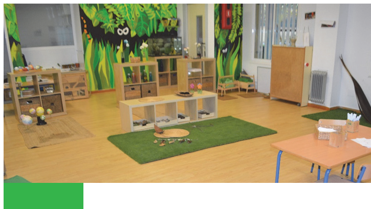
Imagen 23: Ambiente de naturaleza y experimentación