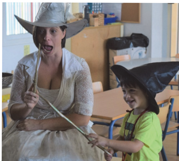
Imagen 35: ¡Sorpresa!

En la imagen anterior se muestra la participación de las familias en el aula es continúa en diversas actividades de cuenta-cuentos, talleres de baile, breves exposiciones sobre sus trabajos, siendo de guías en juegos más reglados como los juegos de mesa o aportando algún tipo de material que enriquece el proceso de enseñanza-aprendizaje.