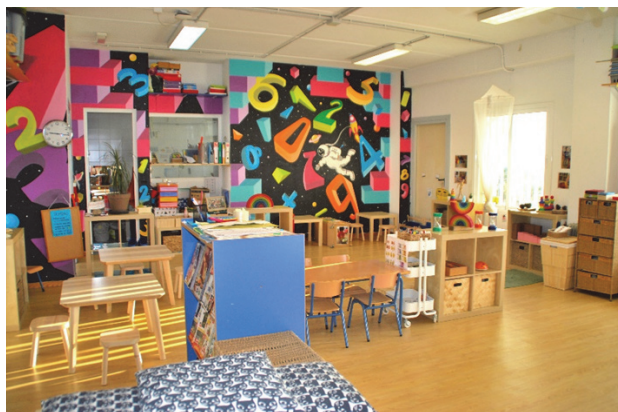
Imagen 21: Ambiente de lógica-matemática

El pensamiento lógico-matemático es fundamental para comprender conceptos abstractos, razonamiento y comprensión de relaciones. Es a través de las relaciones del alumnado con los materiales, juegos y experiencias, como se potencia las habilidades que contribuirán al desarrollo de la inteligencia matemática, así como a la capacidad de entender conceptos y establecer relaciones basadas en la lógica. Con este ambiente pretendemos que el alumnado vaya conociendo las cualidades y relaciones de los objetos mediante la observación y manipulación sobre ellos, incitándolos al uso de un pensamiento lógico-matemático en situaciones cotidianas, desarrollando la autonomía y la creatividad en la resolución de problemas, así como un espíritu crítico, aprendiendo a cooperar y a usar habilidades sociales respetando las normas de los juegos.