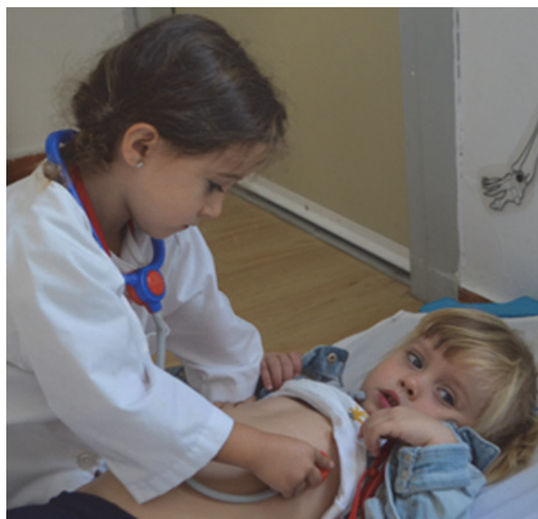
Imagen 14: Ambiente de juego simbólico