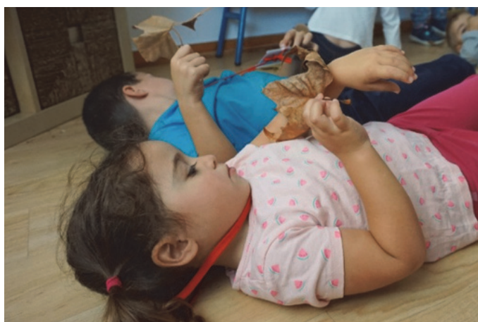
Imagen 31: La hoja

El Mindfulness para niños nos brinda toda una serie de posibilidades para mejorar desde bien temprano su atención, para ejercitar su cerebro en la empatía, en la calma y la gestión emocional. Asimismo, iniciar a nuestros pequeños/as en el mundo de la meditación facilita que puedan conectarse mucho mejor consigo mismos. Ofreciéndoles a nuestros niños/as un espacio seguro, libre de estrés, libre de angustia.