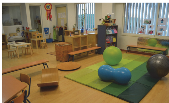
Imagen 9: Ambiente psicomotricidad y vida práctica

El desarrollo de la psicomotricidad permite a los niños/as explorar, investigar y conocer su cuerpo, así como el mundo que les rodea, superando dificultades y enfrentándose a sus limitaciones, superando sus miedos y disfrutando de conocer a los otros, desarrollando la fantasía, la iniciativa propia y la expresión libre.