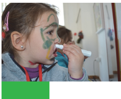
Imagen 18: Me convierto en...

pretendemos que el alumnado experimente y se exprese a través de la pintura y otros materiales artísticos, conociendo diferentes técnicas, creando sus propias composiciones con diversos materiales observando el resultado, fomentando el respeto y el conocimiento de obras artísticas propias y ajenas, así como la comunicación e intercambio de acciones y pensamiento entre el alumnado a través del arte.