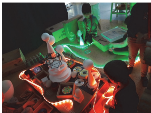
Imagen 3: Creación de escenarios

Por ello sentimos la necesidad de organizar unos ambientes donde se facilite y promuevan diferentes vivencias y recreaciones culturales, valorando la educación como fuente de cultura transformada en conocimientos y saberes que posibiliten y potencien el desarrollo de habilidades, procedimientos para pensar e interpretar el mundo, para expresarse, para convivir y para ser, facilitando el que los niños y niñas de esta etapa conozcan progresivamente la realidad en la que se desenvuelve su vida, y creando un clima afectivo que les ofrezca seguridad y estimule el descubrimiento de sí mismos y de su entorno. Creemos que el conocimiento compartido es indispensable para avanzar en el crecimiento