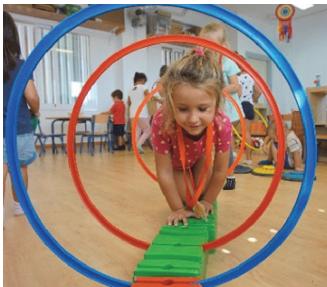
Imagen 10: Experiencia motriz

Con este ambiente pretendemos que el alumnado vaya adquiriendo autonomía en la realización de las actividades de vida práctica, progresando en la coordinación y control del cuerpo en situaciones psicomotrices, descubriendo sus posibilidades de acción y de expresión, explorando nociones básicas de orientación en el espacio del ambiente, favoreciendo el dominio del movimiento corporal para avanzar en la relación y la comunicación con los demás y los objetos estimulando la capacidad sensitiva.