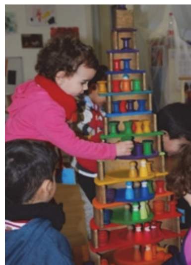
Imagen 12: Torre