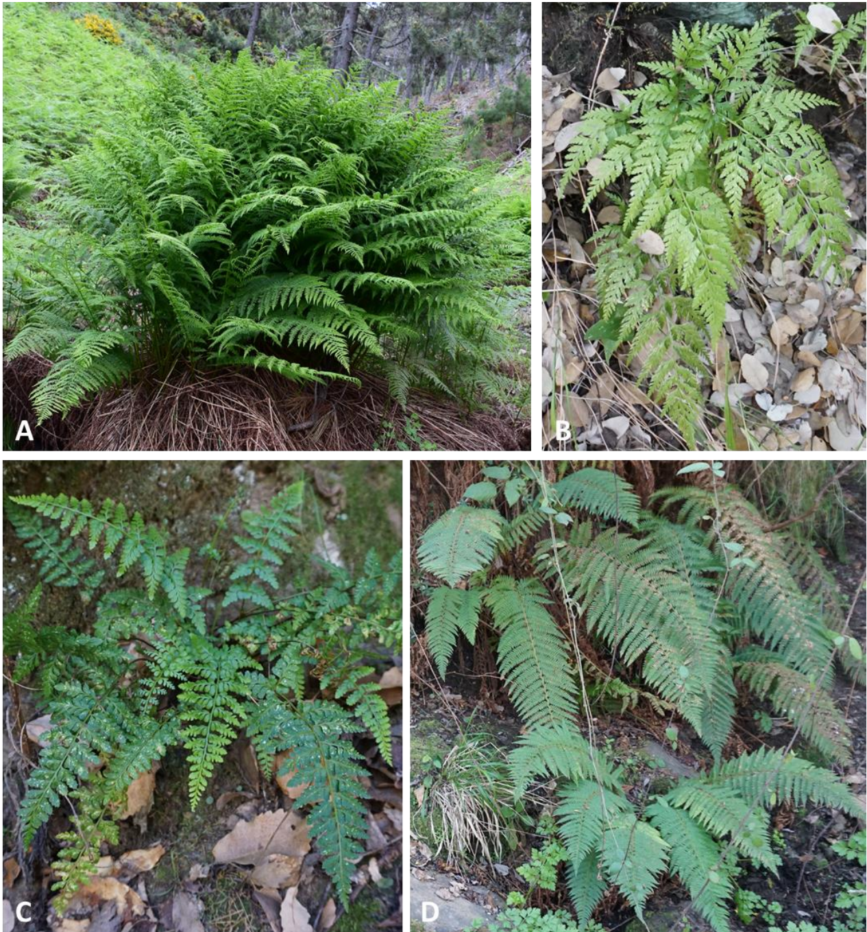
Figura 3. Helechos de óptimo aljibico en la zona de estudio: A) Athyrium filix-femina (Peñón del Robledal, 1350 msnm.); B) Asplenium onopteris (La Máquina, 250 msnm.); C) Asplenium billotii (Peñón del Robledal, 1350 msnm.); D) Polystichum setiferum (Barranco de la Cuerna, 550 msnm.). Figure 3. Ferns typical of Aljibico sector in study area: A) Athyrium filix-femina (Peñón del Robledal, 1350 msnm.); B) Asplenium onopteris (La Máquina, 250 msnm.); C) Asplenium billotii (Peñón del Robledal, 1350 msnm.); D) Polystichum setiferum (Barranco de la Cuerna, 550 msnm.)

Este taxón engloba a las plantas rupícolas, con frondes aplicadas al substrato, con pinnas de base simétrica y al menos el doble más largas que anchas, frecuentemente con 2 aurículas en la base.