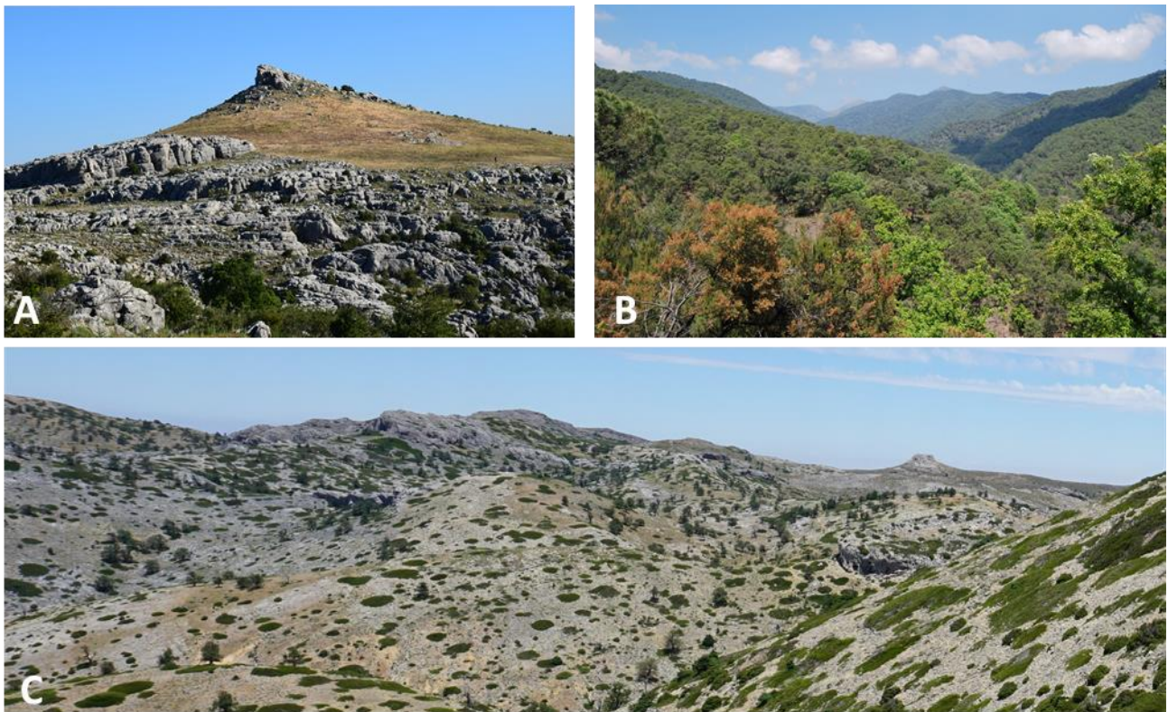
Figura 5. Tres de los enclaves más singulares, por los helechos que albergan, del Espacio Natural Sierra de las Nieves: A) Sierra Blanquilla, alrededores del cerro del Viento; B) Parte alta de la Cuenca del río Guadaiza, desde las Maquinas a las casas del Daidín; C) La zona a mayor altitud del Espacio Natural Sierra de las Nieves, Meseta del Quejigal de Tolox. Figure 5. Three of most unique places, for its ferns, of the Sierra de las Nieves Natural Area: A) Sierra Blanquilla surroundings of Cerro del Viento; B) Upper part of the Guadaiza river basin, from The Machine to Daidín's Houses; C) The highest altitude area of Sierra de las Nieves Natural Area, Plateau of Quejigal de Tolox.