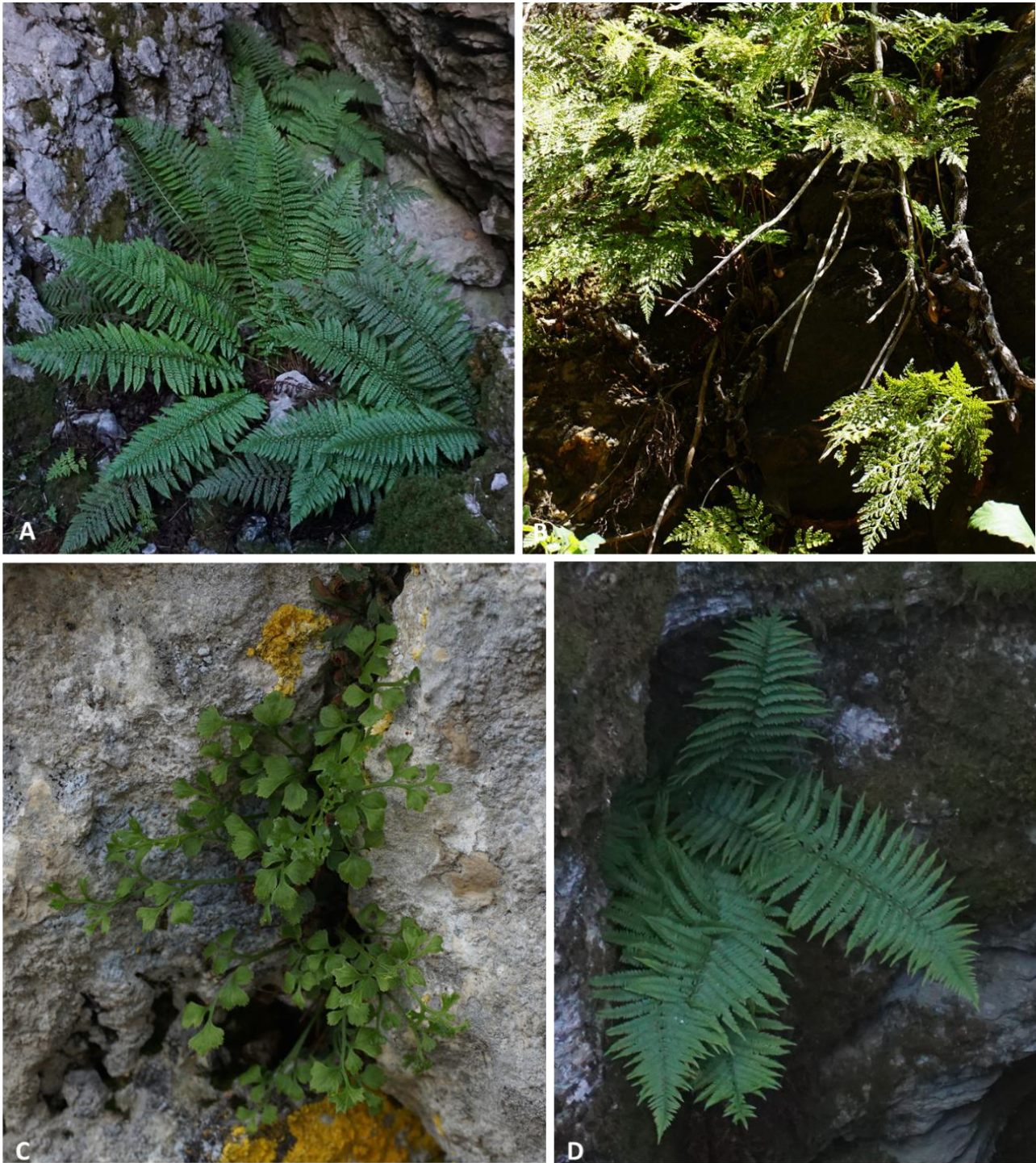
Figura 4. Helechos cuyas poblaciones en el Espacio Natural Sierra de las Nieves representan su límite de distribución en la Península Ibérica: A) Polystichum aculeatum (Puerto de los Pilonos, 1750 msnm); B) Davallia canariensis (Tajos del Mirador, 550 msnm); C) Asplenium ruta-muraria (Pilar de Tolox, 1750 msnm); D) Dryopteris filix-mas (Hoyos del Pilar, Sima Honda, 1715 msnm).

Figure 4. Ferns whose populations in the Sierra de las Nieves natural Area represent their distribution limit in the Iberian Peninsula: A) Polystichum aculeatum (Puerto de los Pilonos, 1750 msnm); B) Davallia canariensis (Tajos del Mirador, 550 msnm); C) Asplenium ruta-muraria (Pilar de Tolox, 1750 msnm); D) Dryopteris filix-mas (Hoyos del Pilar, Sima Honda, 1715 msnm).