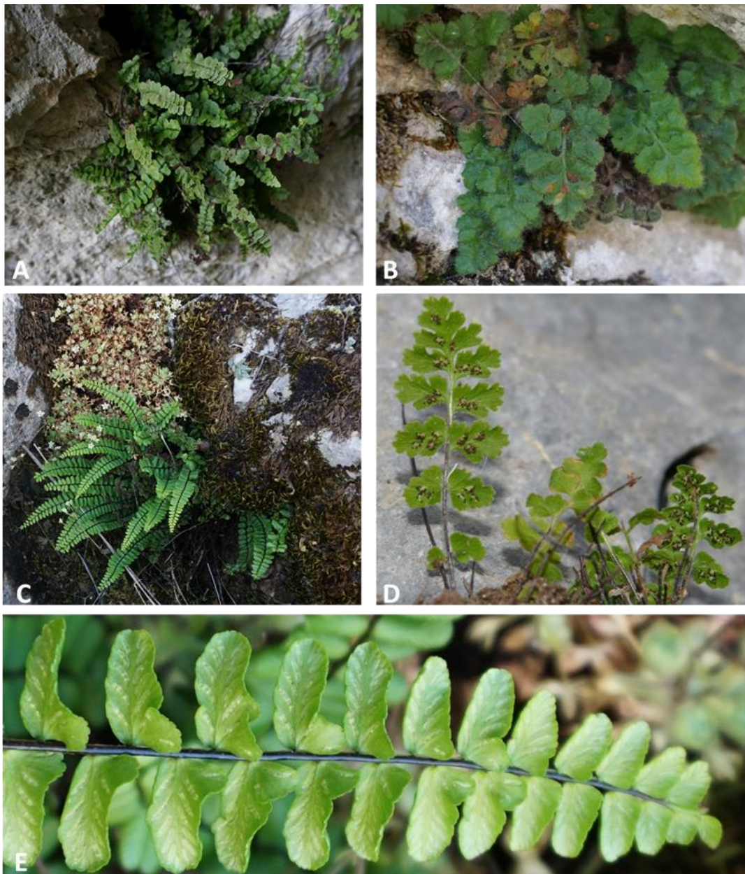
Figura 2. Taxones del género Asplenium de óptimo rondense, todos rupícolas y calcícolas: A) A. jessenii (Pilar de Tolox, 1700 msnm.); B) A. hispanicum (Cortijo de Bolina, 1165 msnm); C) A. azomanes (Cortijo de Bolina, 1165 msnm); D) A. petrarchae (Cortijo de Bolina, 1165 msnm); E) A. azomanes , detalle del fronde, nótese la neta aurícula de las pinnae que aloja un soro en distinta disposición al resto.

Todos los pliegos recolectados en los años 2017 al 2020 se encuentran depositados en el herbario MGC y georreferenciados al menos en cuadrículas UTM de 1x 1 km.