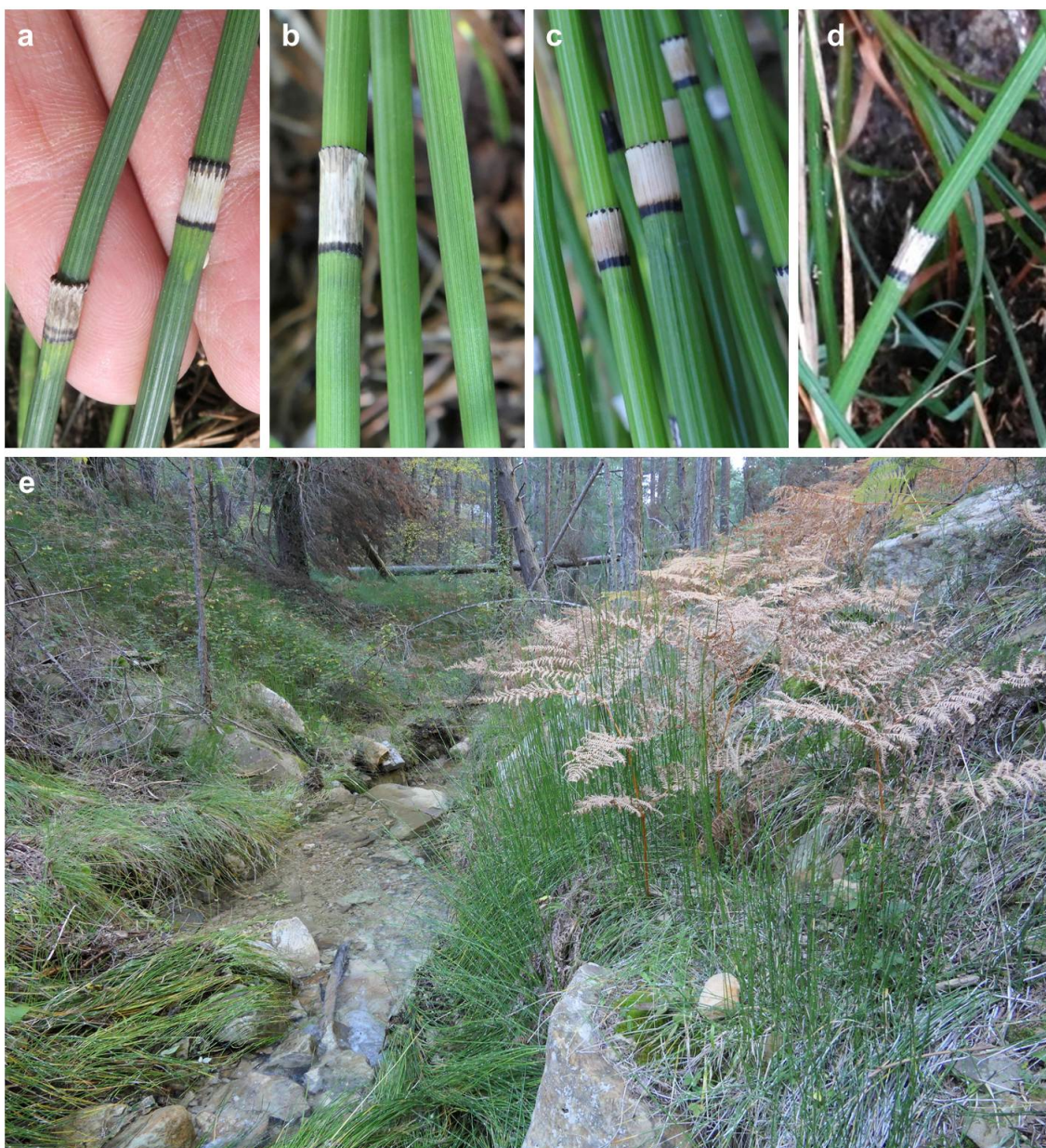
Figura 1. Detalle de las vainas foliares de la parte media de los tallos de plantas de Equisetum moorei procedentes de las poblaciones de (a) Masía del Zurdo, (b) barranco del Azor y (c) barranco del Monzón en Vistabella del Maestrat, y (d) La Pobla de Benifassà. (e) Aspecto general de la población de Equisetum moorei del barranco del Monzón. Todas las imágenes fueron obtenidas en 2018.