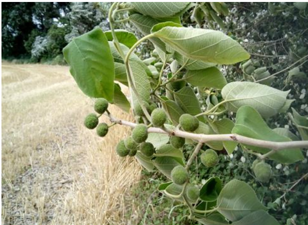
Figura 4. Detalle de los glomérulos femeninos de uno de los ejemplares.

Figure 4. Detail of the female glomeruli of one specimen.