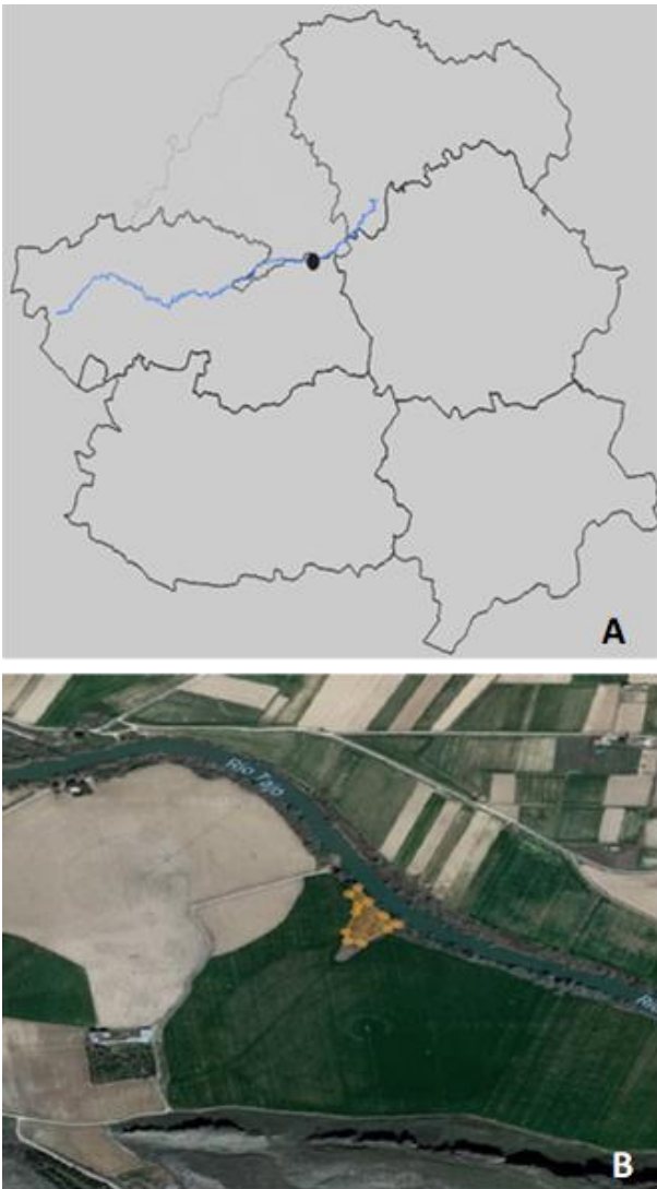
Figura 2. A) Localización de la población de B. papyrifera detectada en el río Tajo en la provincia de Toledo (coordenadas 472940/4432123, ETRS89). B) En naranja se delimita la presencia de esta población.

Figure 2. A) Location of the population of B. papyrifera detected in the Tagus River, in the province of Toledo (coordinates 472940/4432123, ETRS89). B) The presence of this population is delimited in orange.