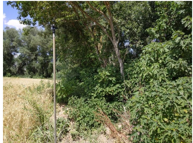
Figura 3. Imagen de la población de B. papyrifera detectada. Al fondo se aprecia una chopera de Populus alba .

de zonas. En ese periodo, solo se ha encontrado una referencia que alude a una posible naturalización (Laguna, 1870), concretamente en Montealegre (provincia de Barcelona), donde se habla de ejemplares con “aspecto de asilvestrados ”. Casi 100 años después, varios autores coincidieron en que crecía cultivada en jardines, pero que puntualmente podía naturalizarse (Bolós & Vigo 1990; Castroviejo 1993). En la actualidad, está incluida en la flora alóctona de España (Sanz-Elorza et al. 2004).