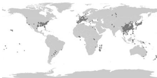
Figura 1. Distribución de Broussonetia papyrifera en el mundo.

En la provincia de Toledo se ha detectado una población naturalizada de B. papyrifera en la ribera de río Tajo (Santiago de Villarrubia) (Figuras 2, 3 y 4). Se ha depositado un pliego testigo en el Herbario de la Universidad de Granada (GDA). En el presente trabajo se discuten algunos aspectos generales relacionados con la especie, y se realizan valoraciones sobre la población encontrada.