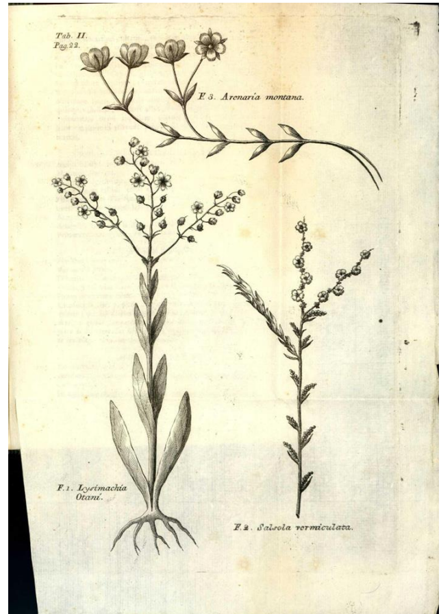
Figura 1. Lectotipus de Arenaria montana var. major Boiss. Icono Synopsis stirpium indigenarum Aragoniae . (1779) tabl.2 , fig. 3.