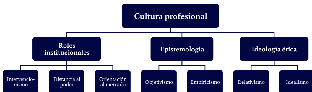
Figura 1. Dimensiones de la cultura profesional según Hanitzsch (2007).

Los roles institucionales —inspirados, entre otros, en el modelo bidimensional de Donsbach y Patterson (2004), en el que los profesionales se muestran pasivos o activos, en la primera dimensión, y neutrales o partidarios, en la segunda— están formados por el intervencionismo, la distancia al poder y la orientación al mercado. La postura intervencionista del periodista se mide en función de su grado de implicación: por un lado, se encuentran los profesionales socialmente comprometidos e involucrados en la promoción de ciertos valores y metas; por otro, los observadores imparciales, alejados del foco de la acción, que priman la neutralidad y la objetividad (Hanitzsch, 2007). La distancia al poder, por su parte, se relaciona con la posición que toma el periodista con respecto a los órganos de mando de la sociedad. Existirían, así, el polo de adversarios tan arraigado en las democracias liberales, que “desafía abiertamente” a las altas instancias y tiende a considerar la profesión como un cuarto poder que debe ejercer de perro guardián o watchdog ; y el leal, que considera que la función del periodismo es la de servir de apoyo al gobierno para fomentar el desarrollo nacional (Hanitzsch, 2007: 373-374). Por último, la orientación al mercado tiene que ver con el objetivo del producto periodístico, y se condensa en dos máximas opuestas: contar lo que el público debe saber para promover una ciudadanía crítica y bien formada e informada ( citizen-oriented ) o contar lo que el público