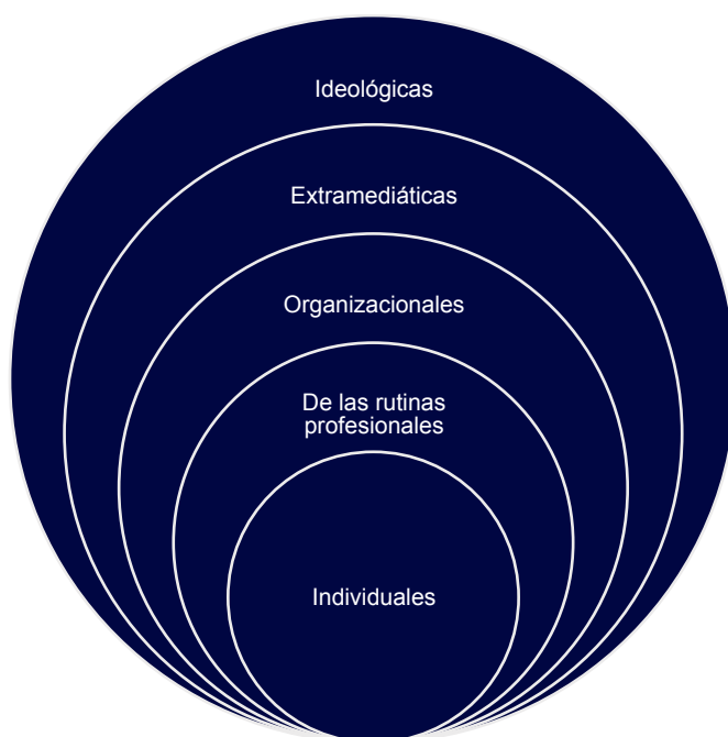
Figura 3. Modelo de jerarquía de influencias de Shoemaker y Reese (1996).

El nivel individual está compuesto por tres categorías básicas: las características generales del periodista y su background sociodemográfico (edad, género, etnia,