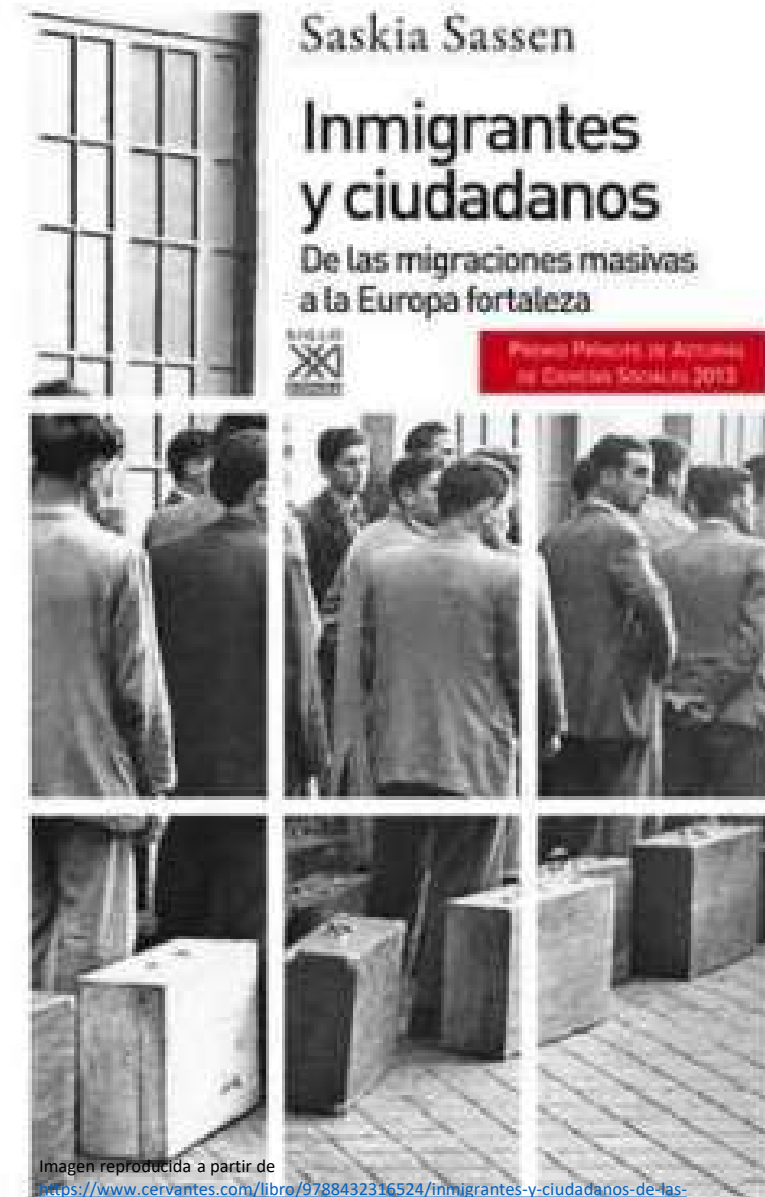
Imagen reproducida a partir de

https://www.cervantes.com/libro/9788432316524/inmigrantes-y-ciudadanos-de-las-migraciones-masivas-a-la-europa-fortaleza/?eans=9788432316524