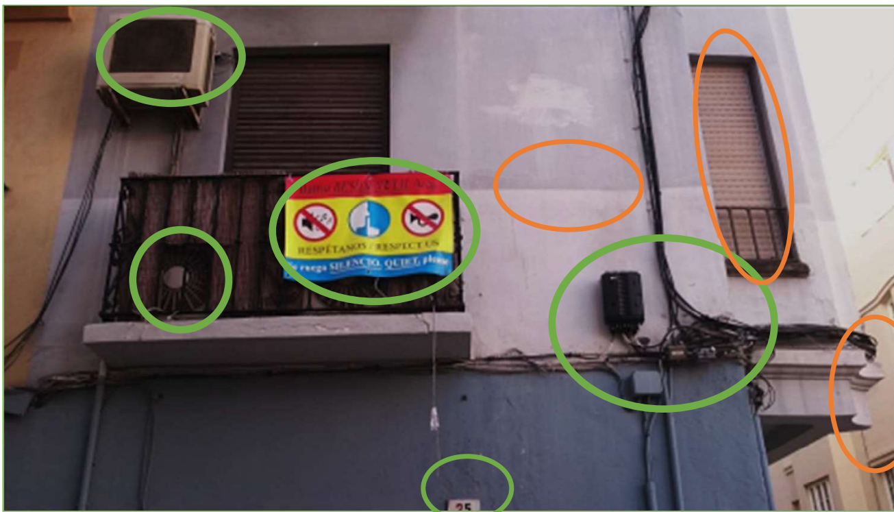
Análisis concepción holística del patrimonio cultural en fachada histórica de valor tipológico en el Conjunto Histórico de Málaga [16/06/2019] Elaboración propia-