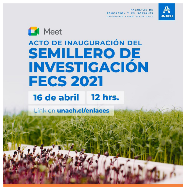
Figura 2. Semillero de Investigación FECS, 2021.

Se avanzó con la incorporación de mecanismos de progresividad de la investigación por carrera, a través de un tejido de implicaciones de los grupos de investigación asociados en los que participan los profesores de las respectivas carreras, estudiantes colaboradores de investigación, temas de TFI-TFC con proyección a 3-4 años, líneas de investigación de la carrera, etc. Y de esta instancia surge el avance en términos de presentar la propuesta de creación de semilleros de investigación (Ver Figura 2), incorporando además estudiantes como colaboradores en proyectos de investigación de profesores de las diferentes carreras, obteniendo algunos resultados en el año 2020 con estudiantes que participaron como coautores en el artículo publicado por Reyes et al. (2021); además de tener participación como ponentes en eventos de carácter internacional (Ver Tabla 2 en página siguiente).