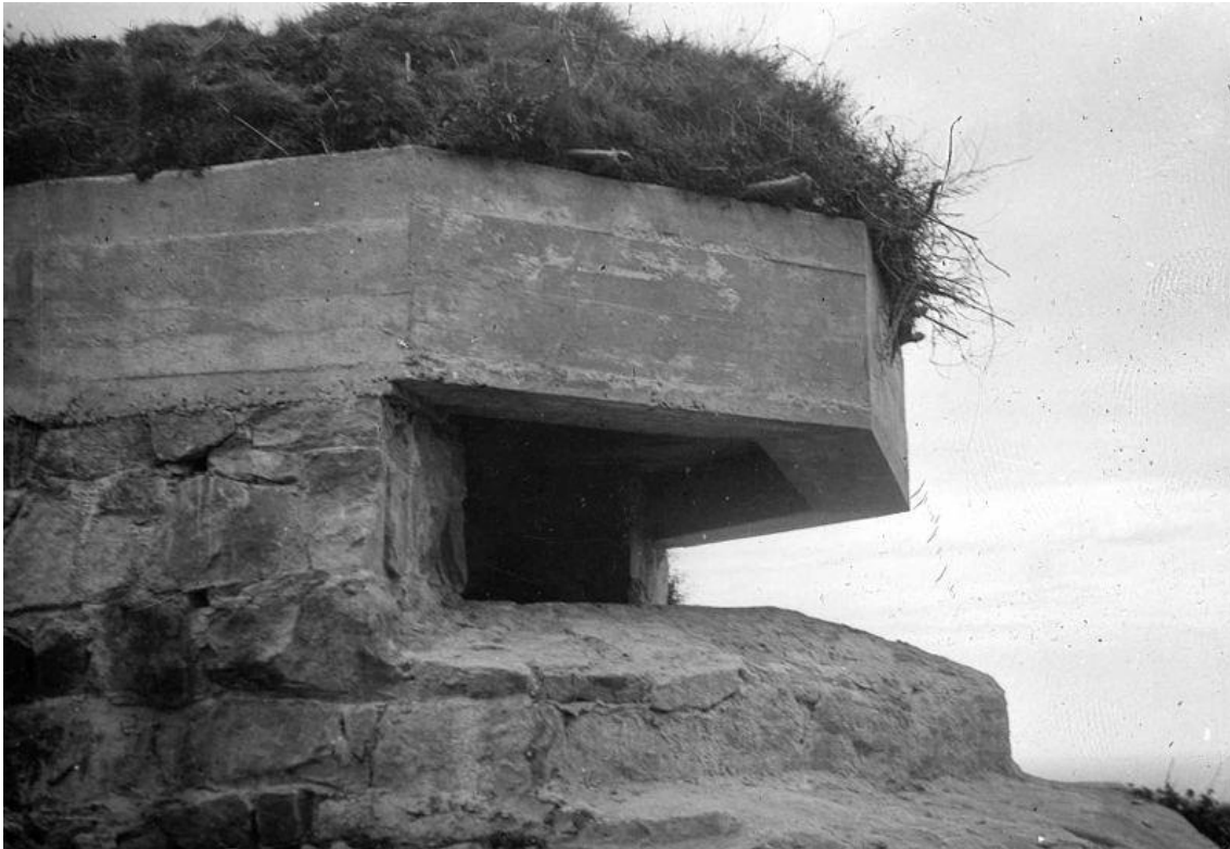
Cinturón de hierro.