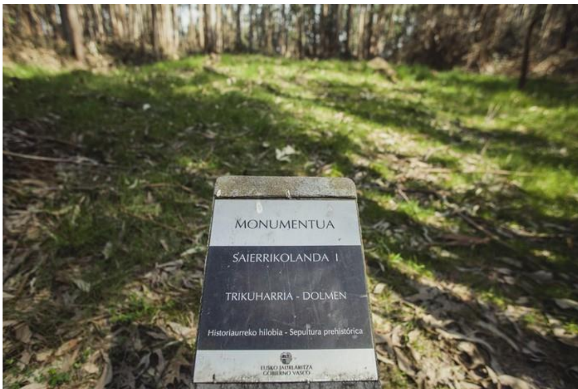
Dólmenes de Munarrikolanda.