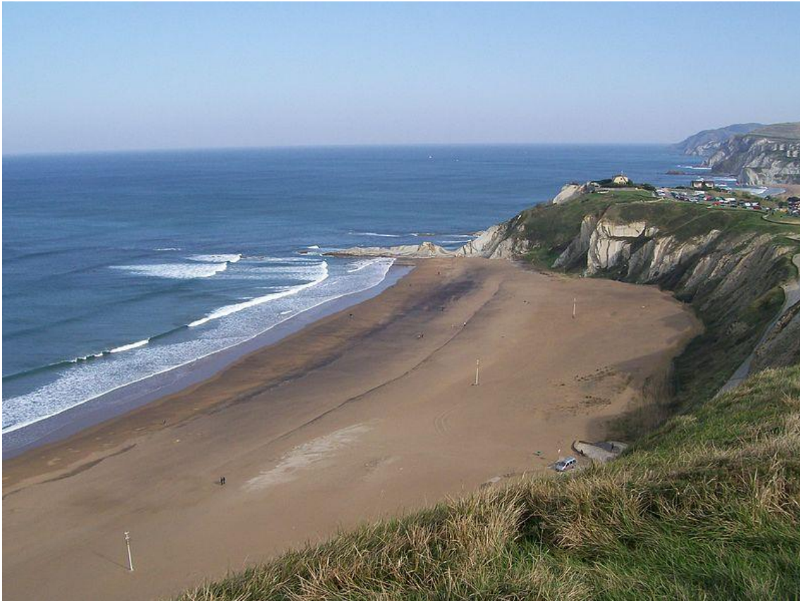
Playa de Barinatxe.