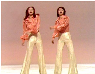
Las Grecas, en su debut en televisión, en 1974