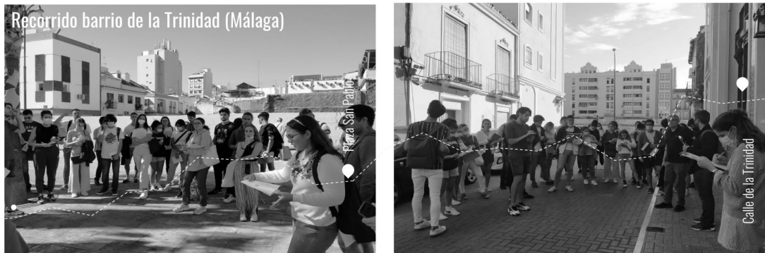
Fig. 4 Visita junto con estudiantes al barrio de la Trinidad.

Los estudiantes situaron en el barrio de estudio, el actante geocalizándolo en el mapa colaborativo. Para ello, se utiliza la plataforma My Maps de Google en la que cada estudiante identifica el actante en el barrio a través de foto, vídeo, audio, etc. y lo sube al mapa colaborativo haciendo referencia a la presencia o ausencia del actante en ese lugar acompañado de un texto que justifique su elección y una fuente de información fruto de su indagación.