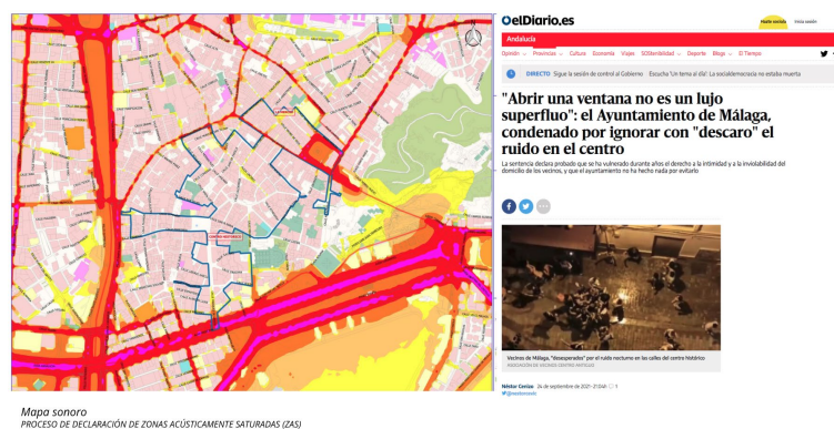
Fig. 2 Muestra Actante contaminación acústica a través de mapa sonoro y noticias en medios de comunicación.

Tras esto se hizo una revisión de los actantes incluidos y no incluidos en el mapeo de controversia realizado en la actividad anterior, previa a la visita al barrio, para que los estudiantes pudieran tener una visión no sólo de lo que habían trabajado, sino también una visión más completa además de ejemplos de la conexión de los actantes , como es el caso de la contaminación acústica y la salud en las viviendas (figura 2). Cada estudiante seleccionó un actante de los espacios para los cuidados en la ciudad y realizó una indagación a través de libros, artículos, noticias, normativa, documentales, etc. Esta indagación la realizó cada estudiante fuera del aula como preparación previa a la visita del barrio, para una vez seleccionado poder situar y geolocalizar al actante en el barrio durante la visita relacionándolo con la indagación previa.