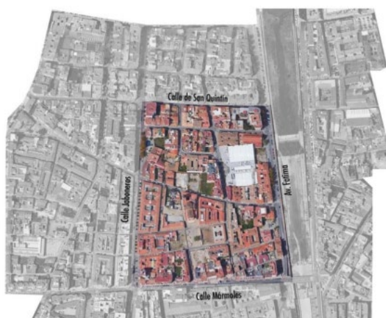
Fig. 3 Área de estudio.

El barrio de la Trinidad, en su origen fue un Arrabal de la ciudad cristiano-musulmana, en el siglo XVI se convirtió en un campamento militar de los reyes católicos. En el siglo XX llega la revolución industrial malagueña y con ella una explosión demográfica que afianzó el carácter obrero del barrio. La arquitectura tradicional del barrio son los corralones, casas patio de vecinos de vivienda social dónde se convive alrededor de un patio central. El barrio siempre se ha caracterizado por la presencia de clases populares generando unas pautas de convivencia muy ricas y un desarrollo urbano de apropiación y transformación del barrio. Actualmente tanto los corralones, como las pautas de convivencia, se han visto transformadas a viviendas y edificios aislados de la vecindad y alejados de la vida urbana hasta llegar al abandono de algunas partes y solares del barrio.