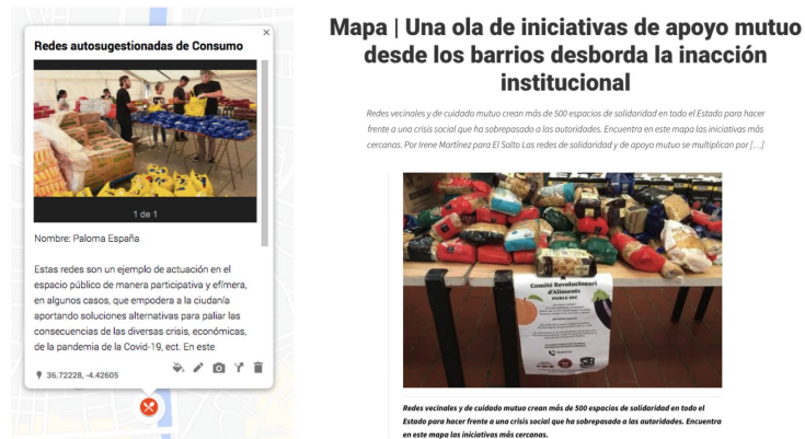
Fig. 1 Explicación de mapa colaborativo ( My Maps ) y contexto de su uso

En la primera sesión se explicó el enunciado de la actividad y se introdujo el uso del mapa colaborativo a través de la herramienta My Maps de Google para la geolocalización de los actantes en el territorio de estudio, en concreto, en el barrio de la Trinidad en Málaga. Este tipo de mapa colaborativo virtual ha sido usado durante la pandemia de la Covid-19 como mecanismos sociales de creación de redes vecinales, como, por ejemplo, “redes de apoyo” como iniciativa de apoyo mutuo desde los barrios 1 (figura 1).