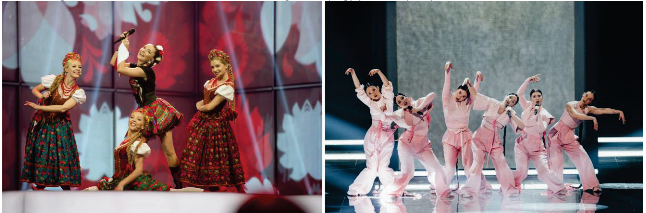
Figura 3. Plano entero de las actuaciones polaca (izq.) y checa (der.) en el Festival de Eurovisión.