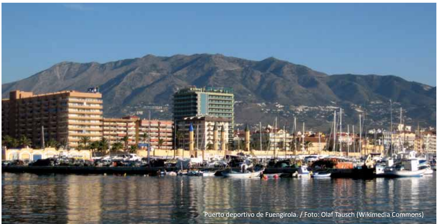
Puerto deportivo de Fuengirola.

Otra de las estrategias de actuación en los destinos turísticos maduros es la rehabilitación de muchas piezas regladas como es el caso de los puertos deportivos. Su construcción produce fuertes impactos sobre el paisaje de la costa lo que se