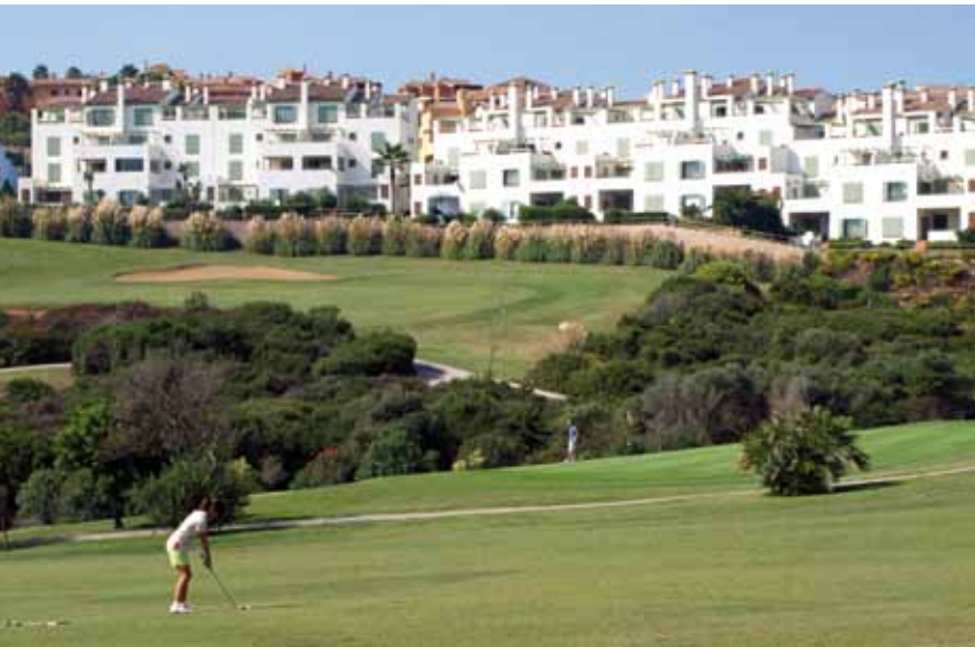
A la izquierda, urbanización construida junto a un campo de golf en la Costa del Sol.

Foto: Aurora Álvarez Narváez ( Uciencia ).