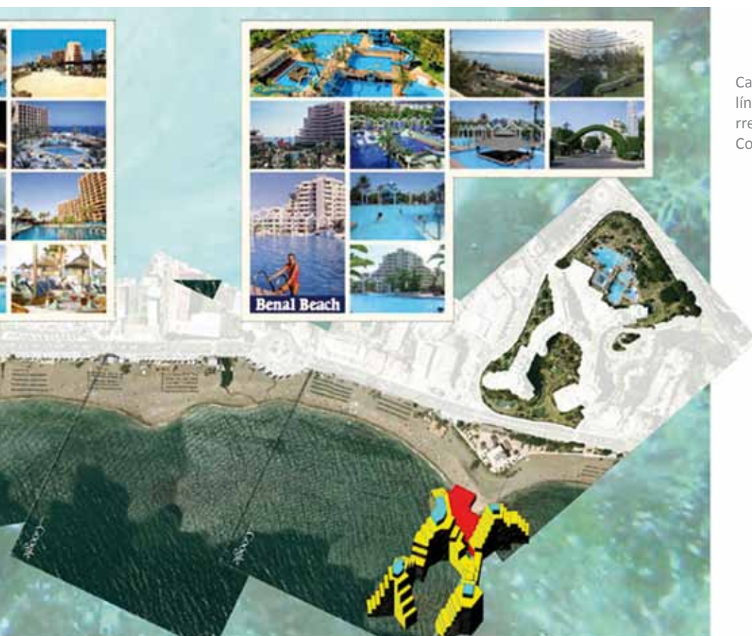
Cartografía de paraísos pagados en la primera línea de Costa, Arroyo de la Miel, Bil-Bil, Torrequebrada. Proyecto Atlas del Turismo de la Costa del Sol.

que otras investigaciones profundizan en el análisis de las piezas urbanas ligadas al ocio, como son el campo de golf, las marinas y puertos deportivos, y las piezas hoteleras. En todas ellas nos enfrentamos, por una parte al reconocimiento de la obsolescencia, y por otra a la necesidad de regenerar y proyectar desde criterios paisajísticos que recualifiquen y garanticen la sostenibilidad.