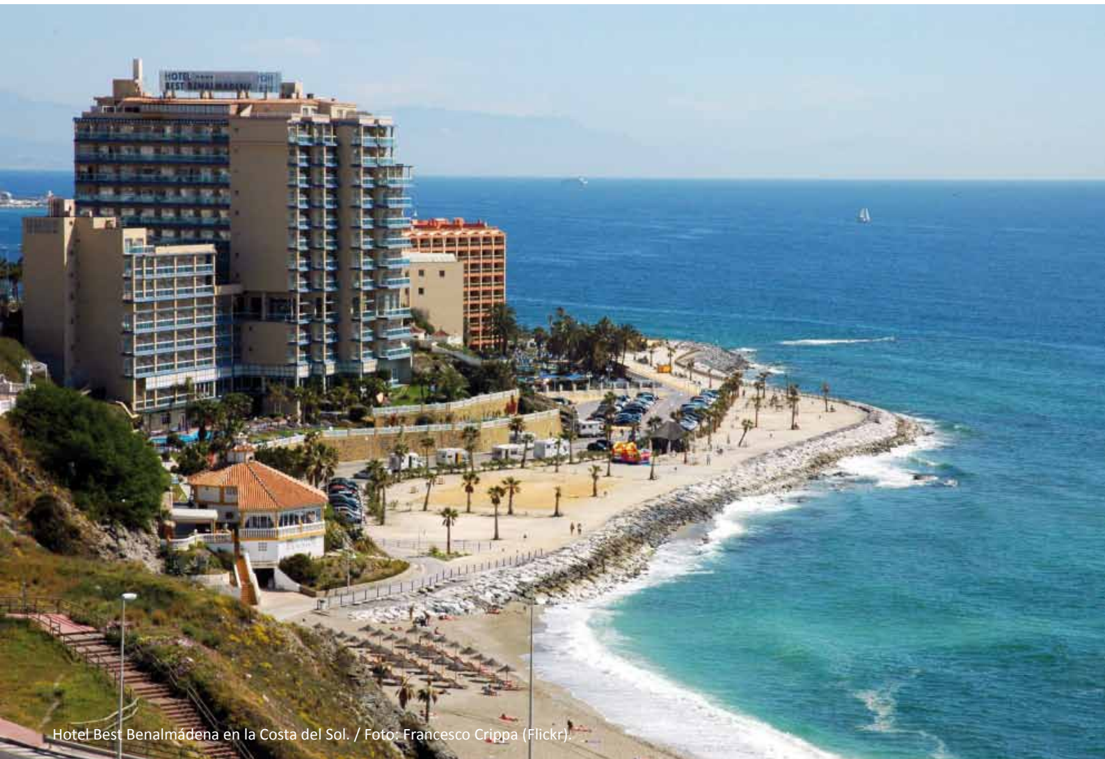
Hotel Best Benalmádena en la Costa del Sol. / Foto: Francesco Crippa (Flickr).

traduce en el cambio de configuración del medio marino, la modificación de la dinámica litoral, la ocupación de la costa y un descompensado crecimiento de las urbanizaciones en el entorno de estas infraestructuras. Por otra parte, es necesario considerar las ventajas de estas instalaciones, que han supuesto un elemento de promoción turística y económica, y contribuido al desarrollo económico y social de muchas poblaciones costeras.