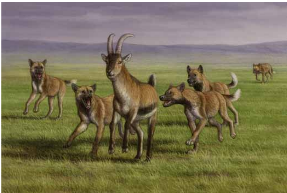
Reconstrucción de una jauría del cánido hipercarnívoro, Lycaon lycaonoides , en un lance cinegético sobre un caprino, Hemitragus albus . Ilustración: Mauricio Antón.

Abajo, pareja de félidos con dientes en forma de cimitarra, Homotherium latidens , abatiendo a una cría de hipopótamo, Hippopotamus antiquus . Ilustración: Mauricio Antón.