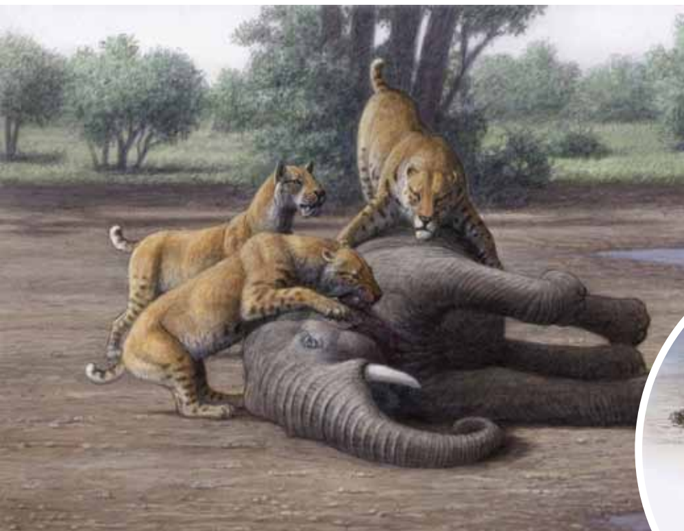
Reconstrucción de un grupo de félidos con dientes en forma de cimitarra, Homotherium latidens , abatiendo a un elefante. Ilustración: Mauricio Antón.

Abajo, Hiena gigante, Pachycrocuta brevirostris , fracturando un hueso largo de ungulado para acceder a la médula de su interior. / Ilustración: Mauricio Antón.