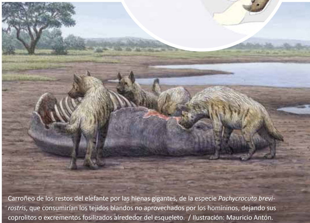
Carroñeo de los restos del elefante por las hienas gigantes, de la especie Pachycrocuta brevirostris , que consumirían los tejidos blandos no aprovechados por los homínidos, dejando sus coprolitos o excrementos fosilizados alrededor del esqueleto. / Ilustración: Mauricio Antón.

Tales evidencias sugieren una adaptación temprana de nuestros antepasados al consumo de carne, lo que quizás se podría situar hacia el origen del propio género Homo , hace dos millones y