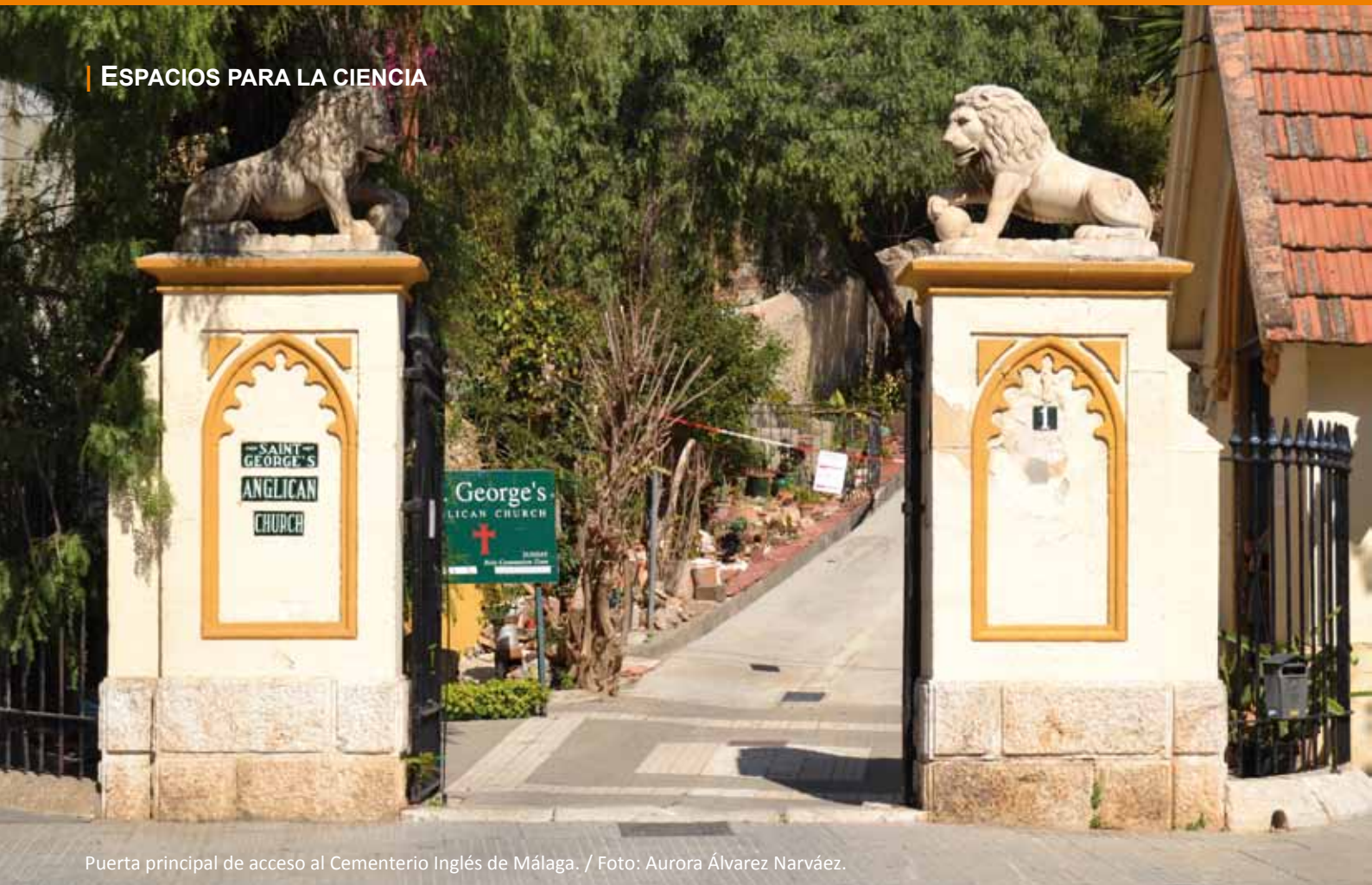
Puerta principal de acceso al Cementerio Inglés de Málaga.