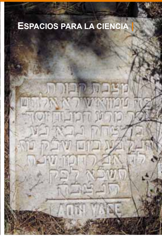
El Cementerio Inglés cuenta con numerosos elementos arquitectónicos singulares. Destacan las cruces celtas, los ángeles románticos, caracteres hebreos, templetos o las tumbas de personajes ilustres como Gerald Brenan o los restos de los náufragos del Gneisenau.

fantiles de ladrillos de adobe y conchas. Un solar donde también fue inhumado -como primer enterramiento intramuros- el cuerpo del heroico Robert Boyd, fusilado junto al general Torrijos en la playa malagueña de San Andrés.