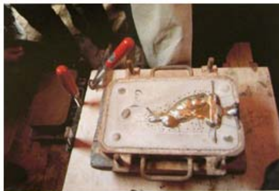
Joseph Beuys, Liebre de la paz con accesorios .