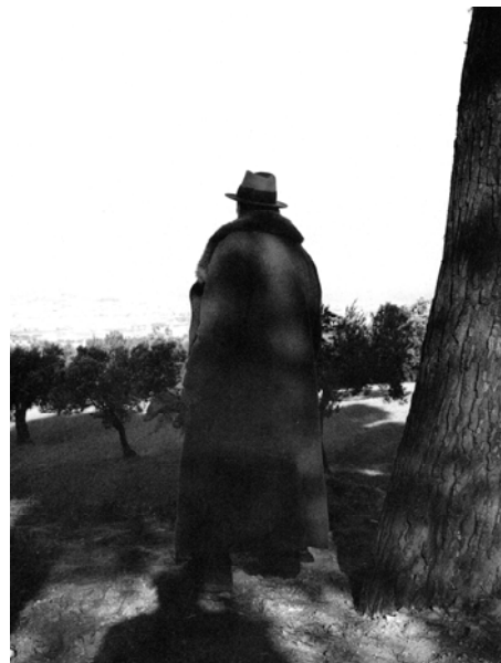
Retrato de Joseph Beuys durante la Operazione Difesa della Natura .

Los proyectos de Beuys no se limitaban a ser estrategias de mejora del mundo físico y social. Su voluntad se satisfacía sólo cuando, a través de su obra, el hombre lograba establecer un vínculo espiritual que le permitía evolucionar hacia lo que ambiguamente éste se refiere como «algo mucho mayor». Al dirigir su trabajo hacia el individuo y reconocer a éste como una «estación terrena de paso» se ampliaban las posibilidades interpretativas y aparecían otras líneas de lectura que se desvinculaban de aquellas elaboradas desde una perspectiva política. Al margen de las repercusiones sociales que sus proyectos pretendían conseguir, se trataba, ante todo, de provocar un crecimiento espiritual que fortaleciera al sujeto contemporáneo para superar «la crisis más grave que el hombre haya conocido en toda su historia.» 7