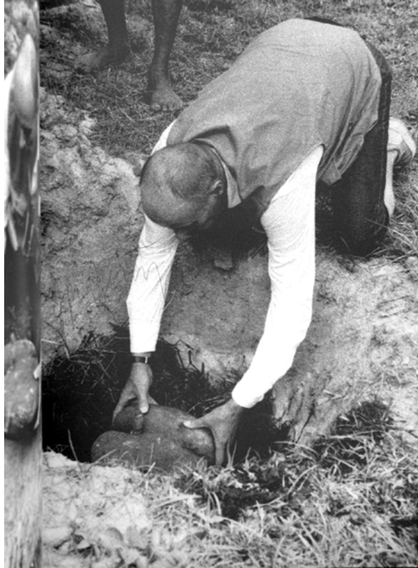
Joseph Beuys, Coconut y Coco de mer .

social, creativo y cultural. La creación de la Free Internacional University , el proyecto de los Siete mil robles o su misma implicación en la fundación del partido de Los Verdes dan cuenta de ello. Pero también la Piantagione Coconut y Coco de mer o la Piantagione Paradiso dentro de la misma Operazione , mantenían los mismos objetivos.