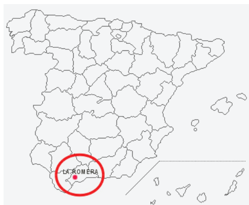
Figura 1. Localización de la cueva la Romera

Las muestras fueron recolectadas en la cueva la Romera situada en el término municipal de Cañete la Real (Málaga, Sur España) en las coordenadas UTM 30S UF1297 a 450 m sobre el nivel del mar. La cueva mide aproximadamente 500 m de longitud y unos 8 m de profundidad con una única entrada (fig. 2). La temperatura es moderada, se mantiene alrededor de los 15°C. La cueva se asienta sobre