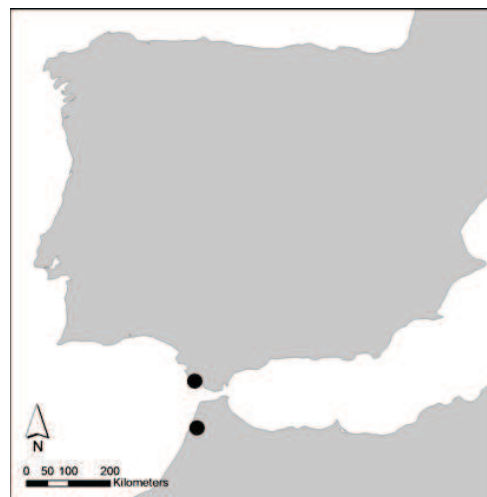
Fig. 2. Map of the known localities of Juncus maroccanus in Morocco (Kirschner et al. 2004) and Spain. Mapa de las localidades conocidas de Juncus maroccanus en Marruecos (Kirschner et al. 2004) y en España.

Until now, Juncus maroccanus was estimated to be endemic to NW Morocco (fig. 1) (Romero Zarco 2009) and Egypt (Kirschner et al. 2004). In Andalusia it was not recorded up to now (Romero Zarco 2010).