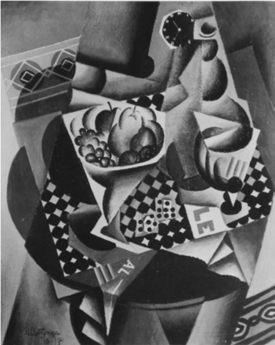
JEAN METZINGER, Nature morte avec montre et bol de fruits , 1917.