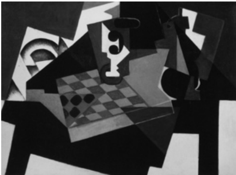
JUAN GRIS, Le Damier , 1917.