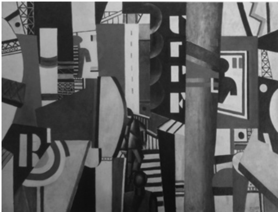
FERNAND LÉGER, La Ville , 1919.