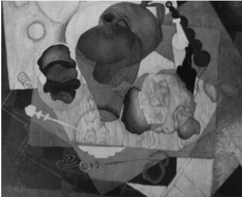
DIEGO RIVERA, Nature morte espagnole , 1915.